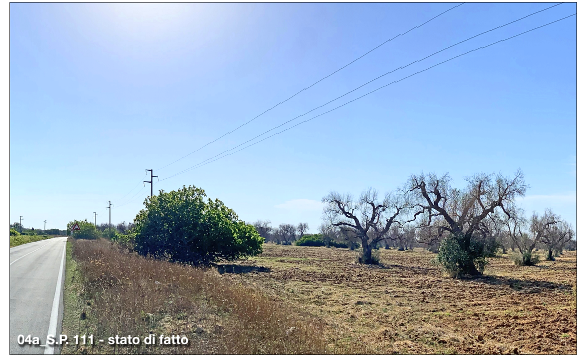
04a S.P. 111 - stato di fatto