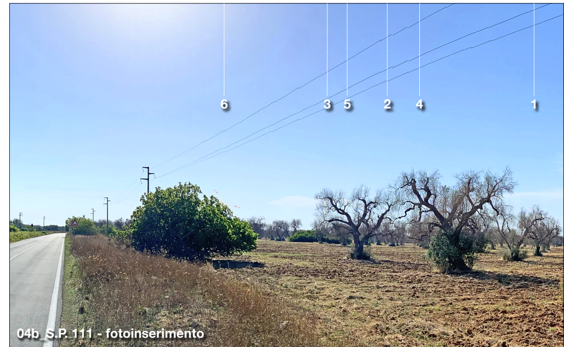
04b S.P. 111 - fotoinserimento