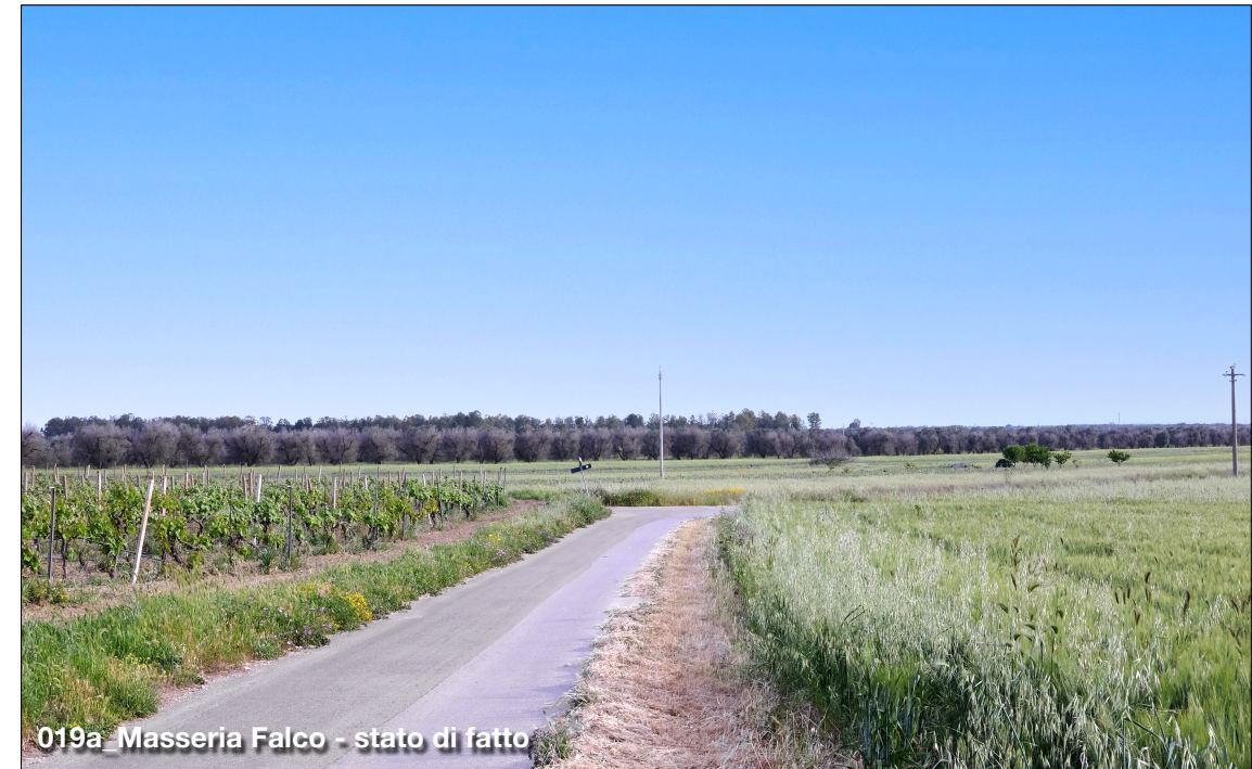
019a_Masseria Falco - stato di fatto