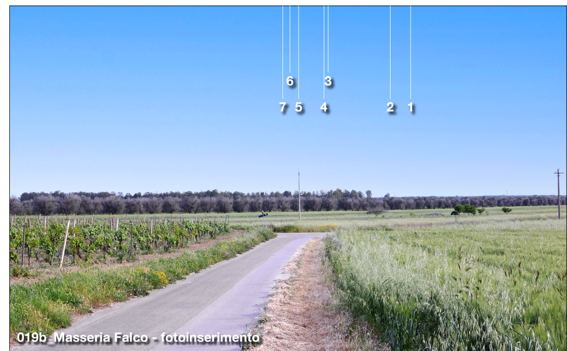
019b_Masseria Falco - fotoinserimento