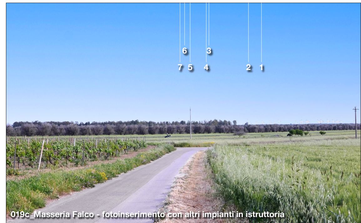
019c_Masseria Falco - fotoinserimento con altri impianti in istruttoria