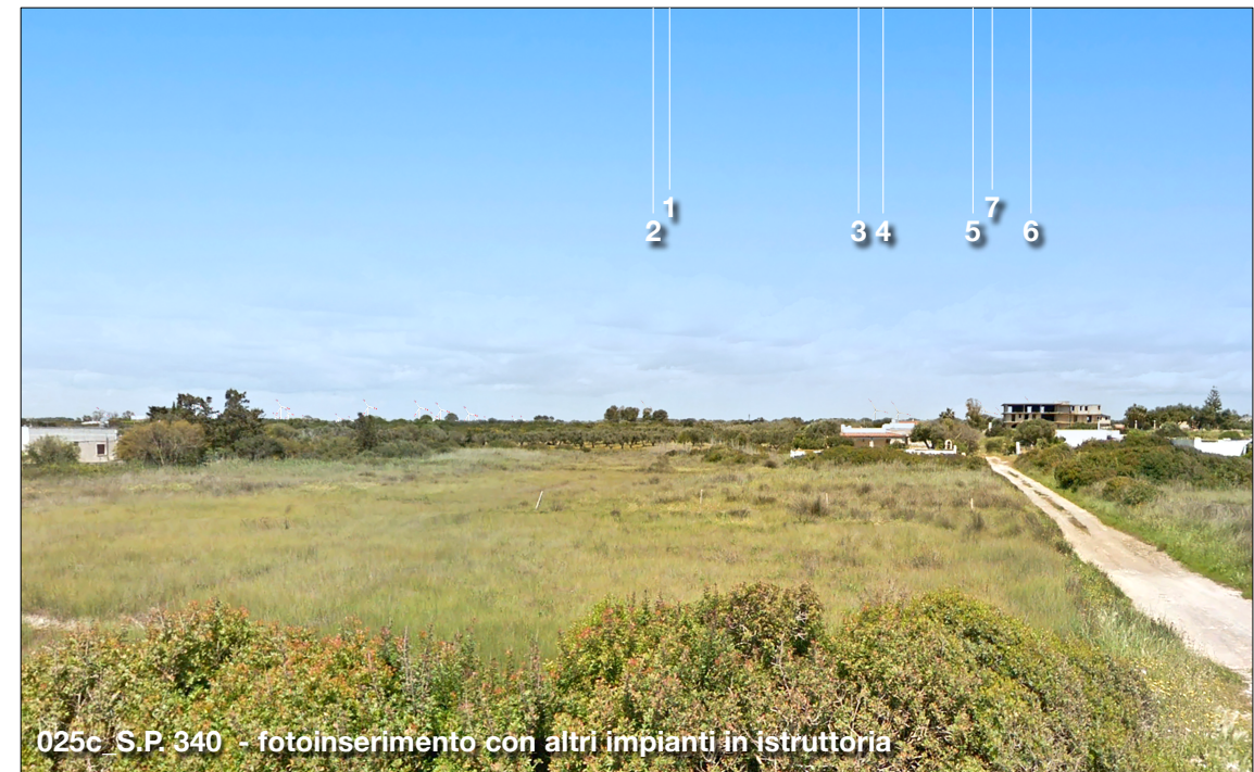
025c S.P. 340 - fotoinserimento con altri impianti in istruttoria