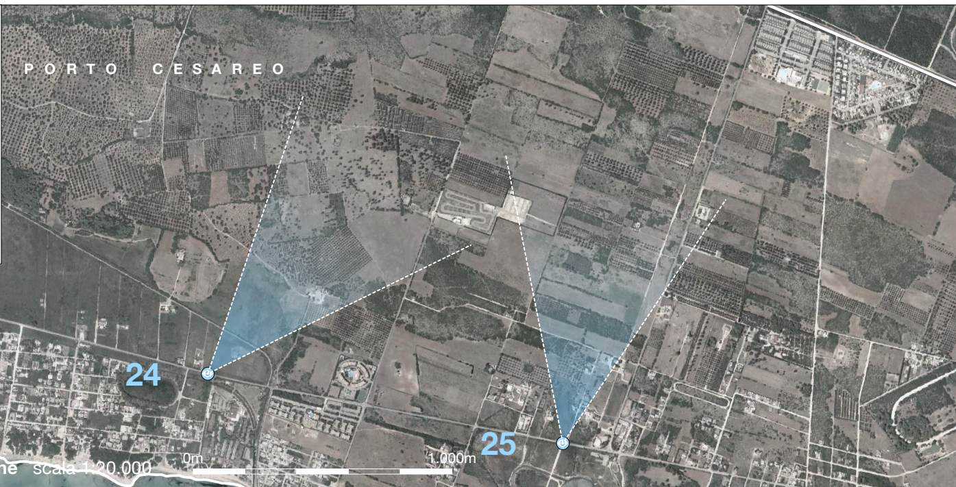
stralcio ortofoto con punti di osservazione scala 1:20.000