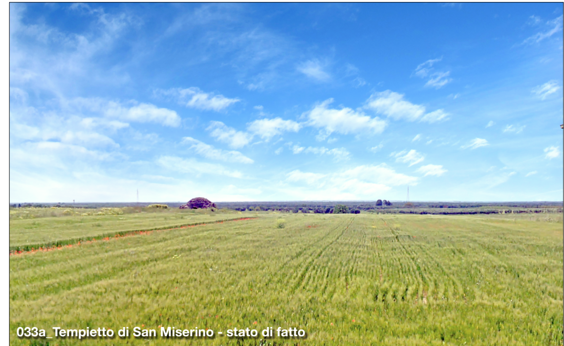
033a_Tempietto di San Miserino - stato di fatto