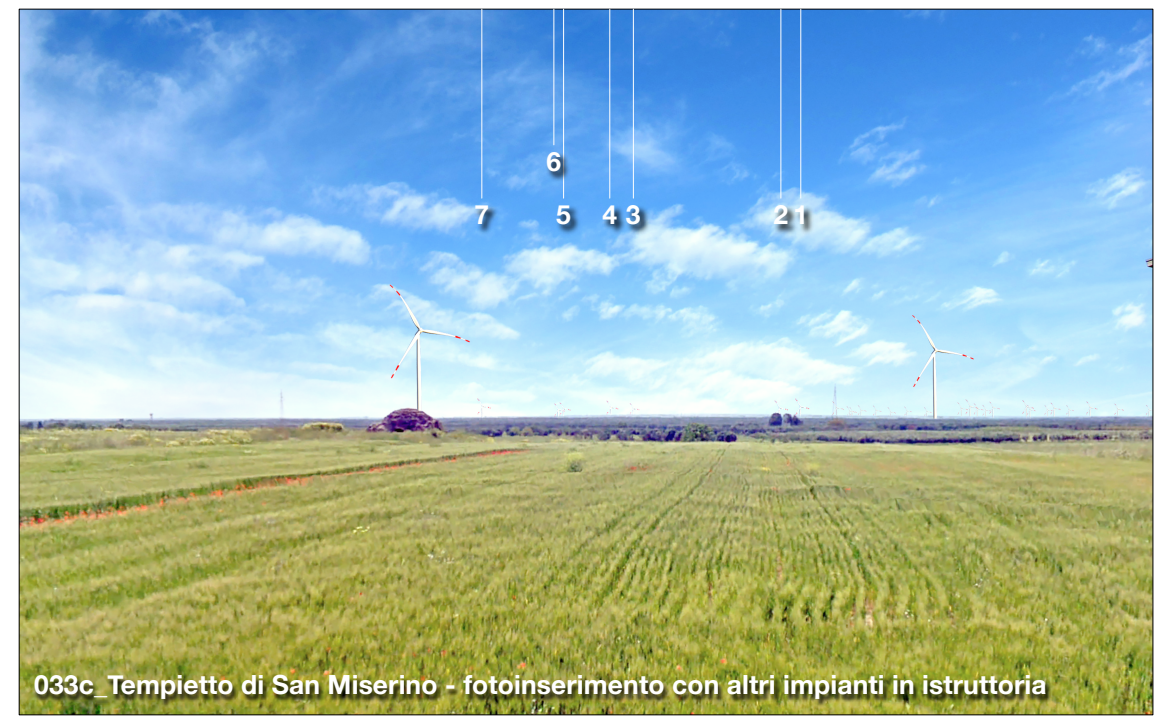
033c_Tempietto di San Miserino - fotoinserimento con altri impianti in istruttoria