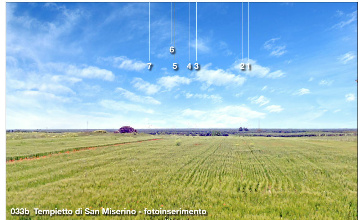
033b_Tempietto di San Miserino - fotoinserimento