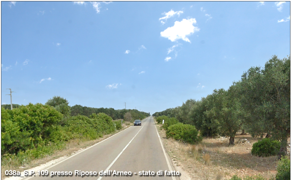
038a S.P. 109 presso Riposo dell'Arneo - stato di fatto