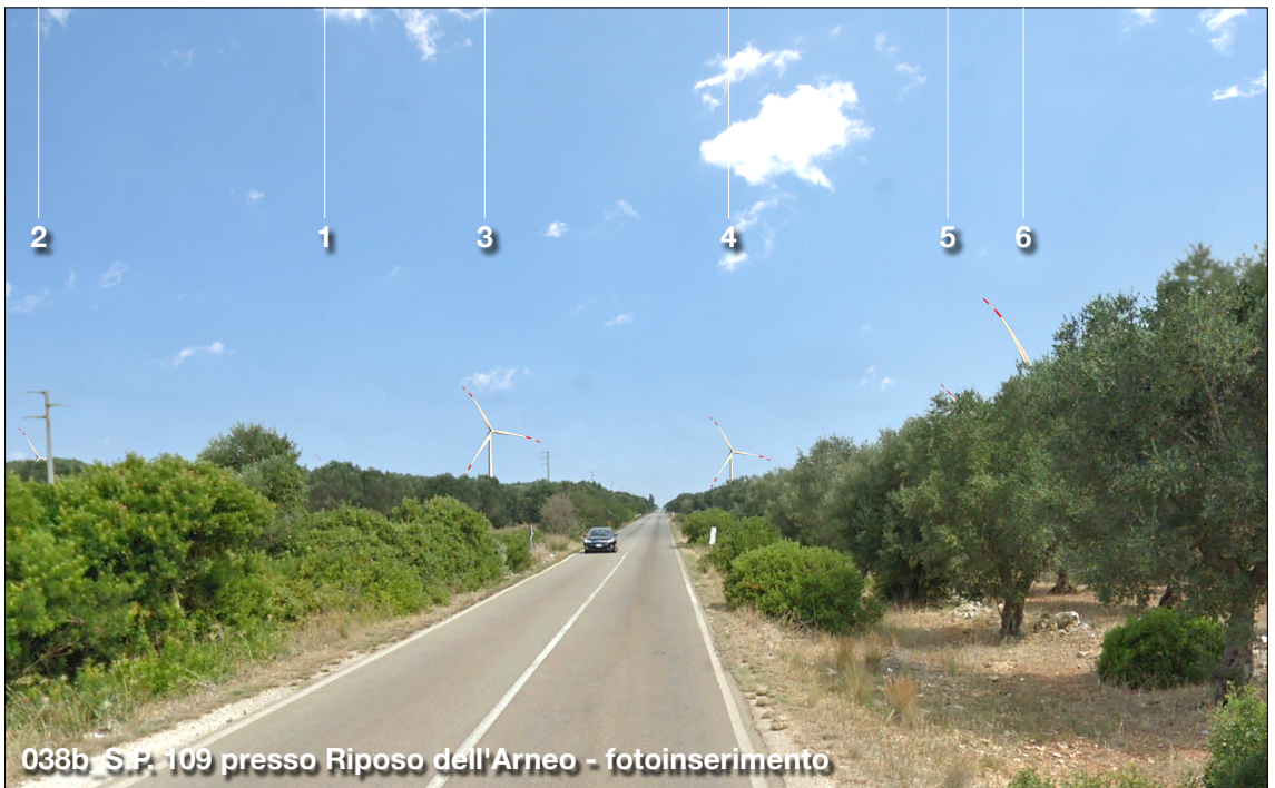
038b S.P. 109 presso Riposo dell'Arneo - fotoinserimento