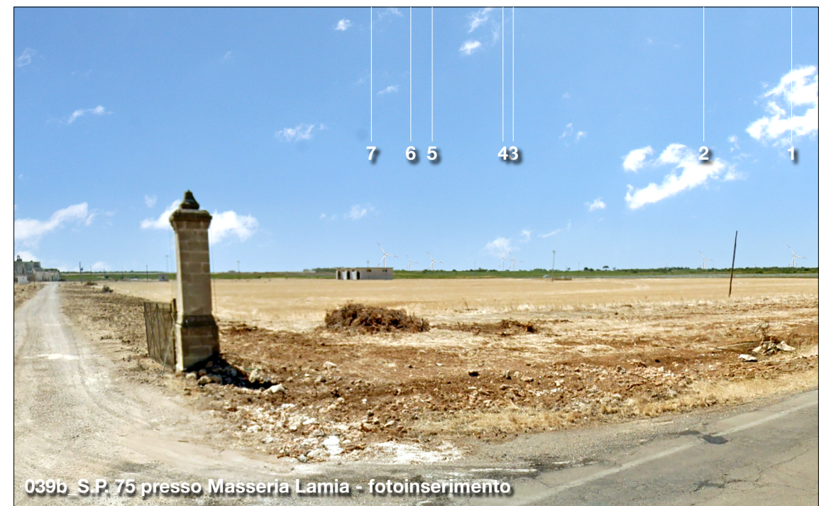
039b S.P. 75 presso Masseria Lamia - fotoinserimento