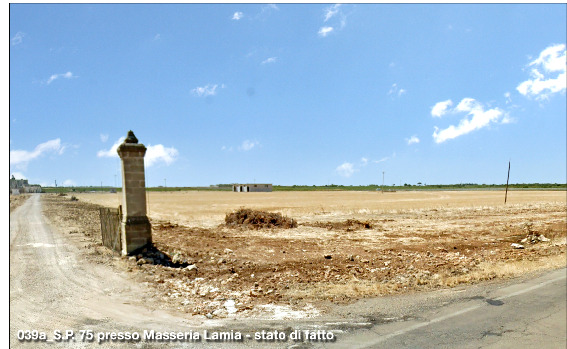
039a S.P. 75 presso Masseria Lamia - stato di fatto