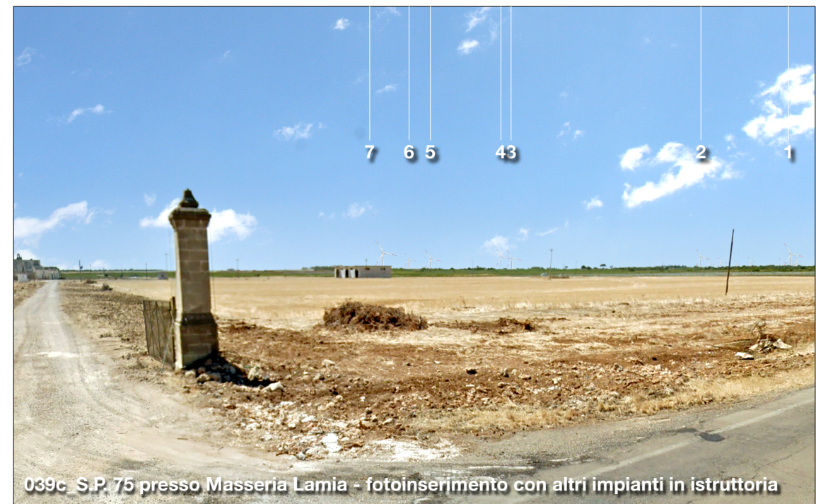
039c S.P. 75 presso Masseria Lamia - fotoinserimento con altri impianti in istruttoria