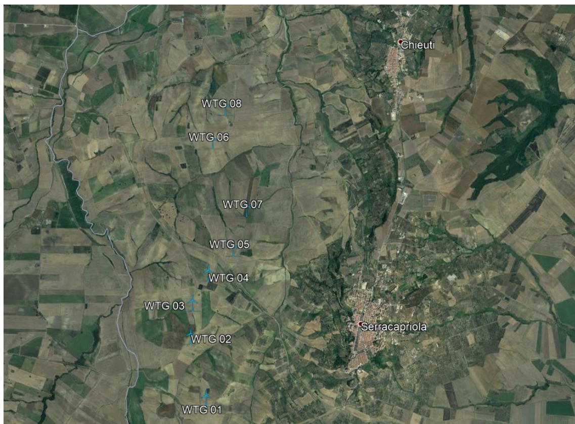
Figura 2: Layout d'impianto su Ortofoto