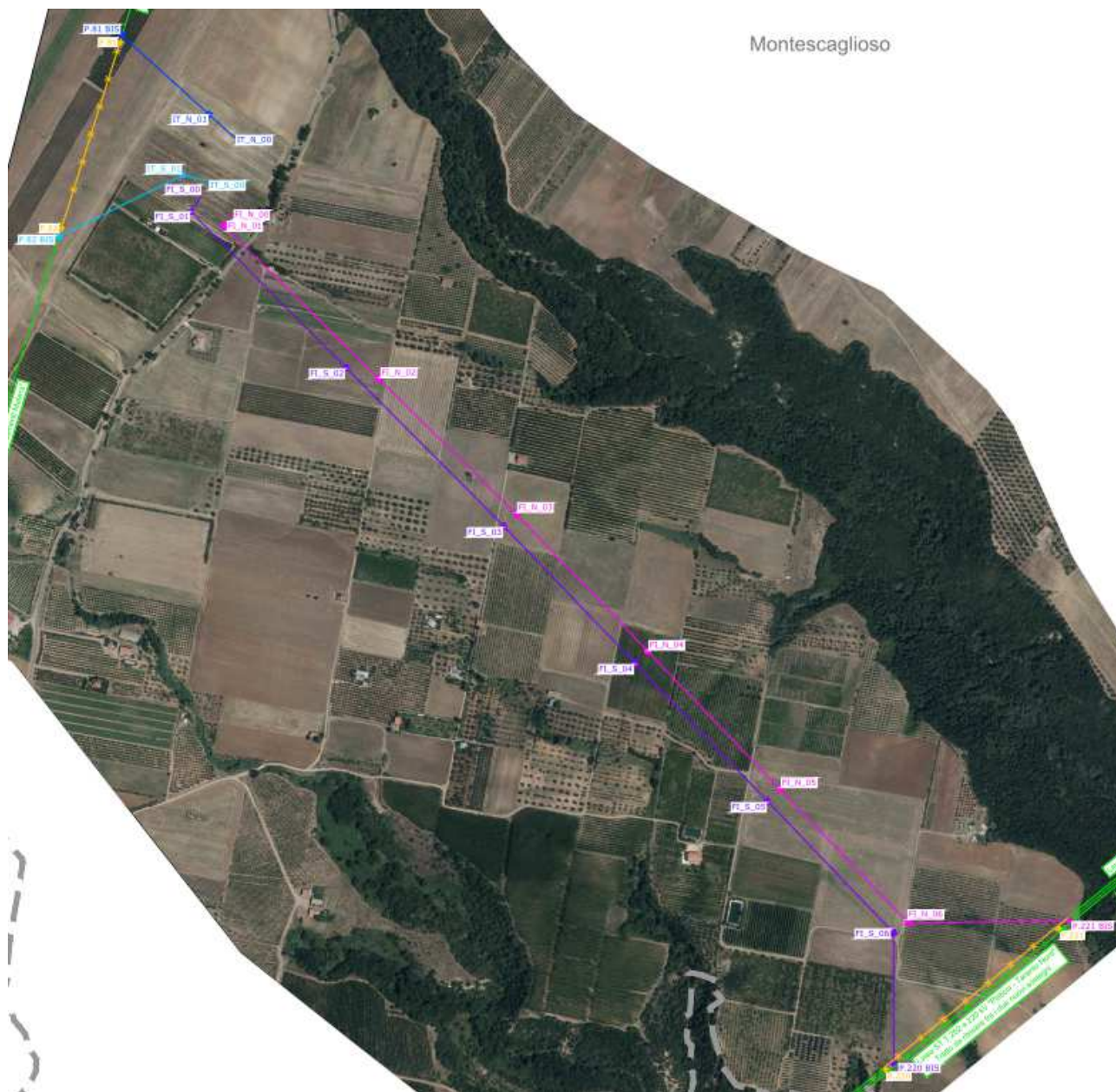
Inquadramento dell'area di progetto su base ortofoto 2019

Il territorio prevalentemente pianeggiante risulta compreso tra due importanti corsi d' Acqua il Basento a SSO ed il Bradano a N-NE ed è caratterizzato da ampi e profondi valloni di escavazione fluviale.