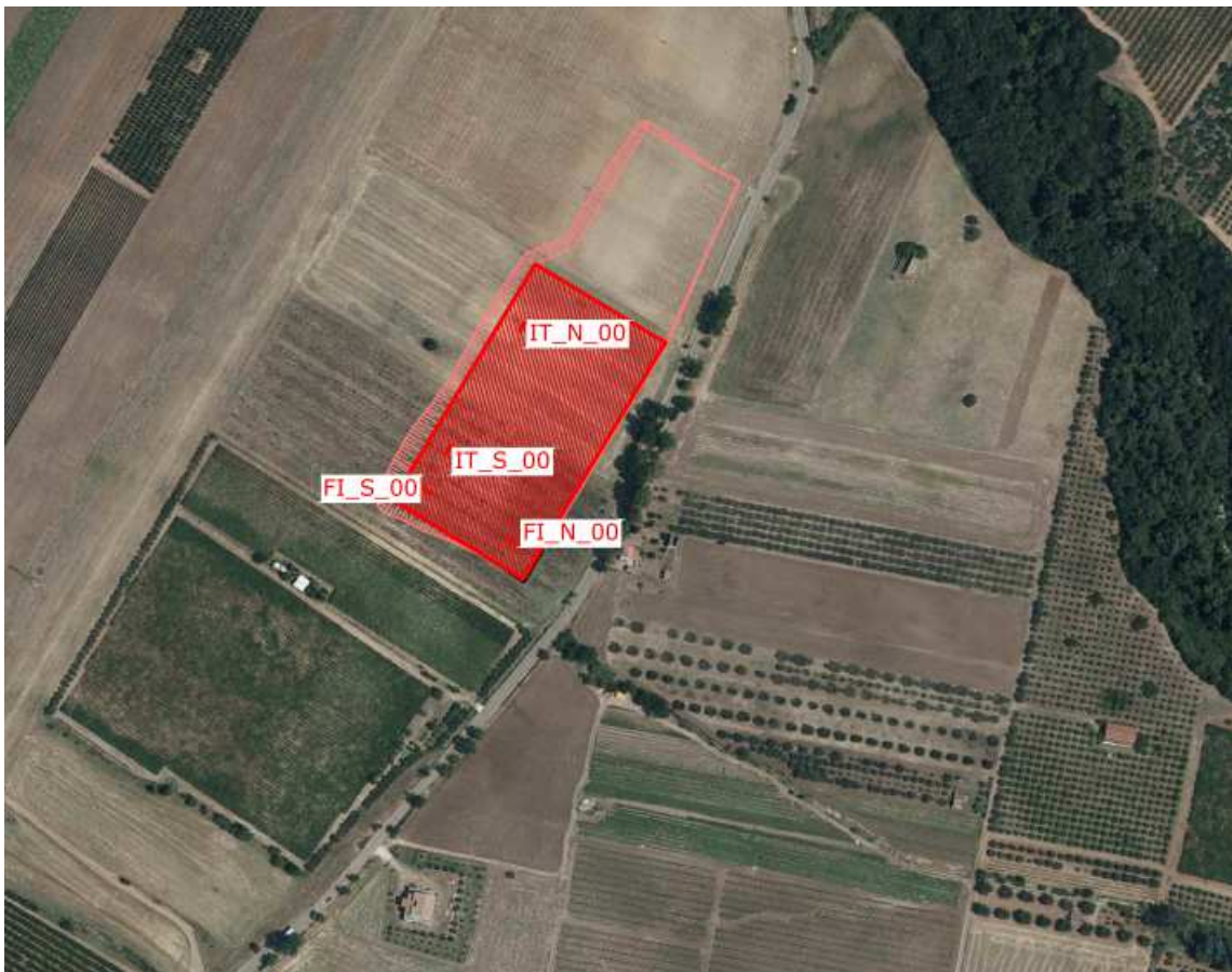
Inquadramento dell'area di progetto su base ortofoto 2013

Il territorio prevalentemente pianeggiante risulta compreso tra due importanti corsi d' Acqua il Basento a SSO ed il Bradano a N-NE ed è caratterizzato da ampi e profondi valloni di escavazione fluviale.