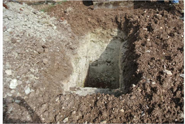
Trincea di campionamento