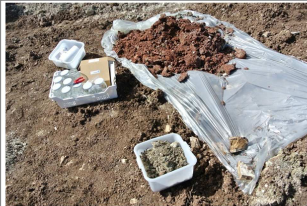
Deposito materiale scavato