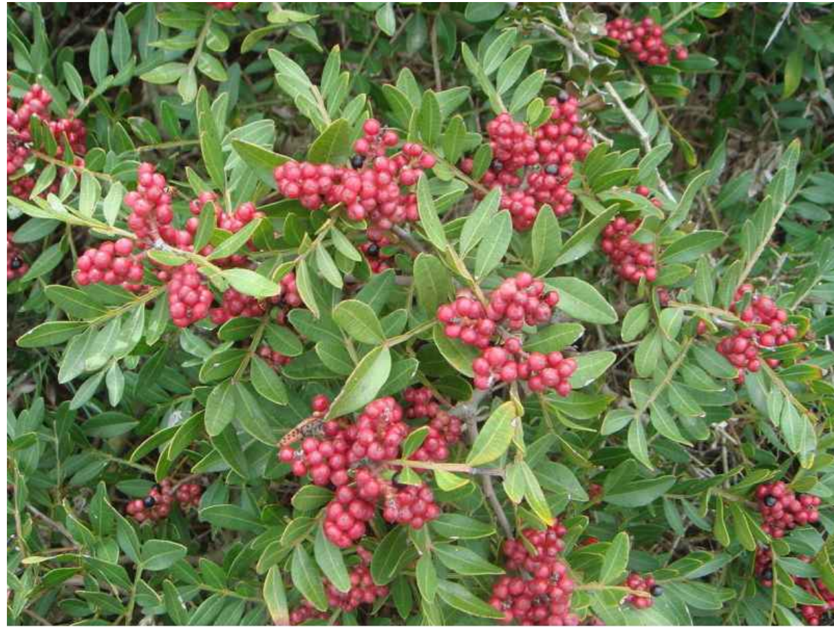
SPECIE ARBOREA AUTOCTONA (LENTISCO O SIMILARI)