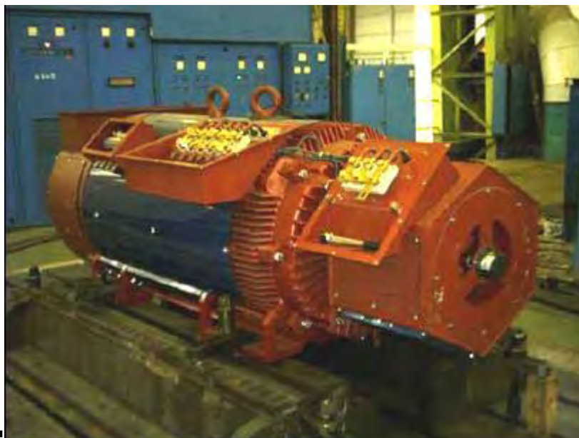
Figura 5: generatore

Tanto l'acciaio quanto il rame sono destinati al riciclaggio come rottame. Bisogna prestare particolare attenzione al recupero del rame, a causa del suo elevato costo sul mercato.