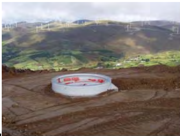
Figura 12: fondazione