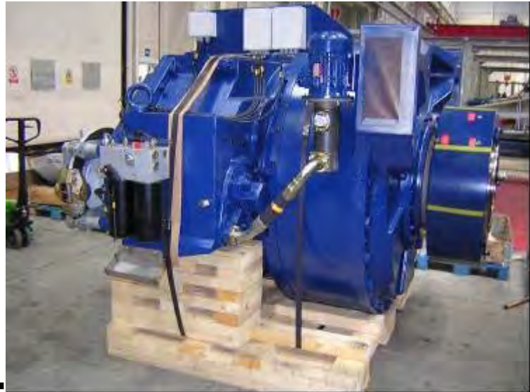
Figura 3: moltiplicatore

Sia gli oli che i filtri dell'olio si ricicleranno tramite un gestore autorizzato mediante processi di valorizzazione energetica.