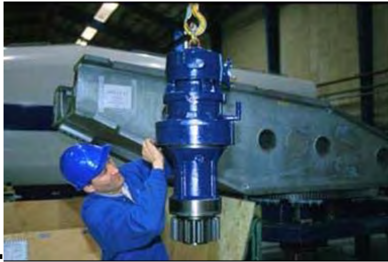
Figura 6: motori di giro e riduttori