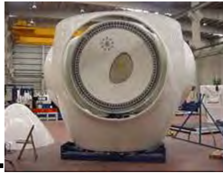
Figura 1: mozzo