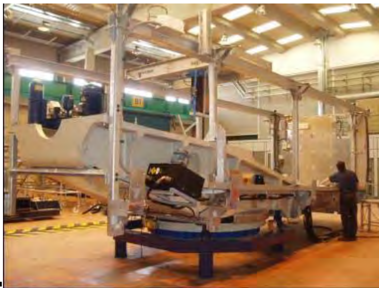
Figura 9: telaio anteriore e posteriore

I telai sono fabbricati in acciaio meccanizzato saldato e la sua struttura è progettata specificatamente per il supporto della struttura della navicella, pertanto una volta arrivati alla fine della vita utile dell'aerogeneratore vengono riciclati come rottame.