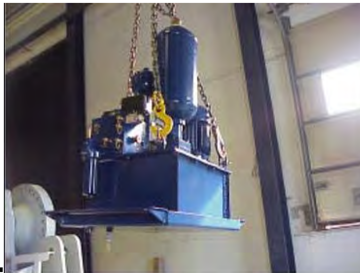
Figura 7: gruppo di pressione

Nel caso in cui si trovi in buono stato potrà essere riutilizzato come ricambio.