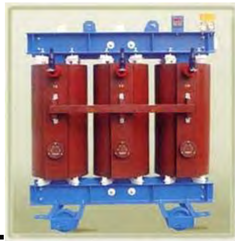
Figura 8: trasformatore

I materiali costituenti l'armatura e la carcassa esteriore verranno rottamati, così come il rame generato che si recupererà per la sua rifusione.