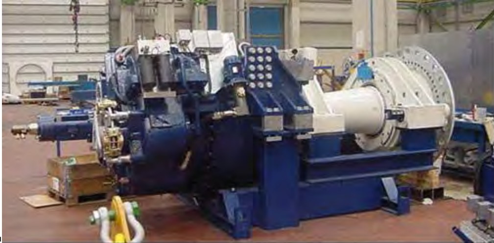
Figura 4: asse di alta velocità