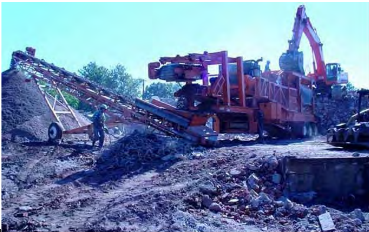
Figura 14: demolizione