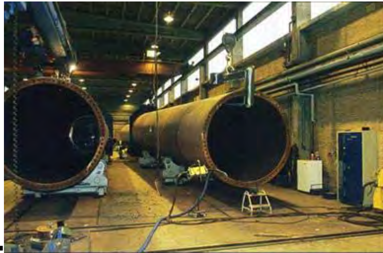
Figura 11: torri

L'opzione più attuabile relativamente alla gestione finale dei trami che costituiscono le torri è il riciclaggio come rottame.