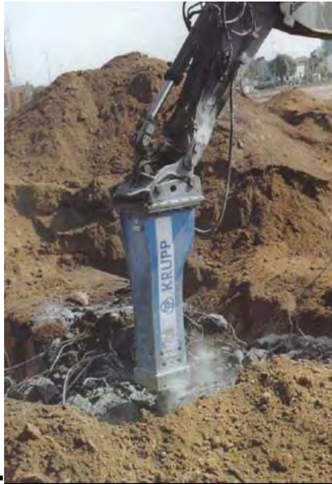
Figura 13: trivellazione

Il passo seguente sarà il taglio, mediante cesoie idrauliche, dei cavi di ferro forgiato, in modo tale che si possano separare ed essere facilmente maneggiabili. Una volta realizzato questo processo ci sono due opzioni per il ritiro e la gestione dei residui provenienti dalla demolizione.