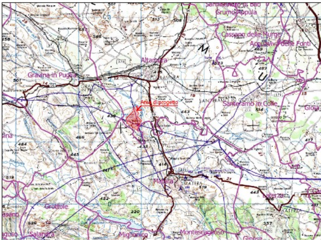
Figura 1- Inquadramento geografico