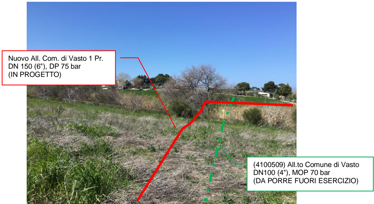
Foto n.3 – Km 0+492 - Panoramica metanodotti in progetto e da porre fuori esercizio