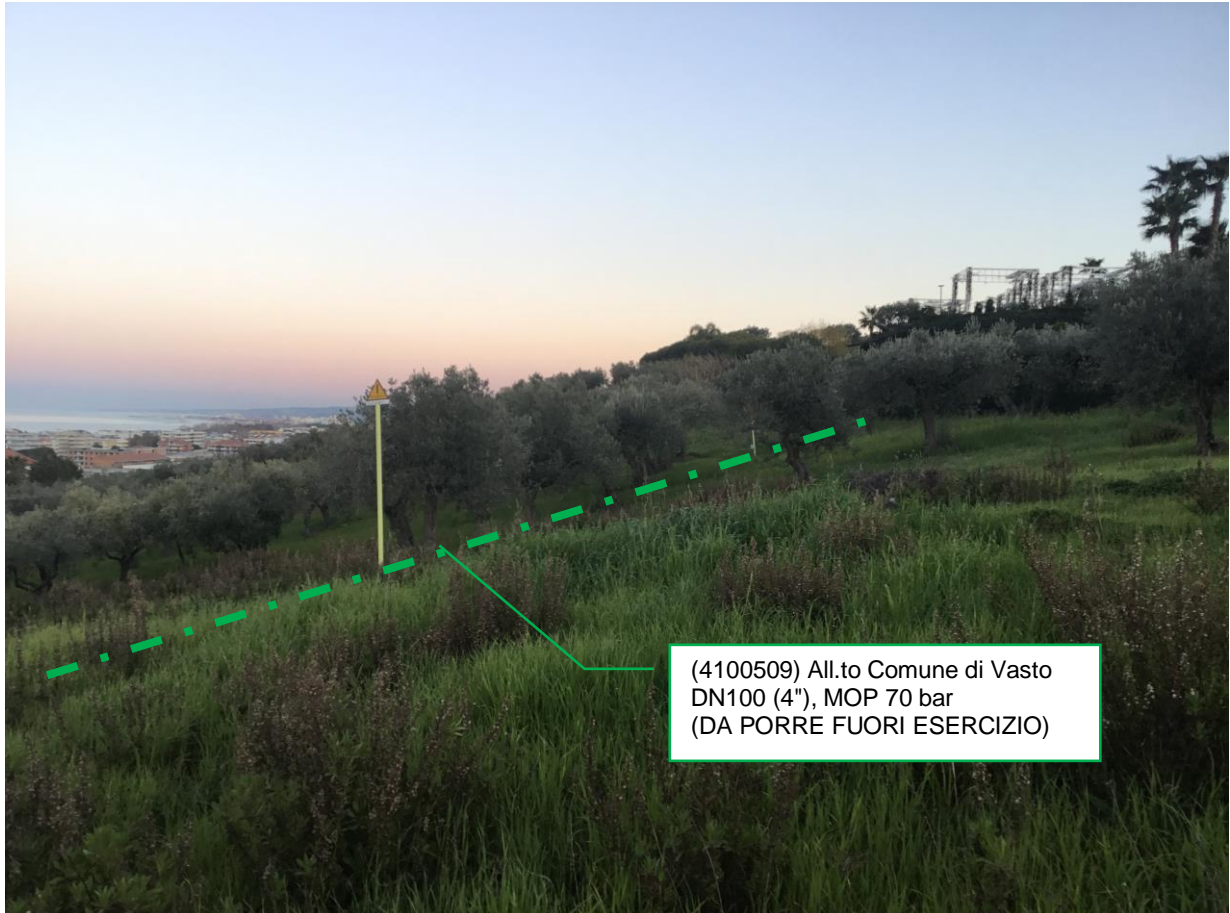
Foto n.10 – Km 3+750 - All.to Comune di Vasto DN100 (4''), MOP 70 bar (DA PORRE FUORI ESERCIZIO)