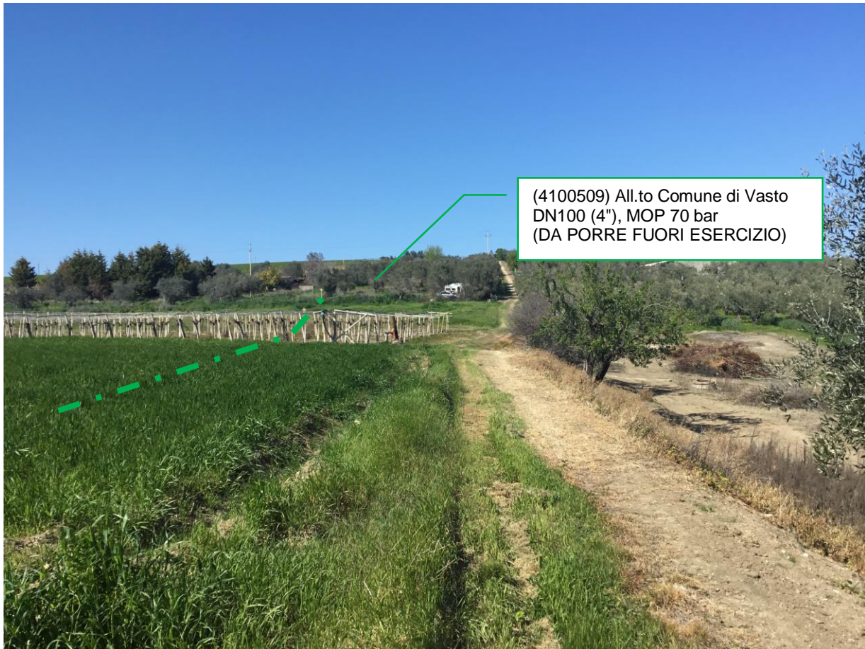
Foto n.5 – Km 1+033 All.to Comune di Vasto DN100 (4''), MOP 70 bar (DA PORRE FUORI ESERCIZIO)