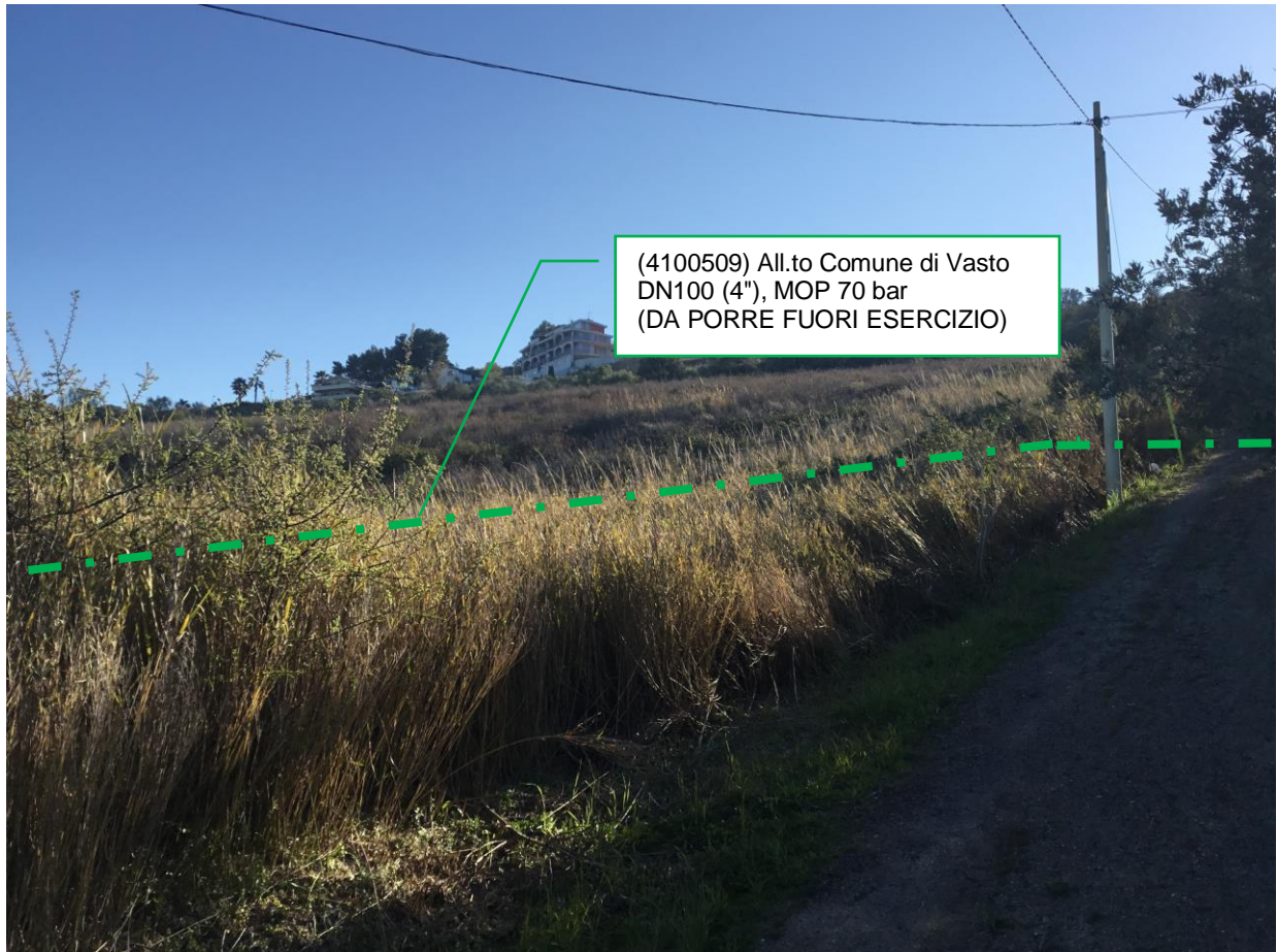
Foto n.9 – Km 3+137 - All.to Comune di Vasto DN100 (4"), MOP 70 bar (DA PORRE FUORI ESERCIZIO)