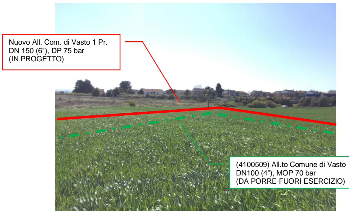
Foto n.2 – Km 0+290 - Vista metanodotti in progetto e da porre fuori esercizio