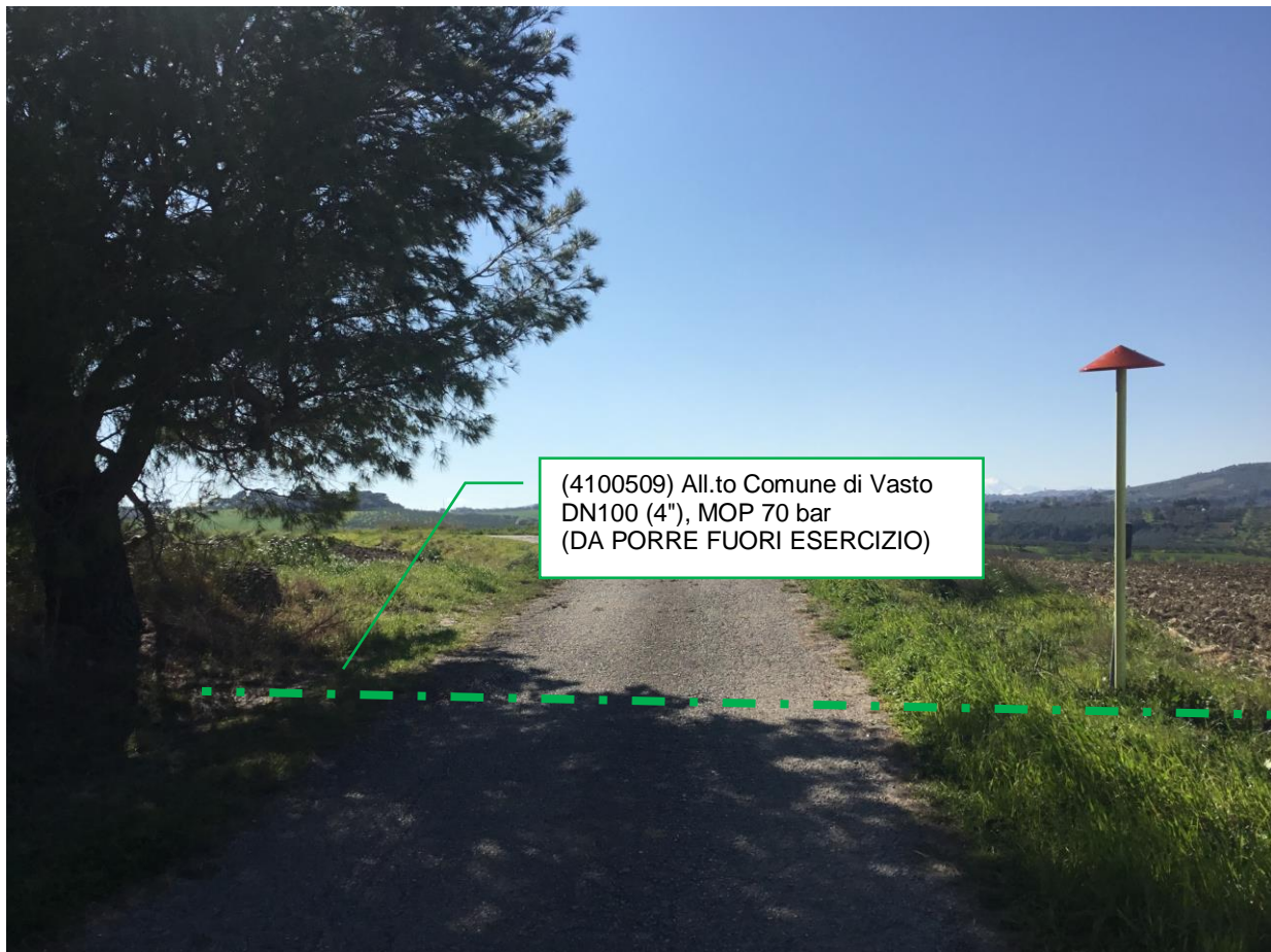
Foto n.7 – Km 1+700 - Metanodotto da porre fuori esercizio – 1° attraversamento su strada Via Selvotta