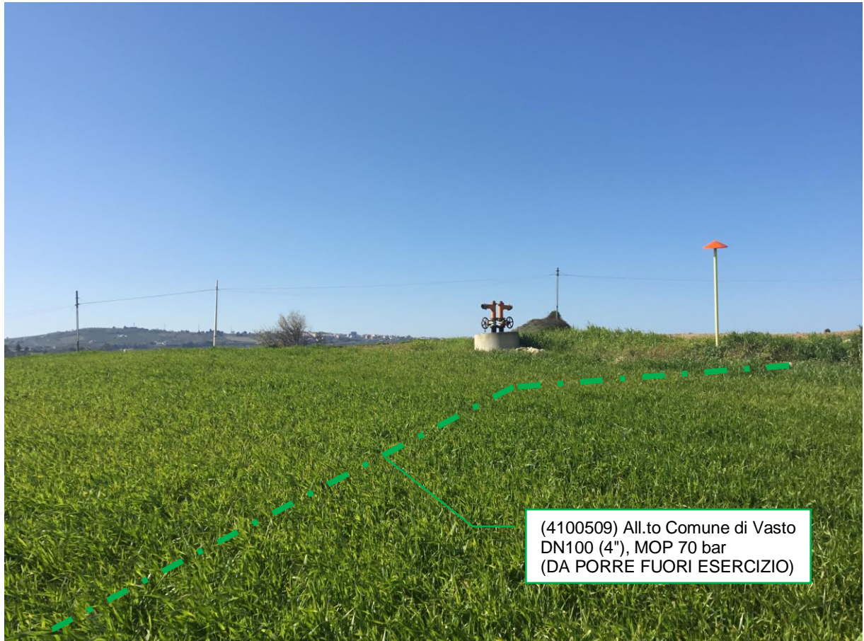
Foto n.6 – Km 1+354 - All.to Comune di Vasto DN100 (4''), MOP 70 bar (DA PORRE FUORI ESERCIZIO)