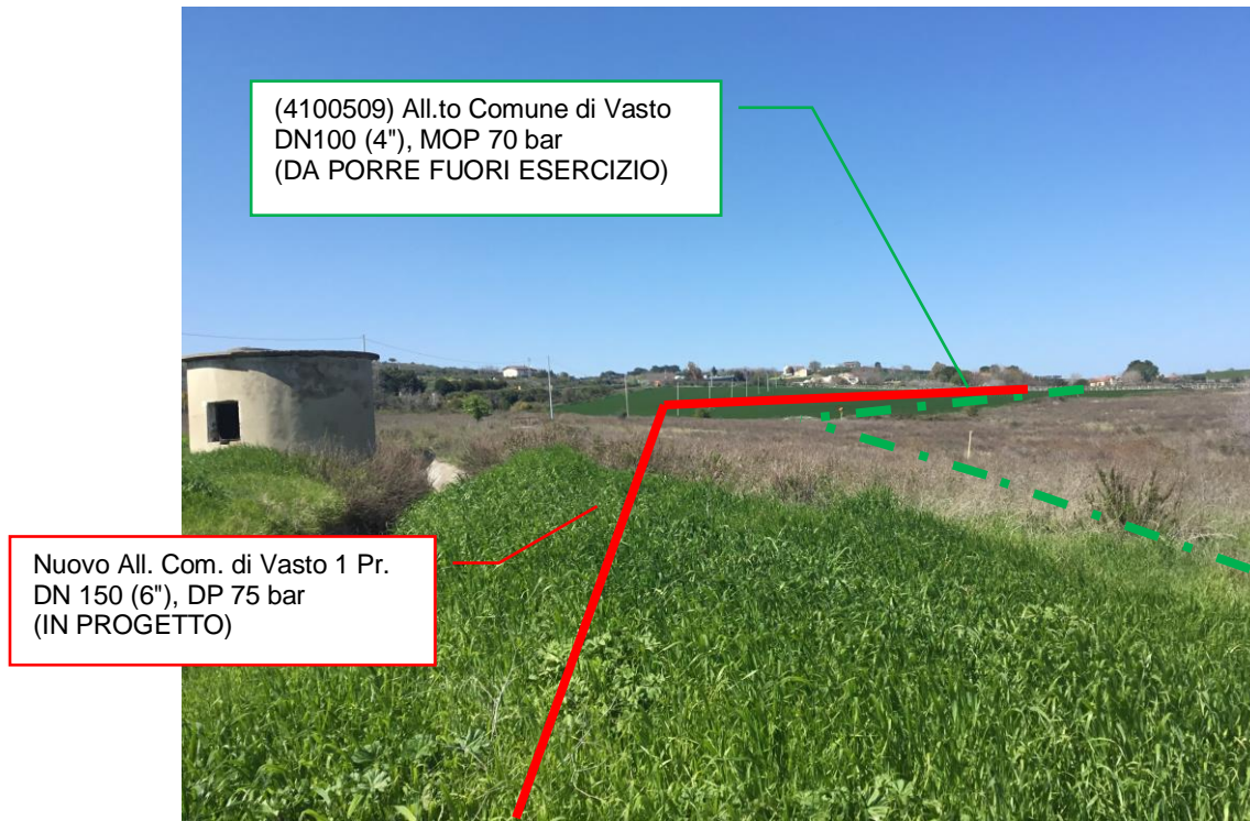
Foto n.1 – Km 0+010 - Panoramica metanodotti in progetto e da porre fuori esercizio