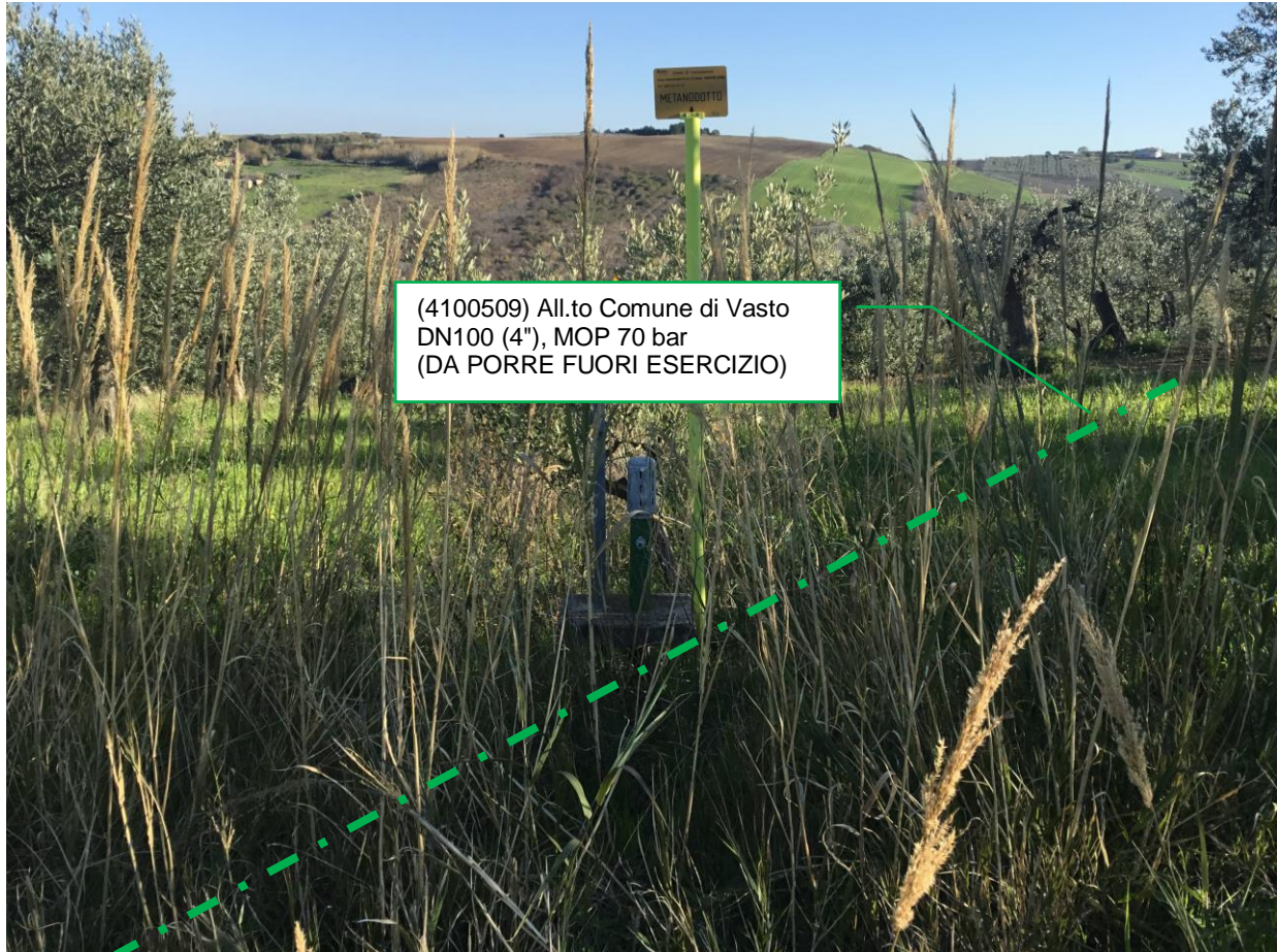
Foto n.8 – Km 2+615 - Metanodotto da porre fuori esercizio – 2° attraversamento su strada Via Selvotta