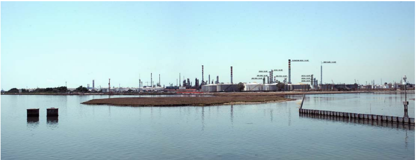
Figura 6: Inserimento paesaggistico raffineria di Venezia scenario futuro (punto di vista n.3 dal ponte della Libertà)