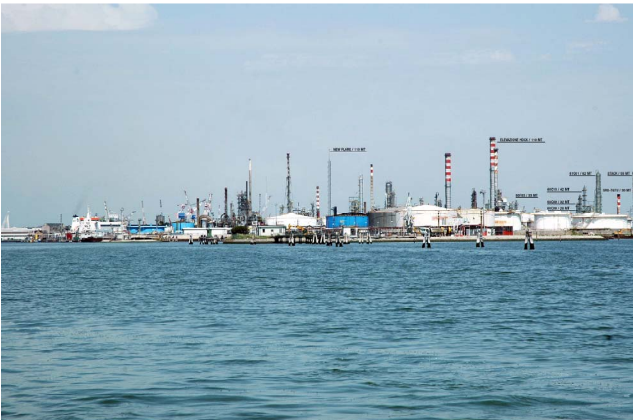
Figura 2: Inserimento paesaggistico Raffineria di Venezia scenario futuro (punto di vista n.1 dalla laguna)