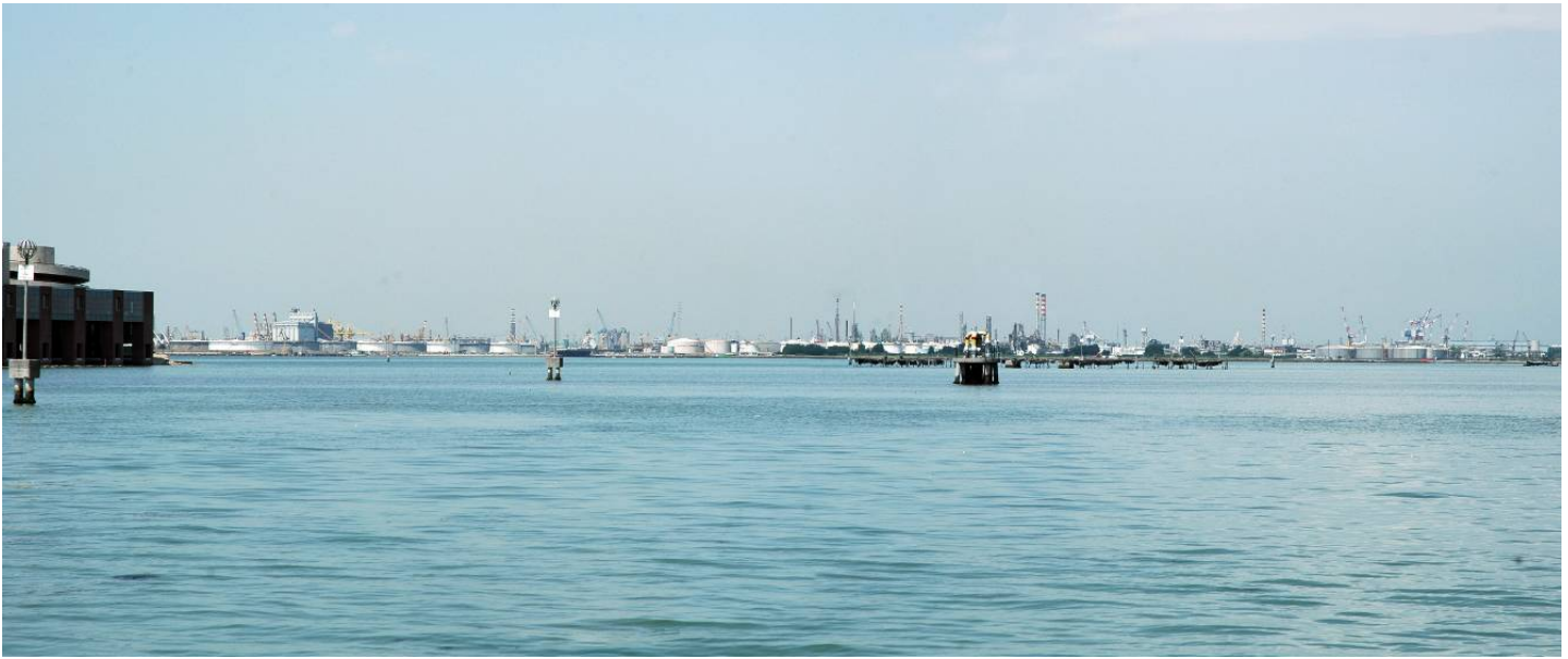
Figura 3: Inserimento paesaggistico raffineria di Venezia scenario attuale (punto di vista n.2 dalla città di Venezia)