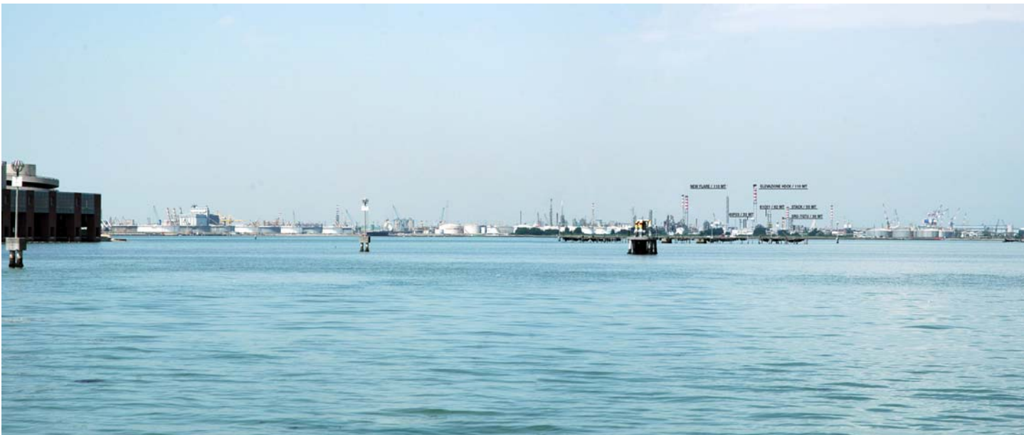
Figura 4: Inserimento paesaggistico raffineria di Venezia scenario futuro (punto di vista n.2 dalla città di Venezia)