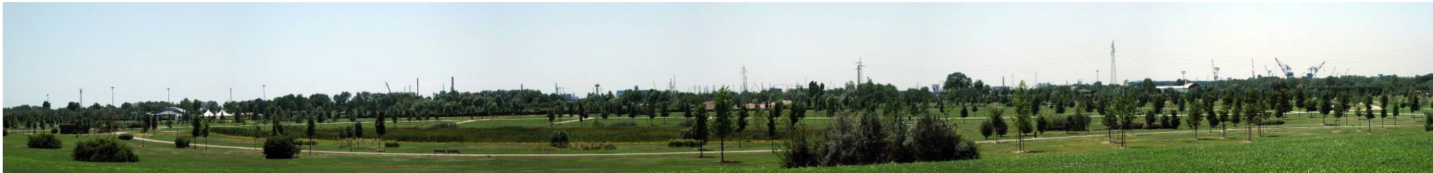
Figura 7: Inserimento paesaggistico raffineria di Venezia scenario attuale (punto di vista n.4 da nord)