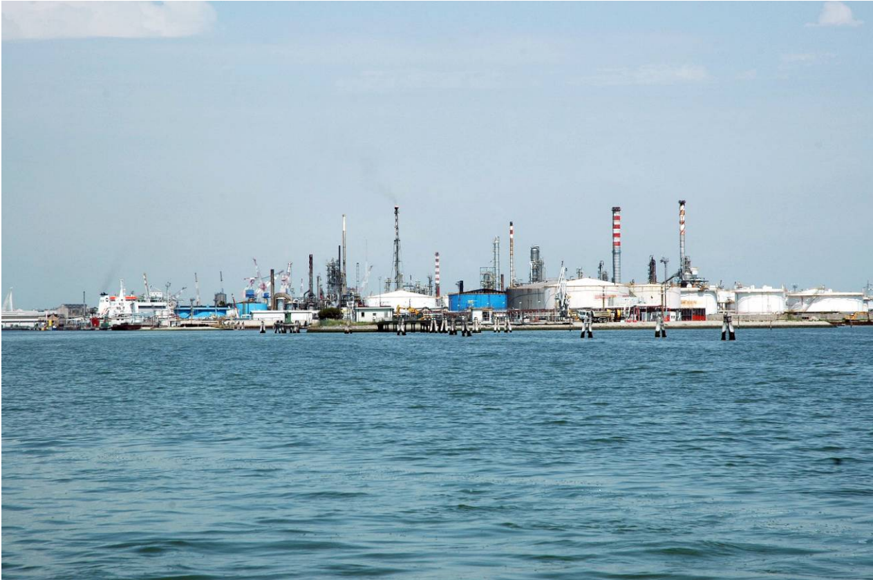
Figura 1: Inserimento paesaggistico raffineria di Venezia scenario attuale (punto di vista n.1 dalla laguna)