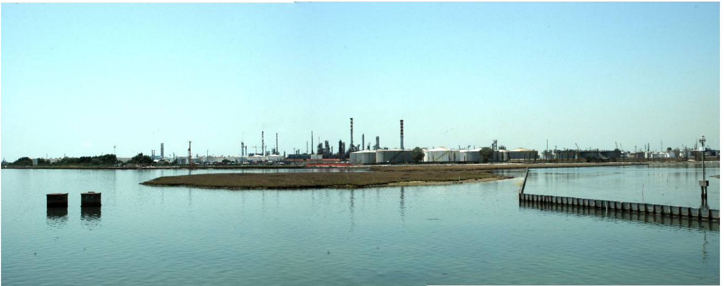
Figura 5: Inserimento paesaggistico raffineria di Venezia scenario attuale (punto di vista n.3 dal ponte della Libertà)