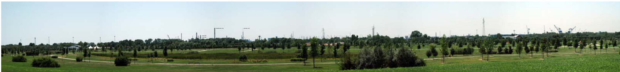
Figura 8: Inserimento paesaggistico raffineria di Venezia scenario futuro (punto di vista n.4 da nord)