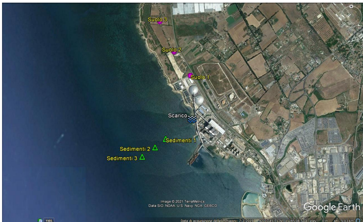
Figura 2 Stazioni di campionamento di suoli e sedimenti