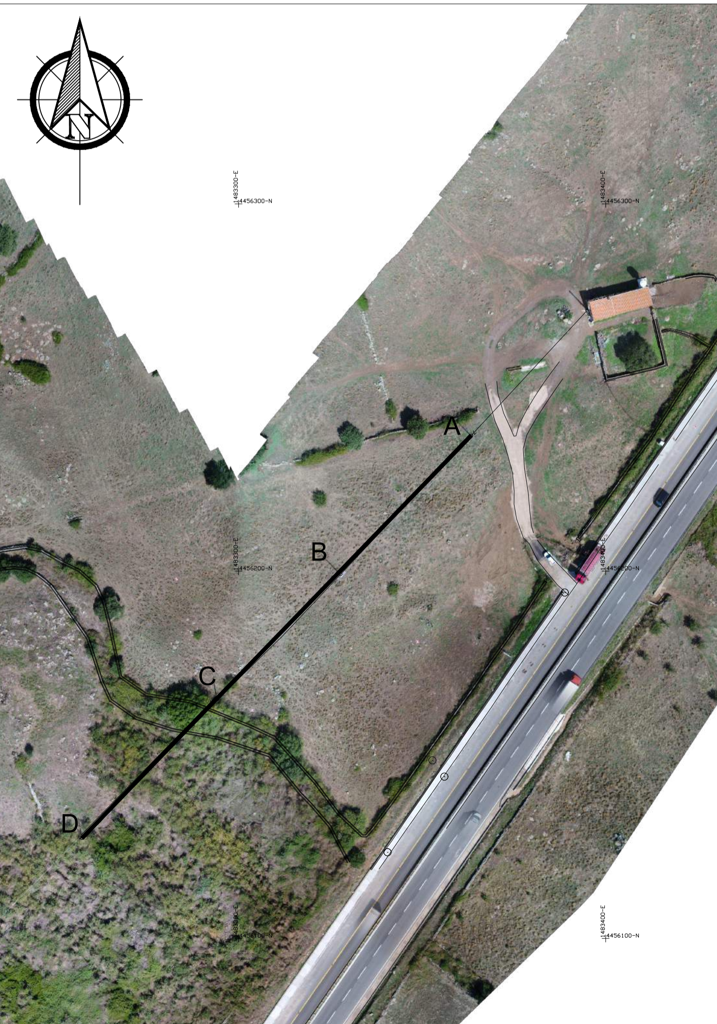
Planimetria scala 1 / 1.000