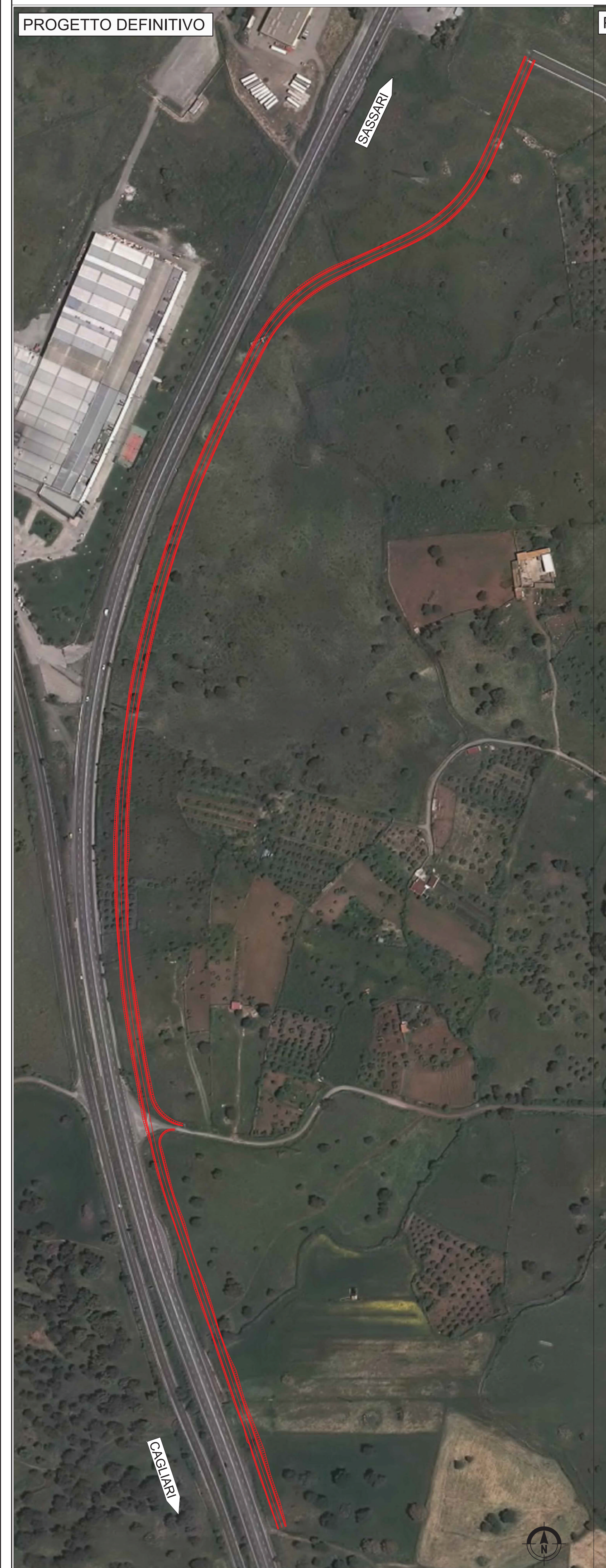
S06 - Accesso al Km 135+690 scala 1:2.000