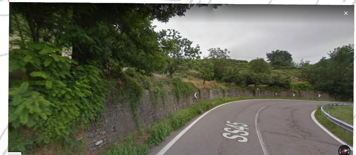
Demolizione muri m 46,00