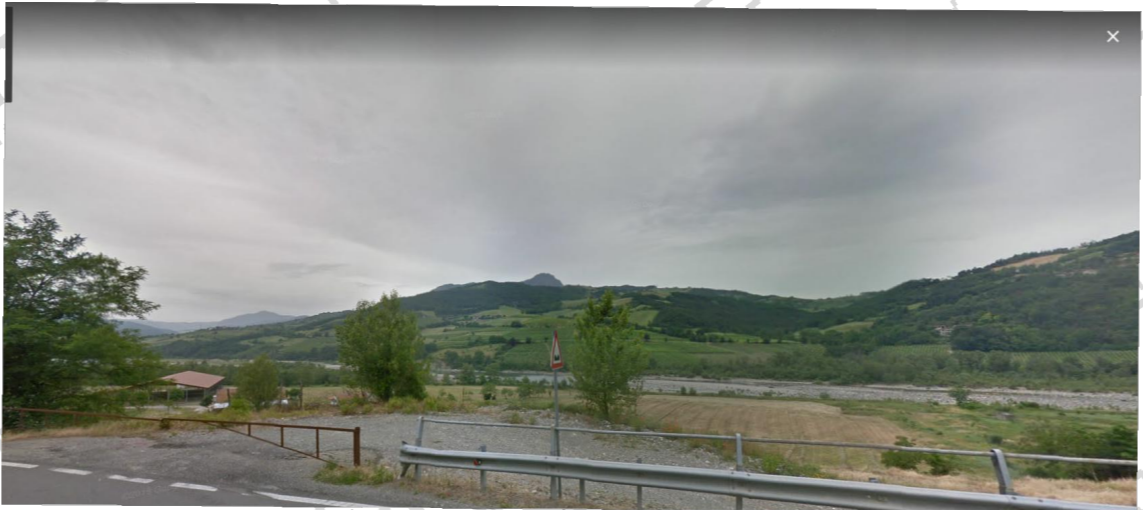
Demolizione muri m 35,20