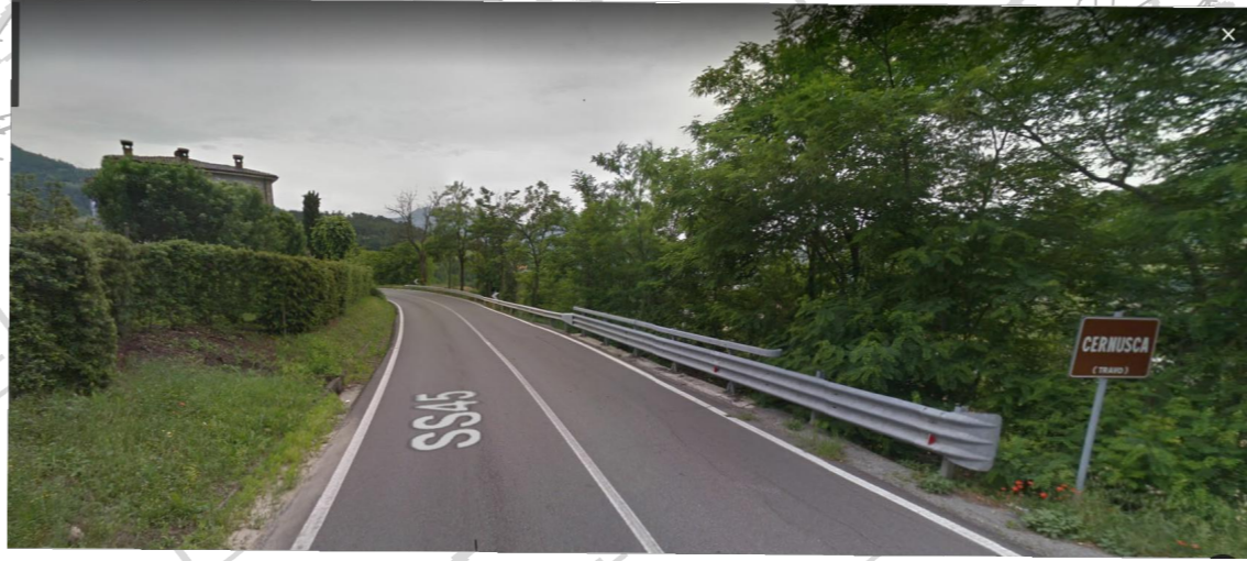
Demolizione tombino m 3,50