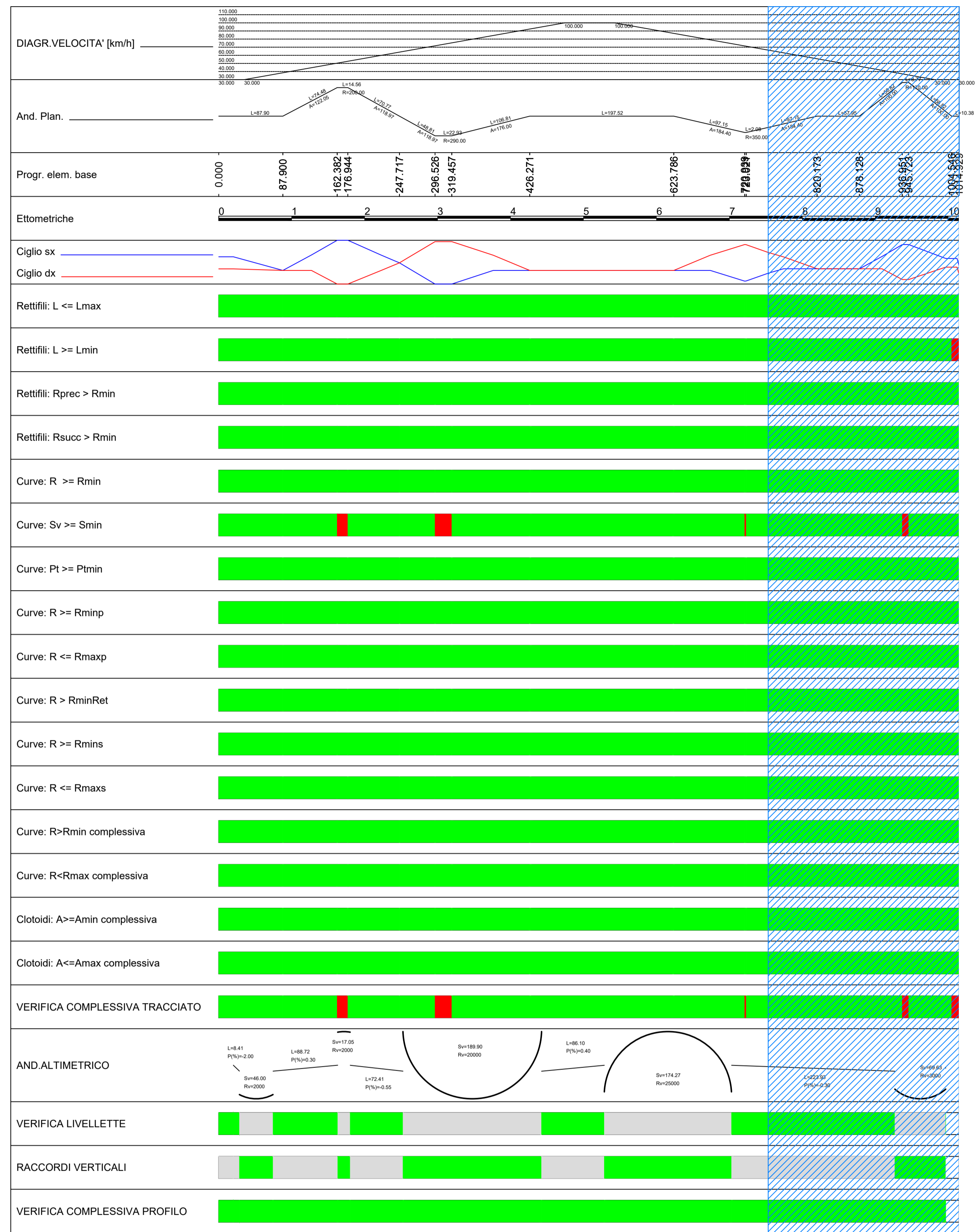
DIAGRAMMA DI VELOCITA' (FLUSSO LIBERO) E VERIFICHE Scala 1: 2000.000

Loc. CASINO D'AGNELLI Velocità imposta = 50 km/h (Vp,max = 60 km/h)