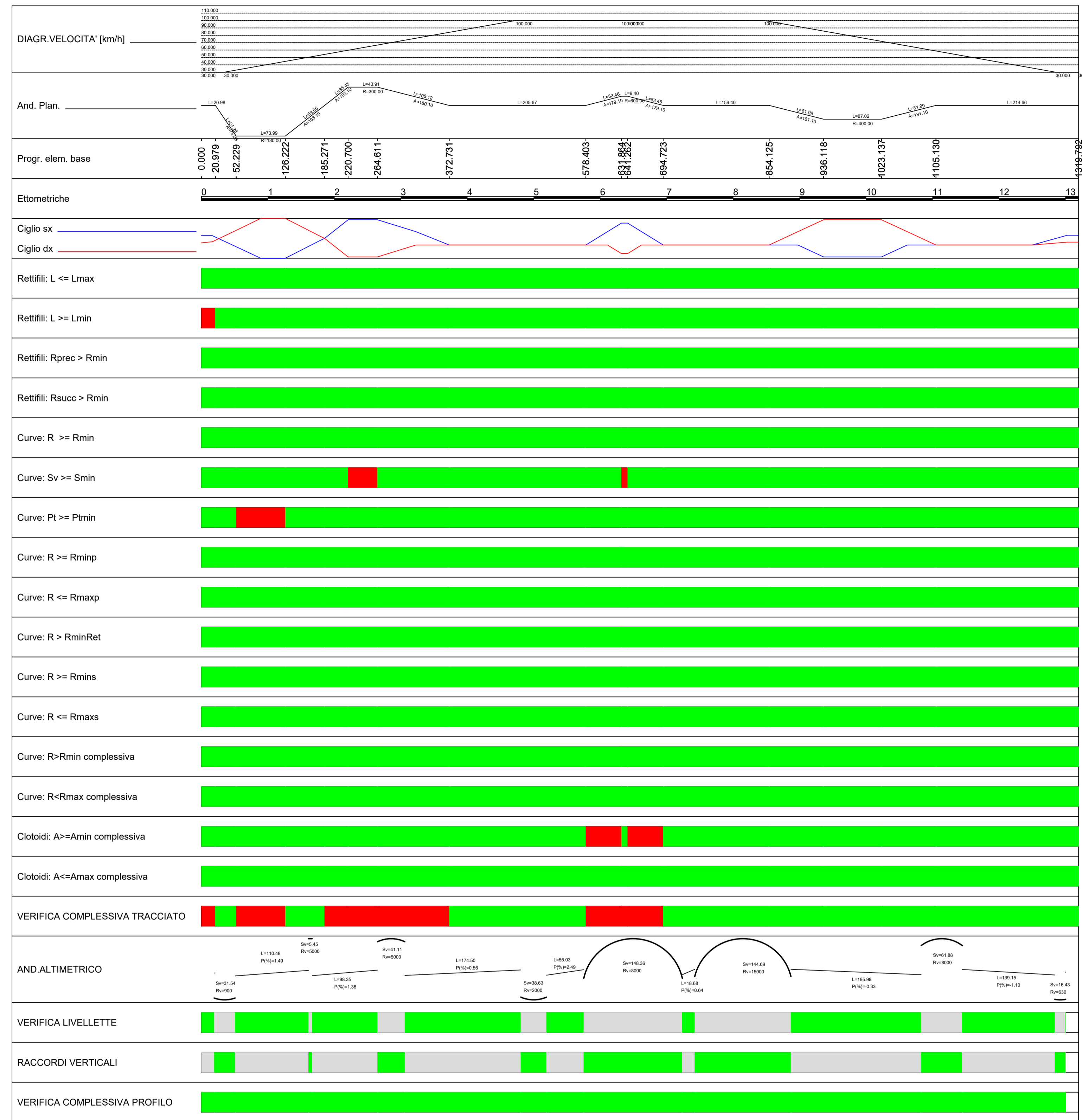
DIAGRAMMA DI VELOCITA' (FLUSSO LIBERO) E VERIFICHE Scala 1: 2000.000