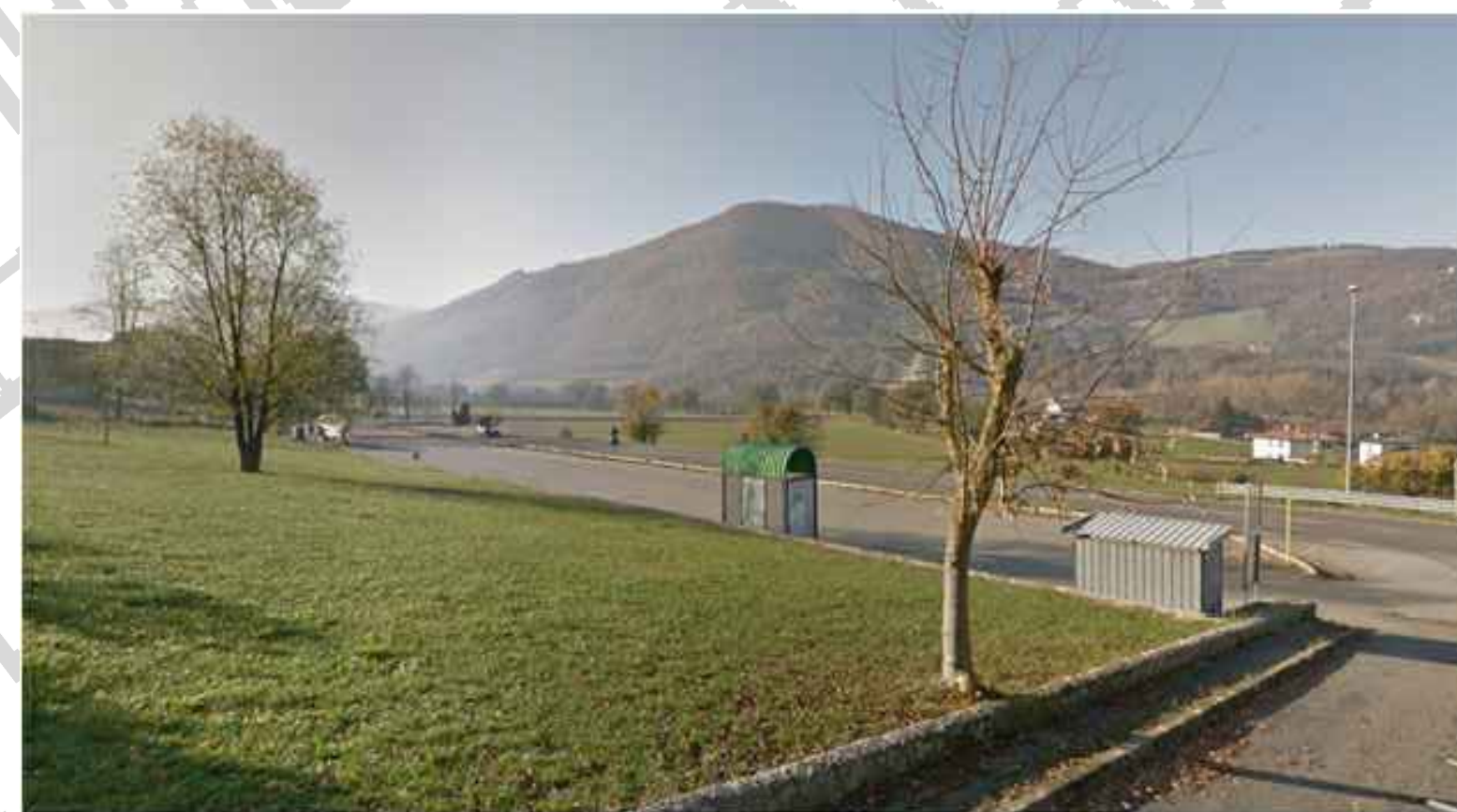
Punto di vista A cantiere di base B1