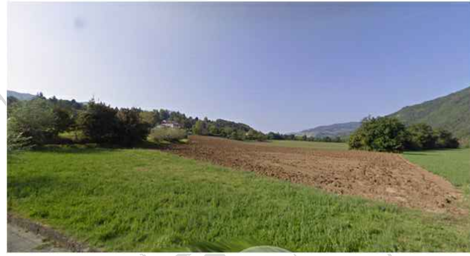
Punto di vista A cantiere di servizio CS1