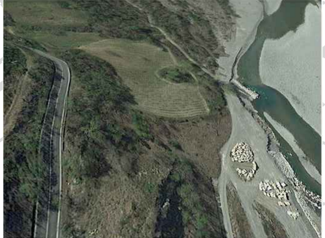
Punto di vista A cantiere di servizio CS3 Punto di vista B cantiere di servizio CS3