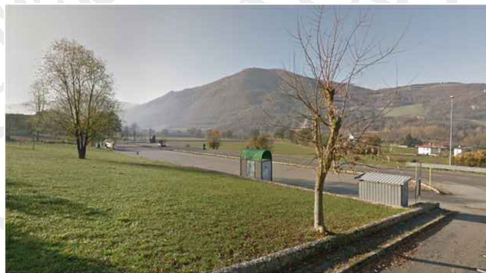
Punto di vista A cantiere di base B1