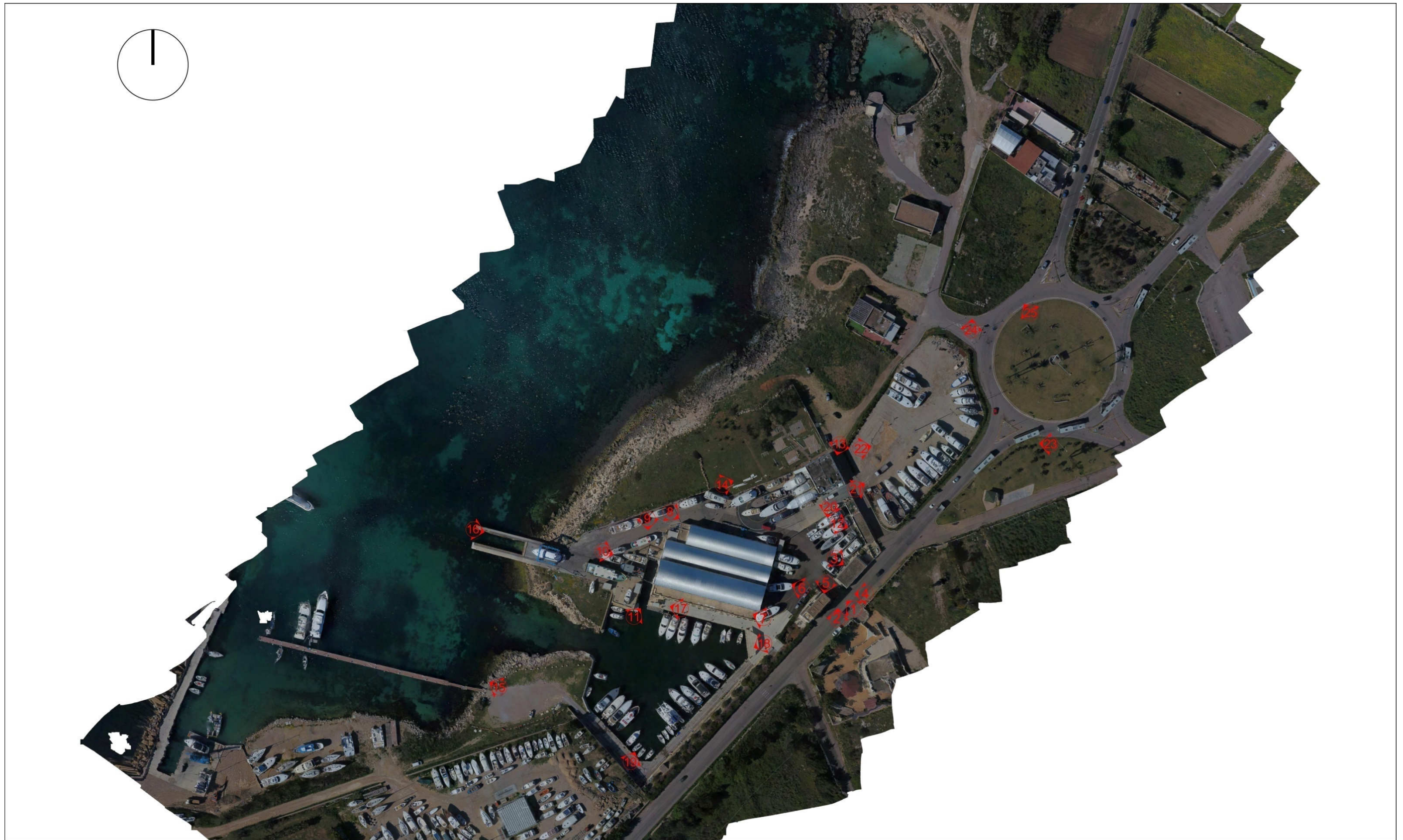
PLANIMETRIA DI RIFERIMENTO FOTOGRAFICO