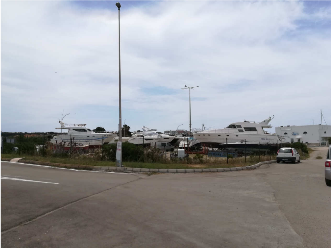
FOTO 23 - AREA PARCHEGGIO ESTERNA