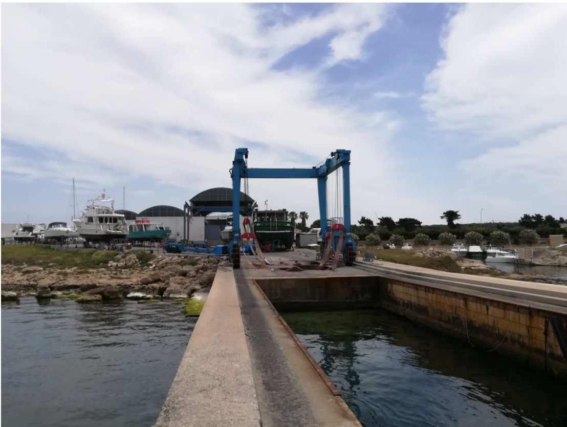
FOTO 16 - SCALO DI ALAGGIO