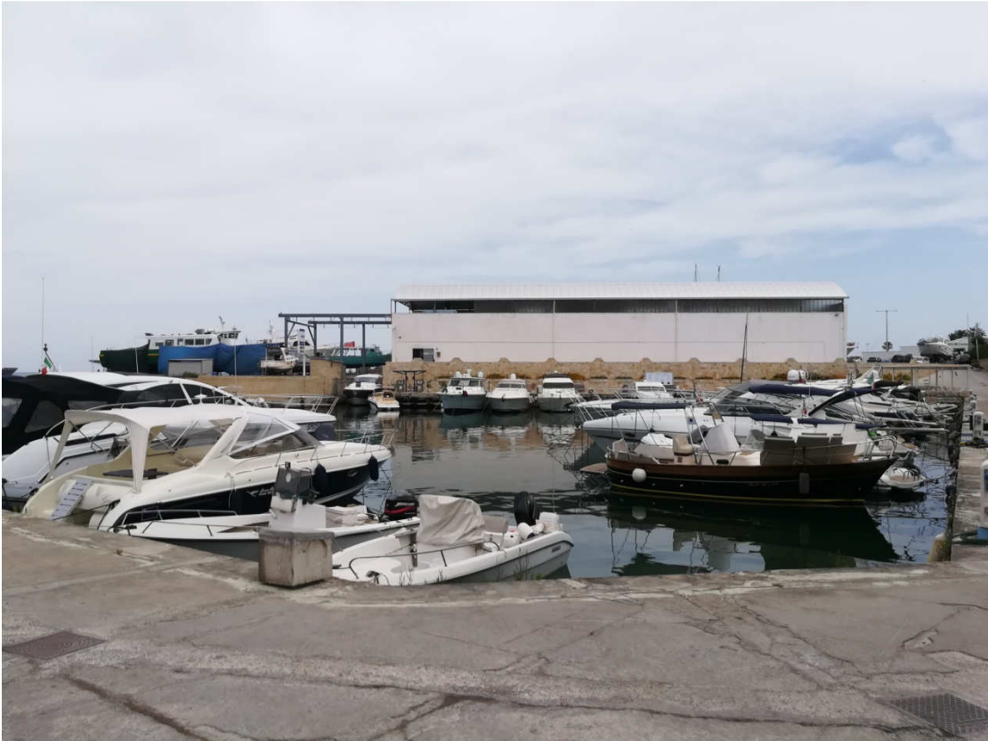
FOTO 19 - DARSENA