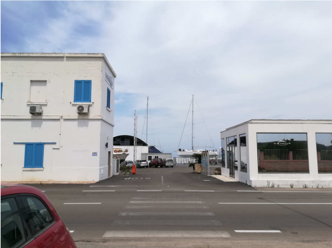
FOTO 1 - INGRESSO PRINCIPALE