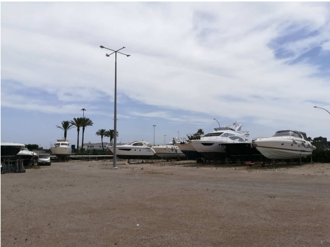
FOTO 22 - AREA PARCHEGGIO ESTERNA