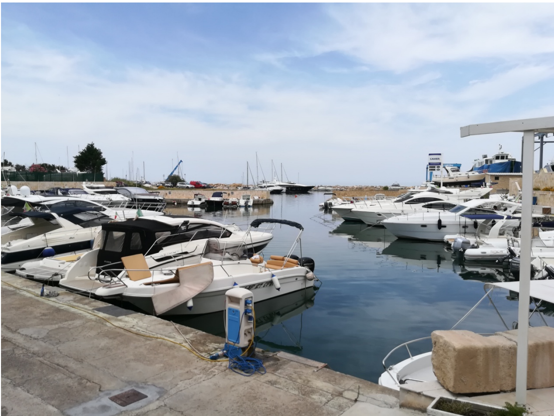
FOTO 18 - DARSENA