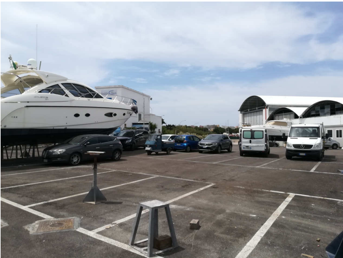
FOTO 20 - PARCHEGGI INTERNI