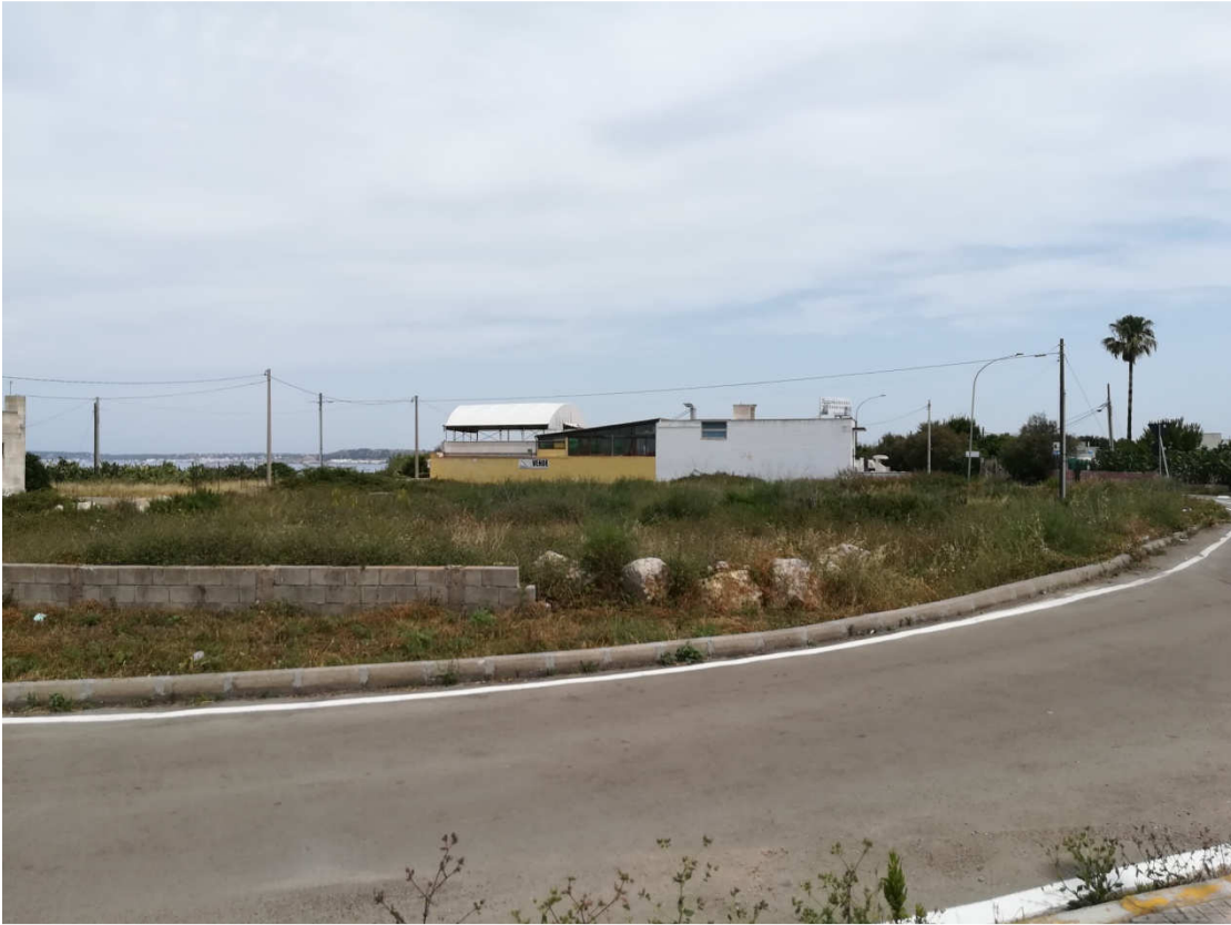
FOTO 25 - AREA PARCHEGGIO ESTERNA