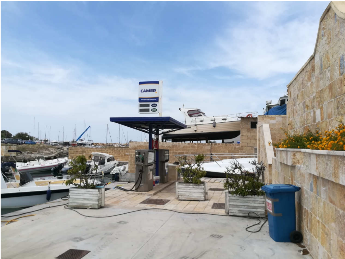
FOTO 17 - DISTRIBUTORE CARBURANTI