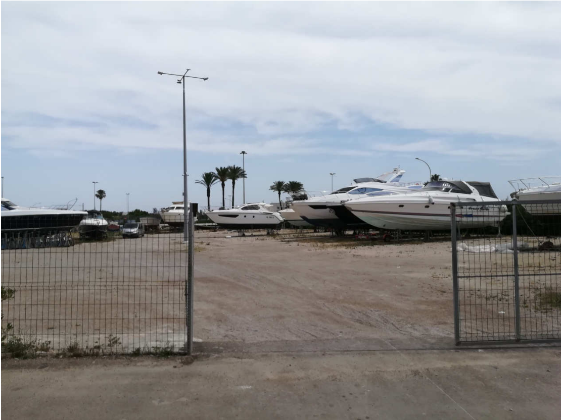
FOTO 21 - AREA PARCHEGGIO ESTERNA