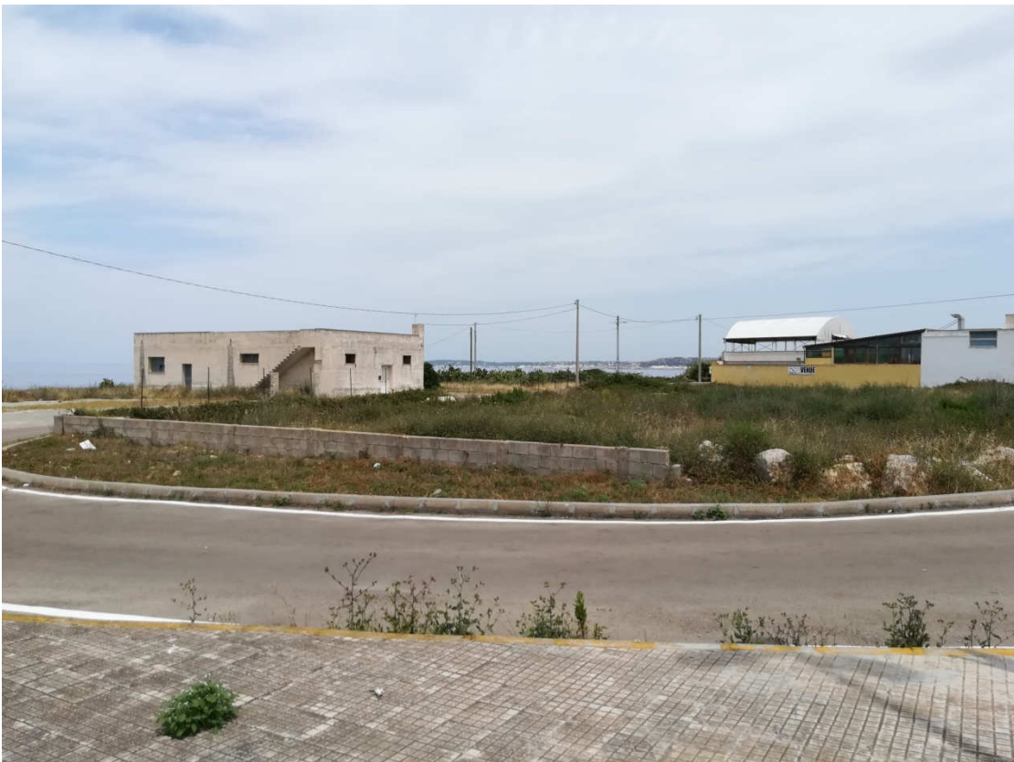
FOTO 24 - AREA PARCHEGGIO ESTERNA