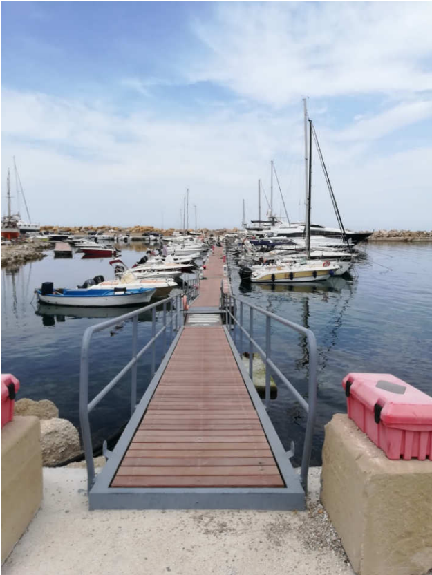
FOTO 15 - PONTILE ESTERNO