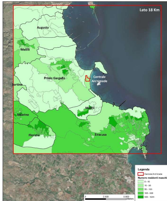
Figura 2: Popolazione residente maschile