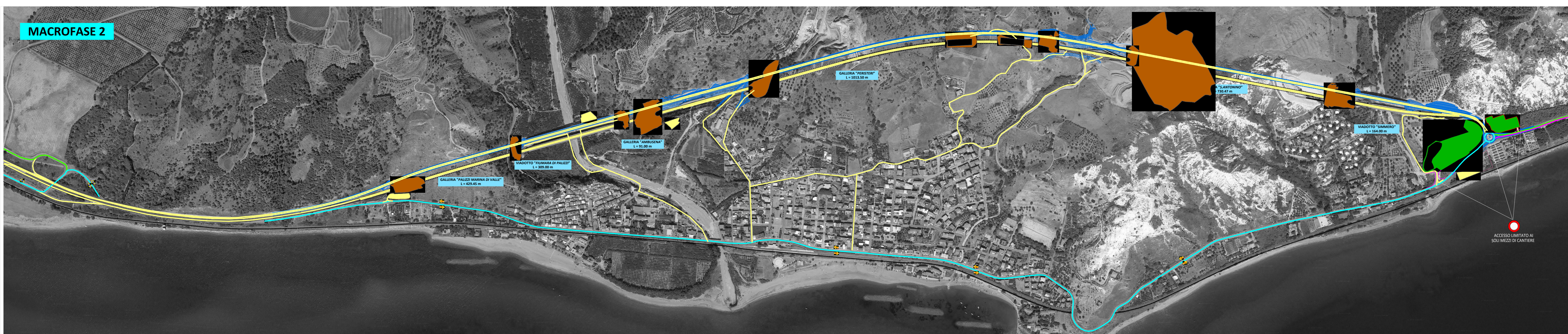
MACROFASE 2 - LAVORAZIONI PRINCIPALI: realizzazione opere di sostegno, completamento e di sistemazione definitiva imbocchi, mediante ritombamento e rimodellamento morfologico e sistemazione ambientale delle aree di imbocco sia della carreggiata di valle che quella di monte