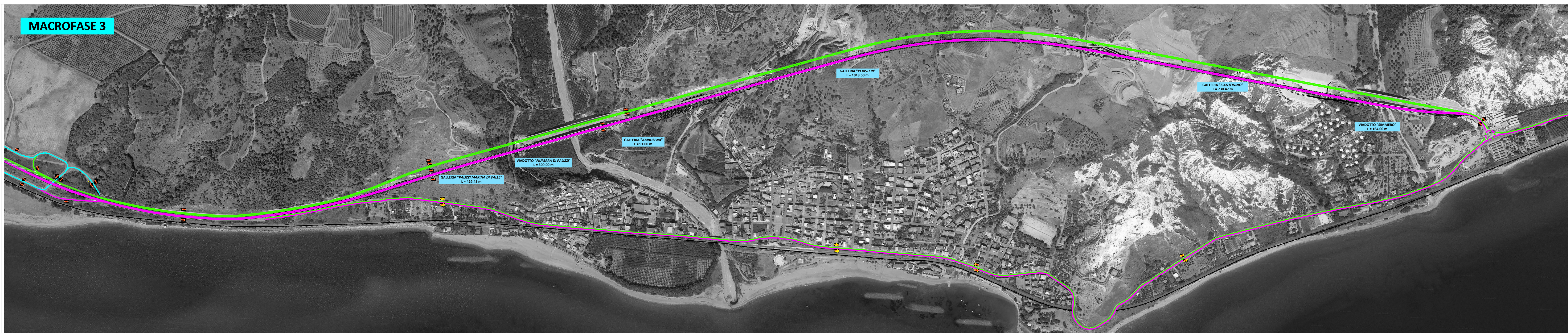
MACROFASE 3 - Entrata in esercizio