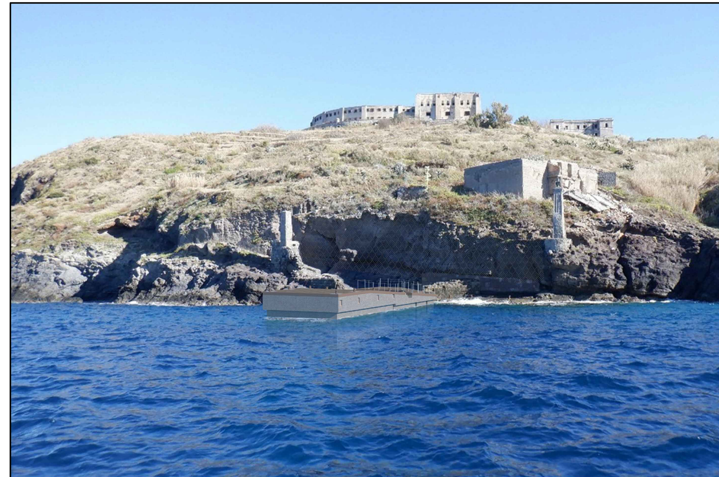
ALTERNATIVA 1, vista da mare