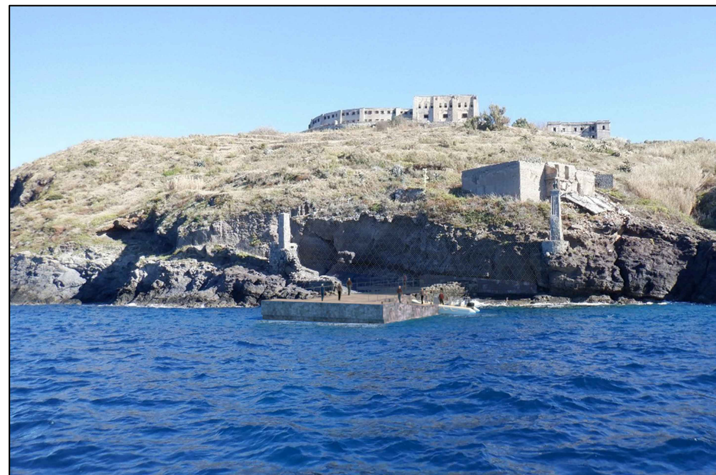
ALTERNATIVA 5, vista da mare