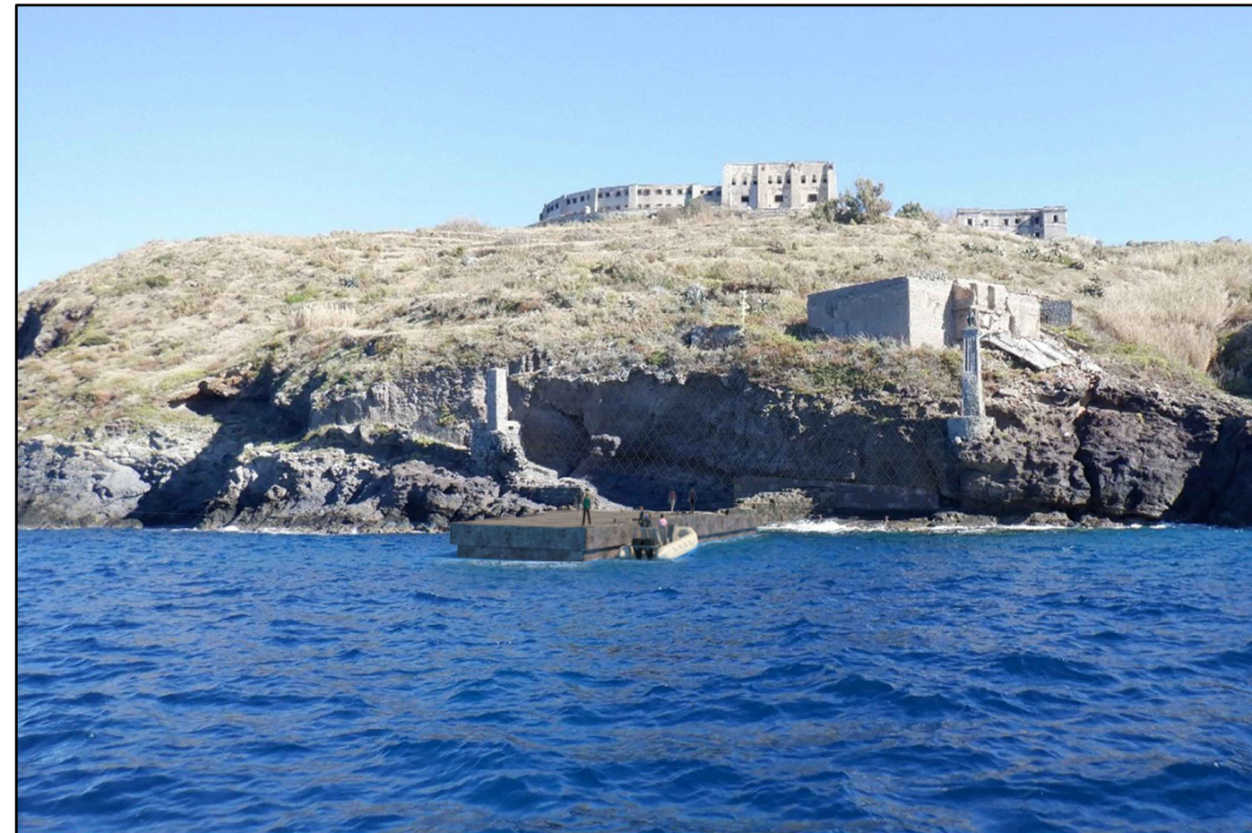
ALTERNATIVA , vista da mare2