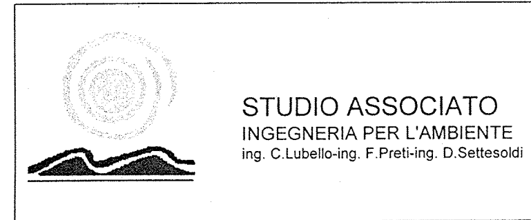
tavola n. 4

Progetto di: Ing. Claudio Lubello Ing. Lorenzo Conti