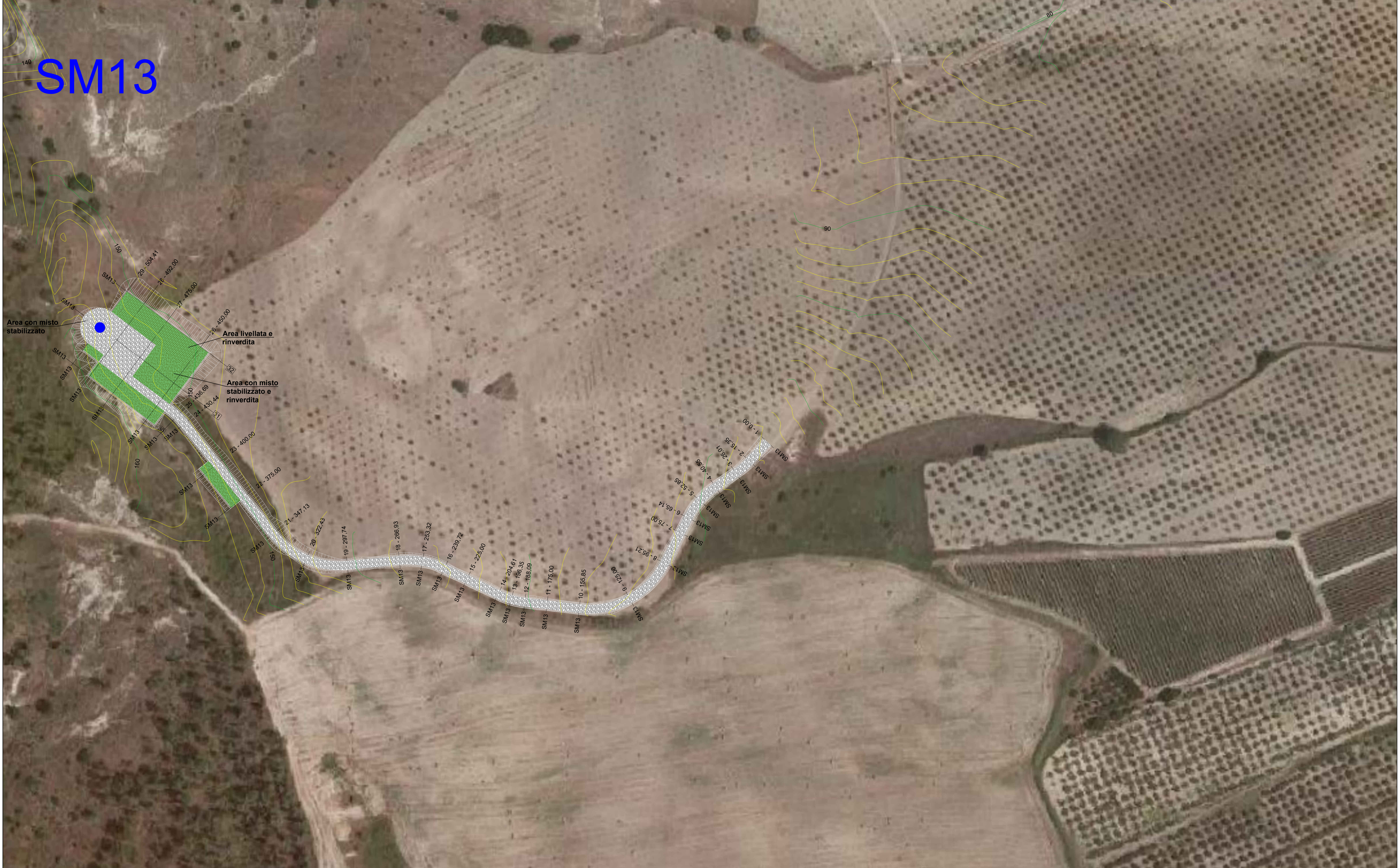
KEY-MAP - scala 1:30.000