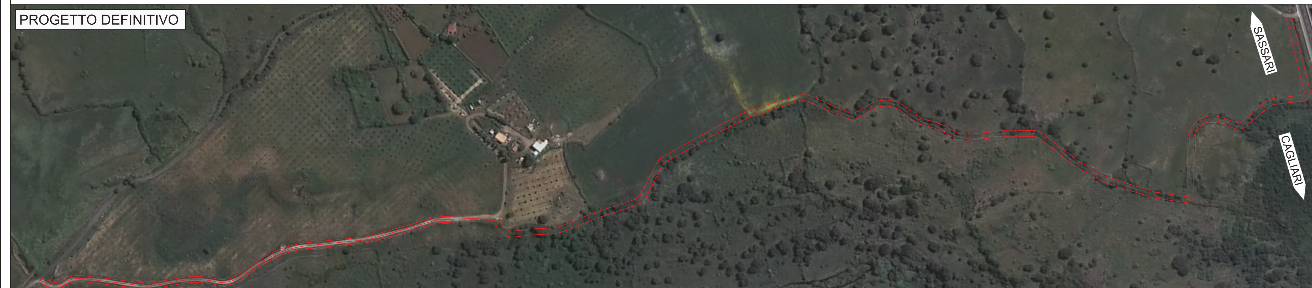
S10 - Accesso al Km 140+490 scala 1:2.000