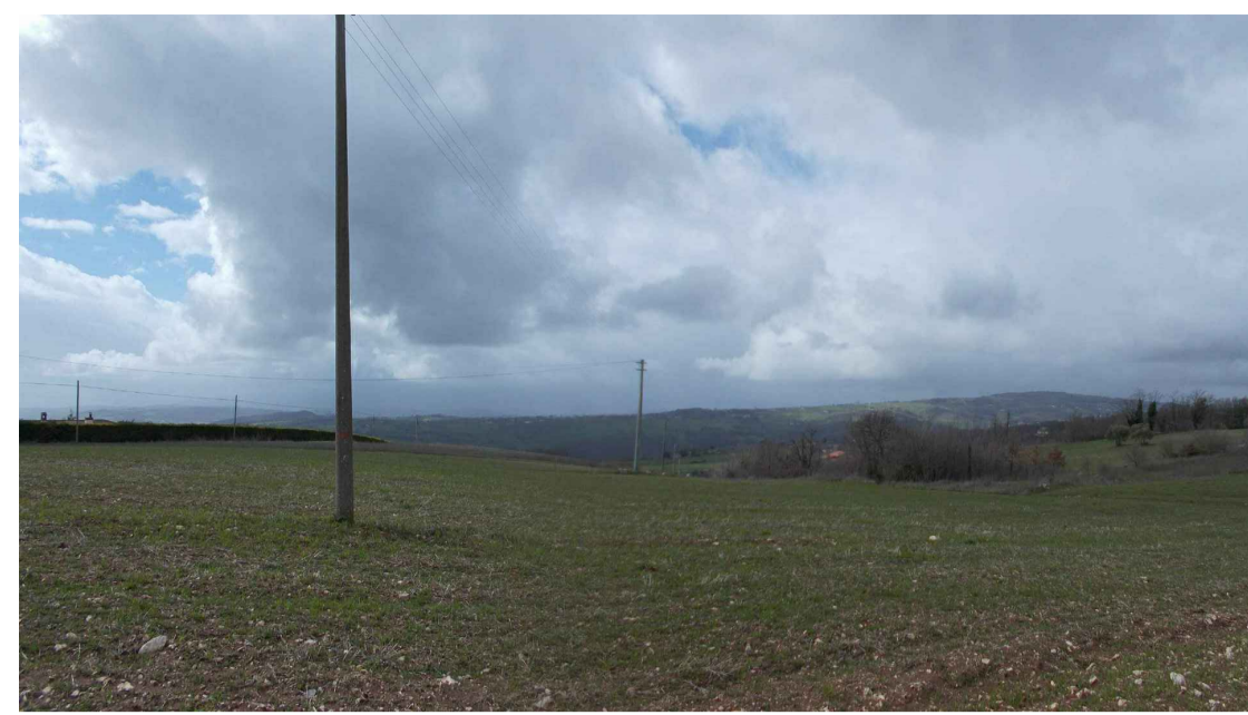
STATO ANTE OPERAM