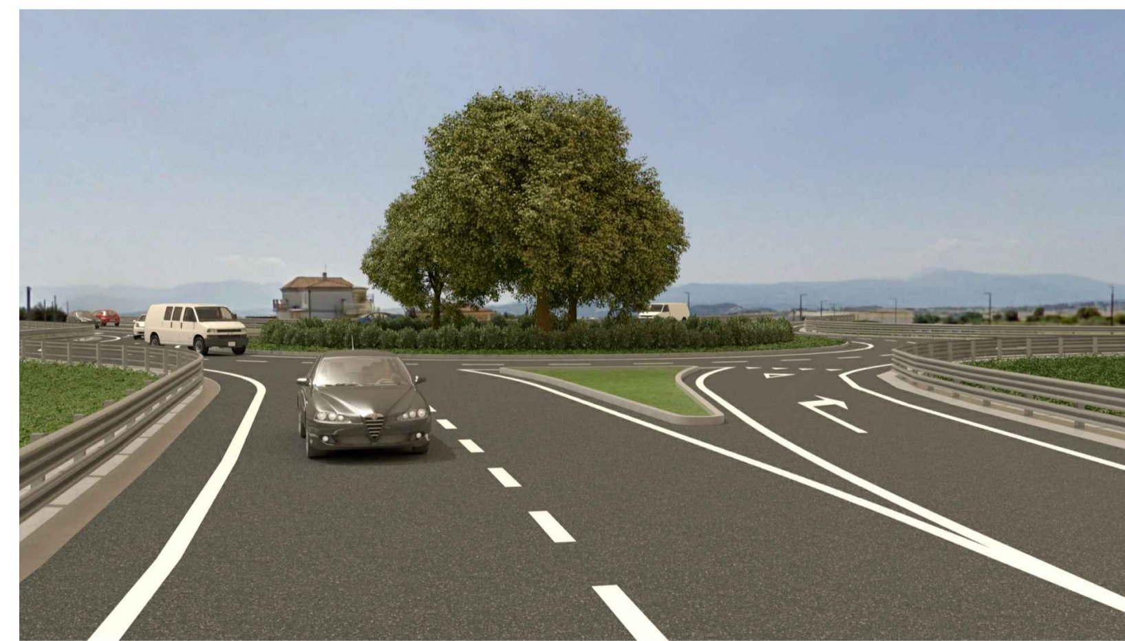
STATO POST OPERAM CON MITIGAZIONE