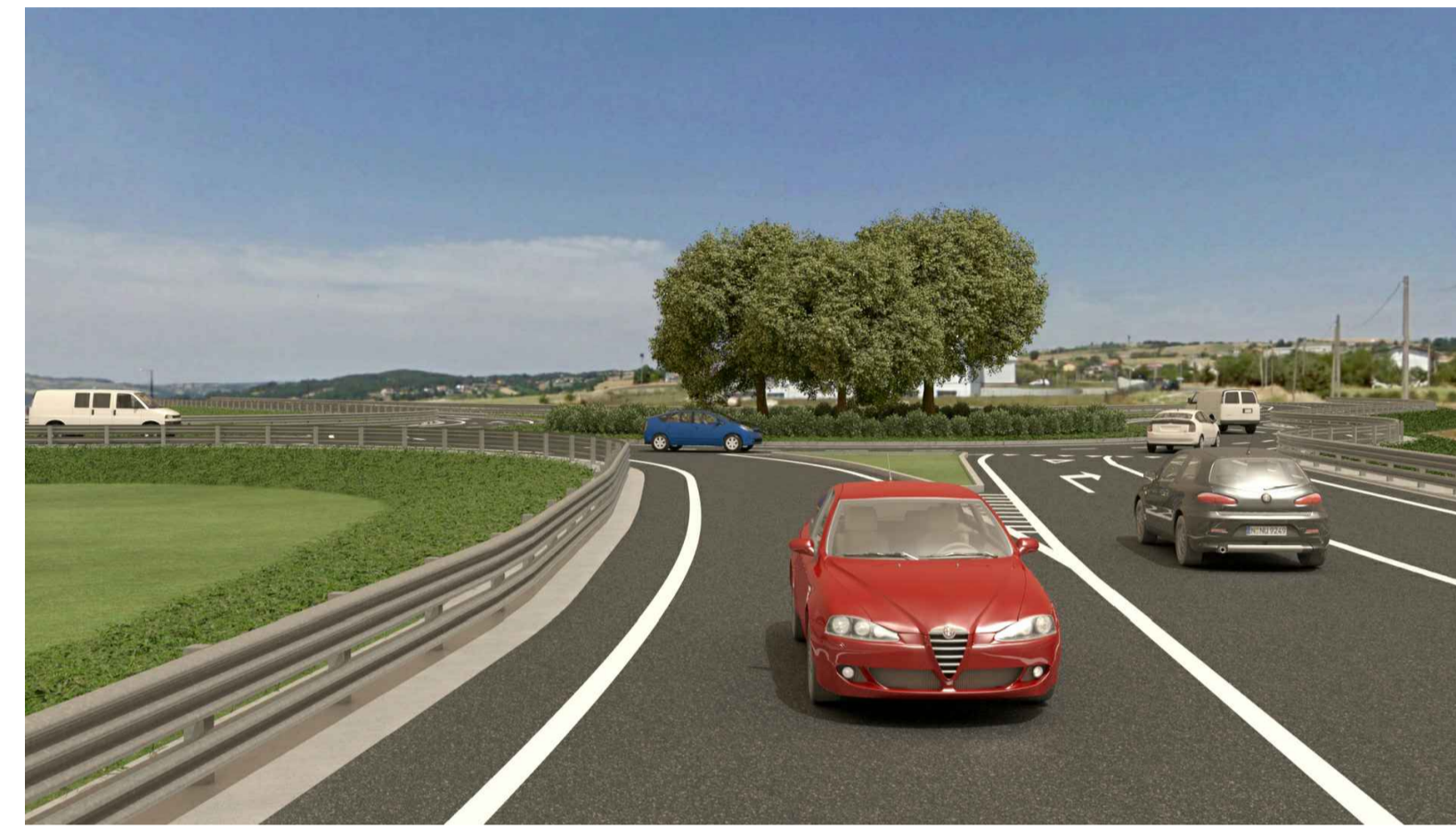
STATO POST OPERAM CON MITIGAZIONE