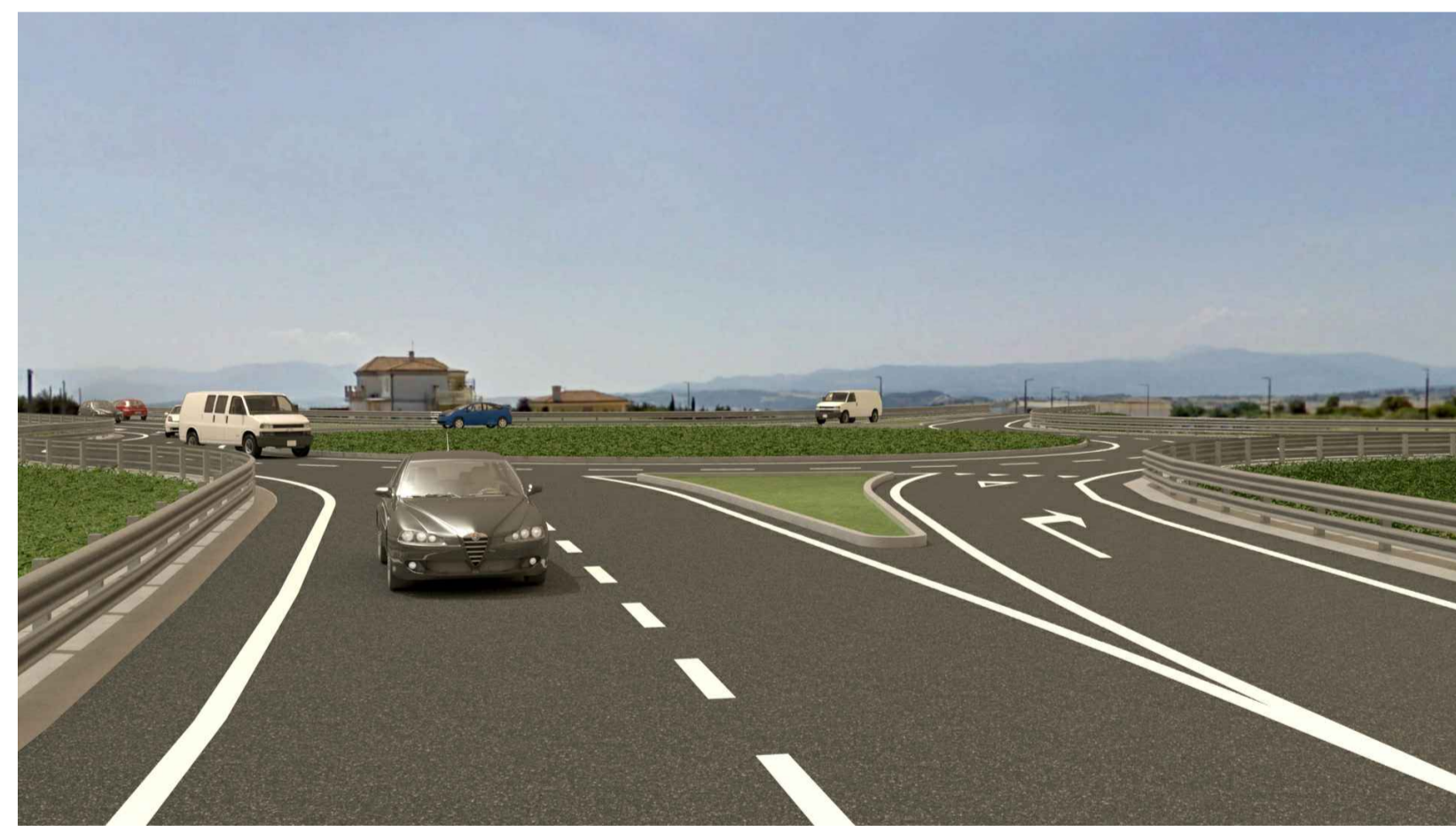
STATO POST OPERAM