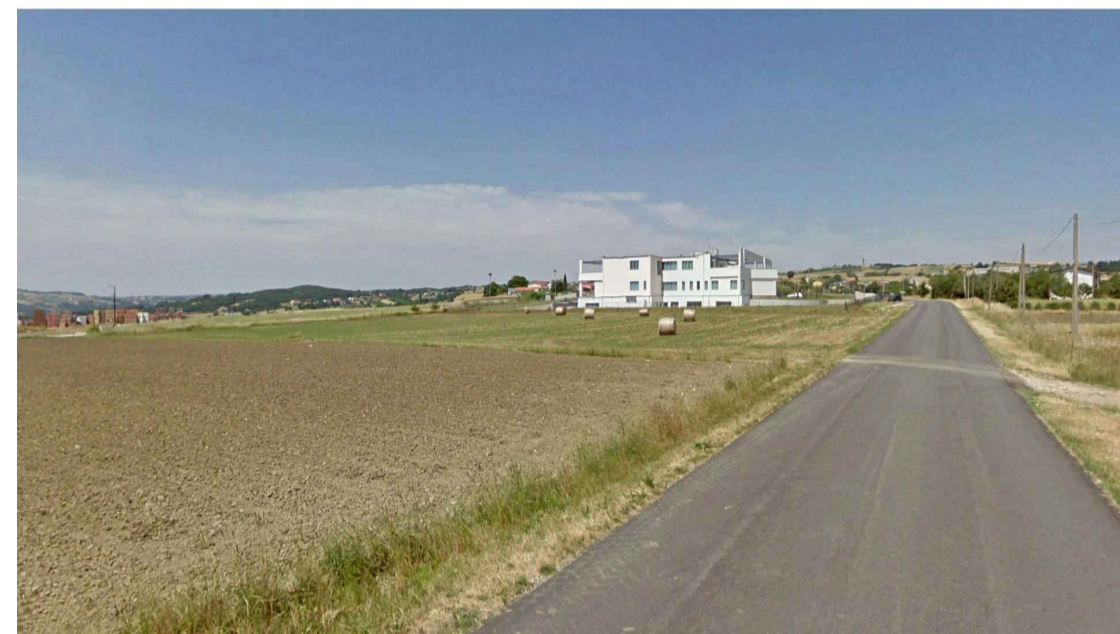
STATO ANTE OPERAM