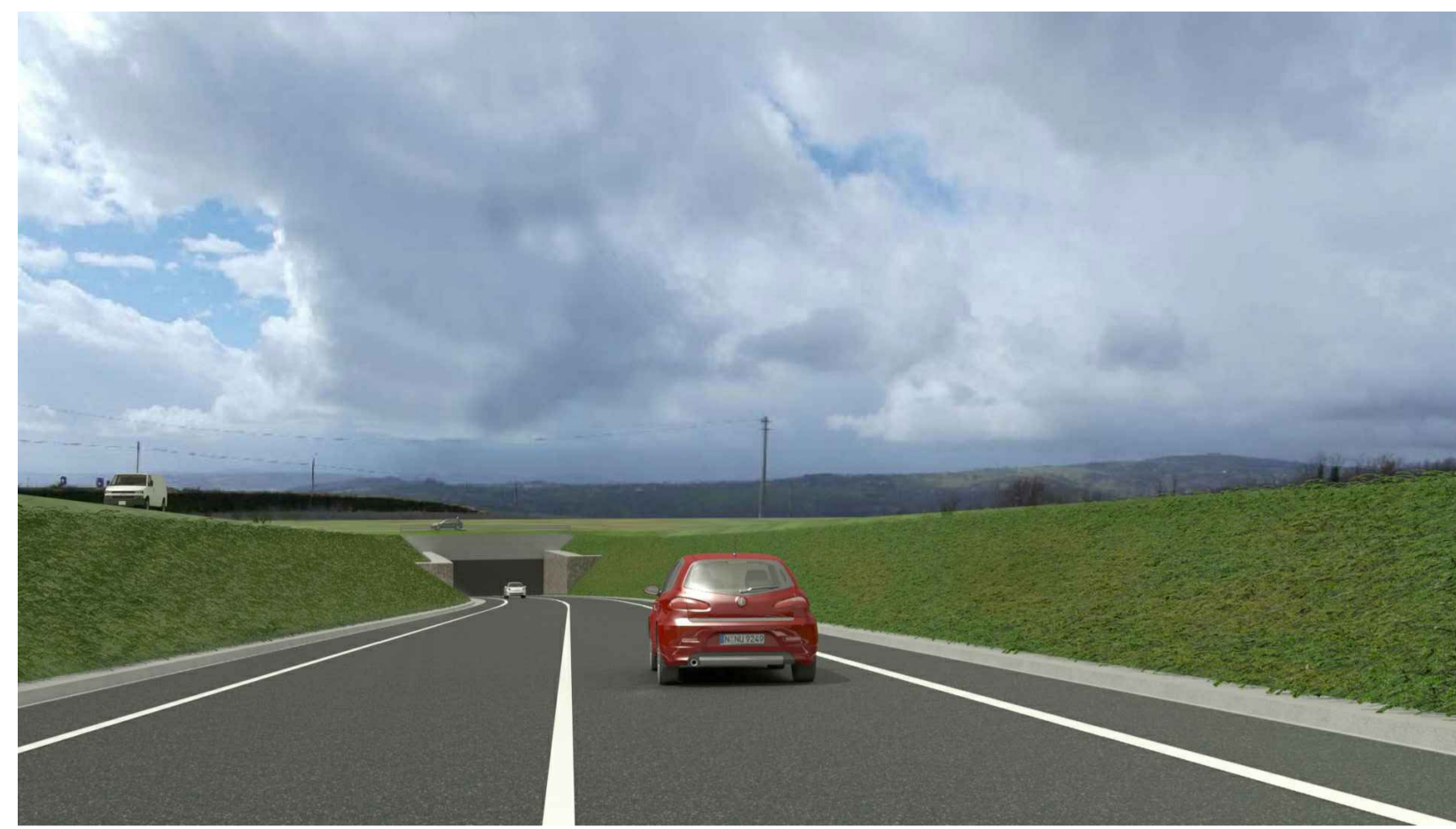
STATO POST OPERAM