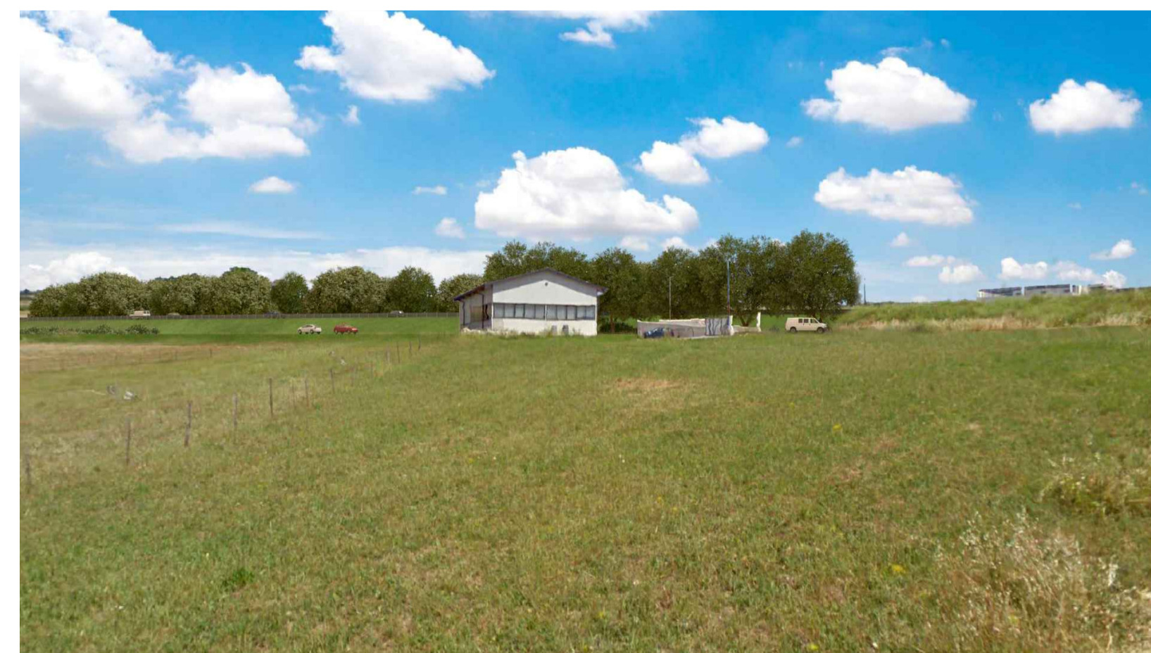
STATO POST OPERAM CON MITIGAZIONE