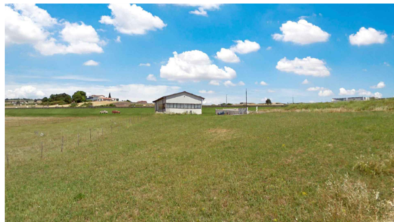
STATO POST OPERAM