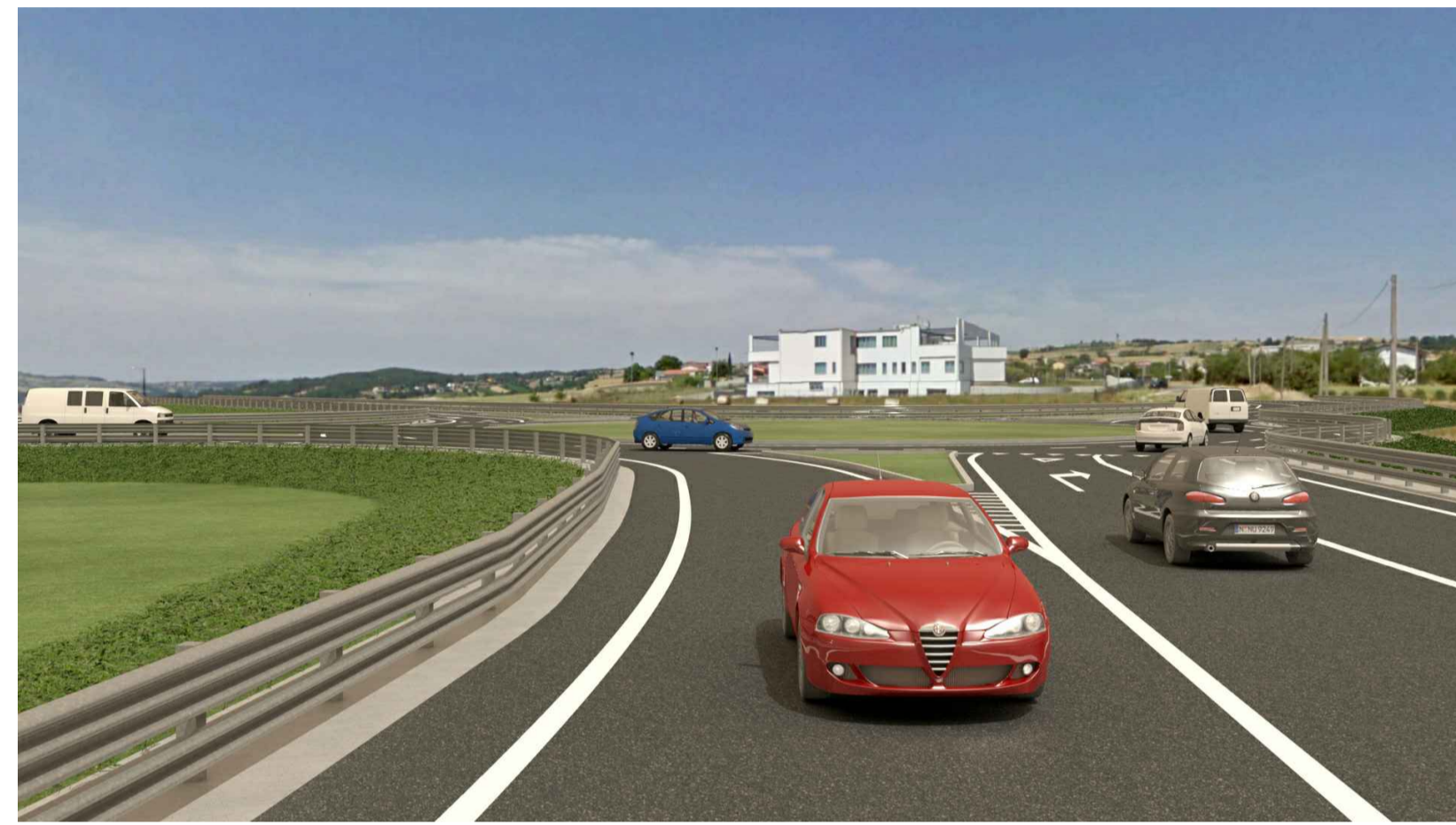
STATO POST OPERAM