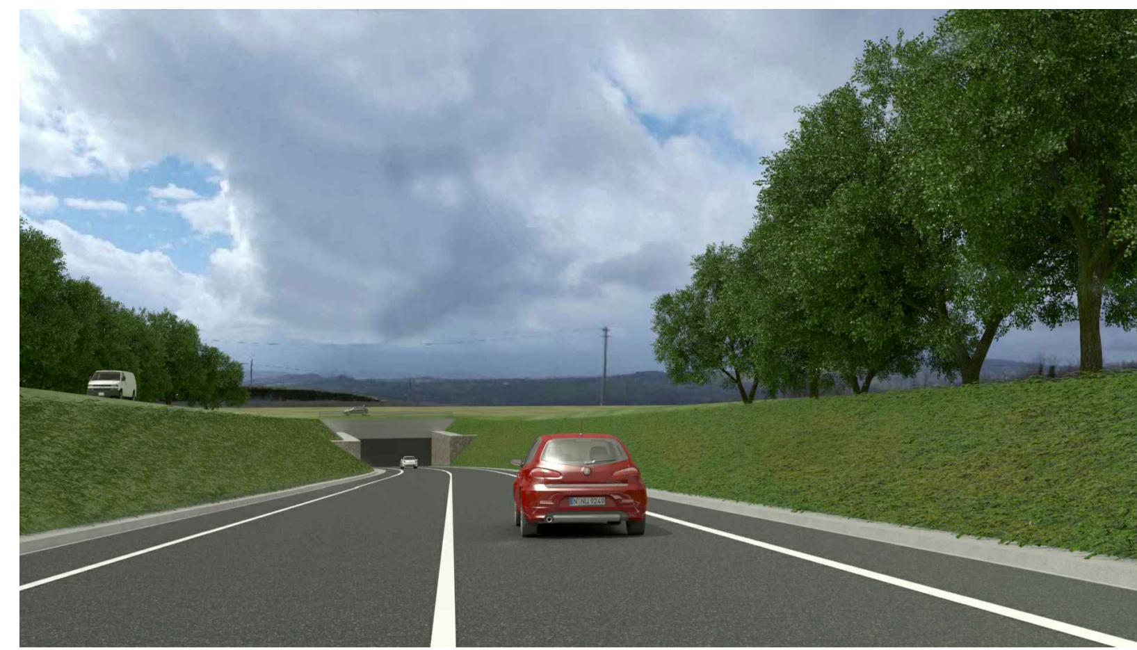
STATO POST OPERAM CON MITIGAZIONE