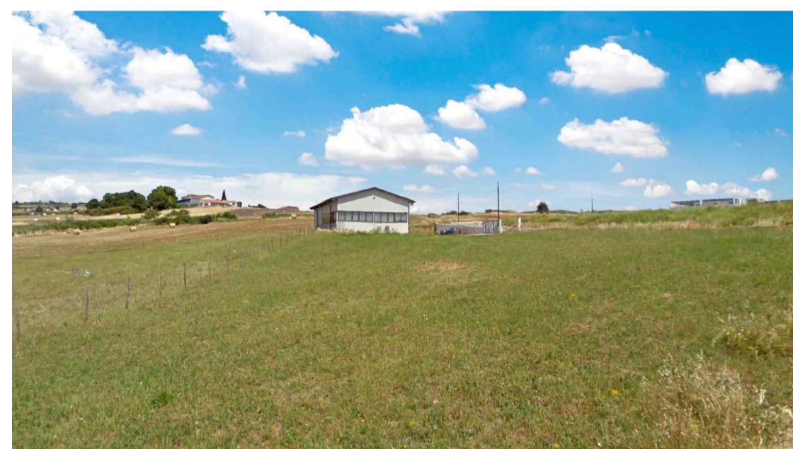
STATO ANTE OPERAM