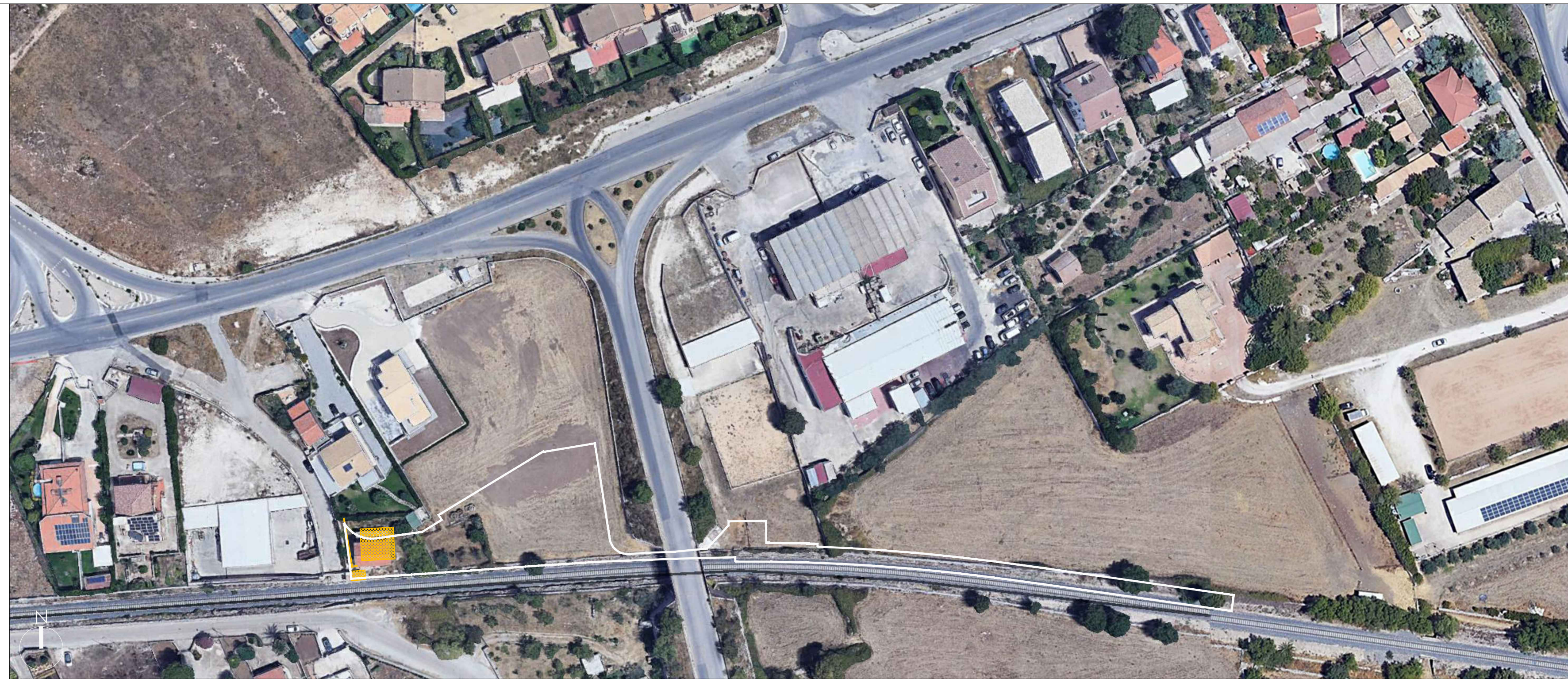
planimetria generale ante operam - scala 1:1000