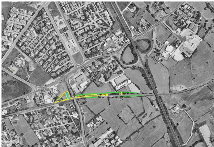
Immagine aerea stazione di Cisternazzi / Ospedale

Per la realizzazione della nuova Stazione Cisternazzi/Ospedale, è prevista la creazione di un tronchino ferroviario con immissione in linea, un marciapiede di banchina parzialmente coperto da pensilina metallica, un fabbricato di servizio con relativo piazzale dedicato alla sosta degli autoveicoli dei dipendenti e la relativa viabilità di accesso.