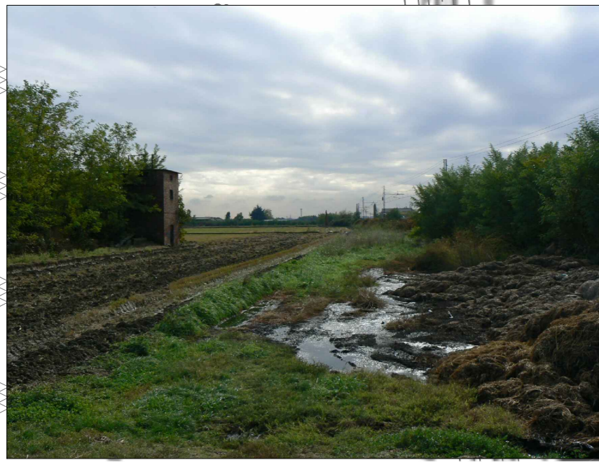
Figura 2 - Impianto pompe esistente adiacente a C.O.01