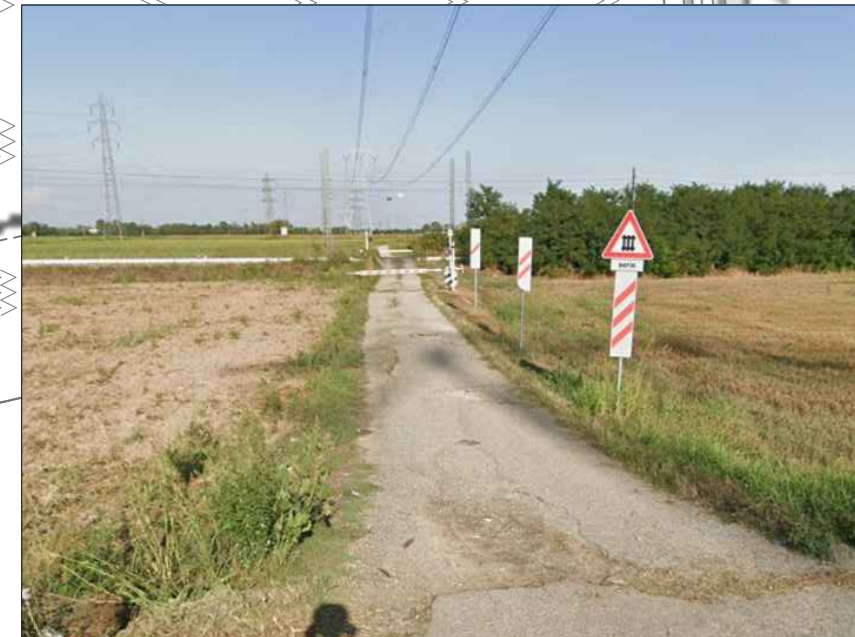
Figura 4 - Accesso area di cantiere e PL da sopprimere