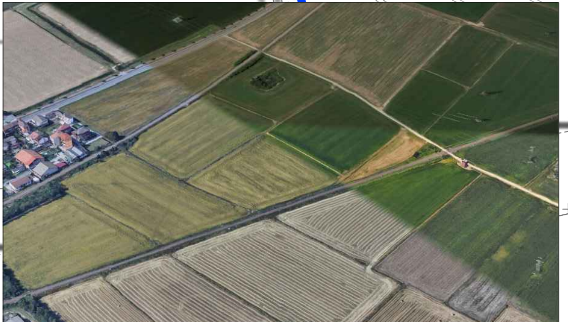
Figura 3 - Vista sull'area d'intervento