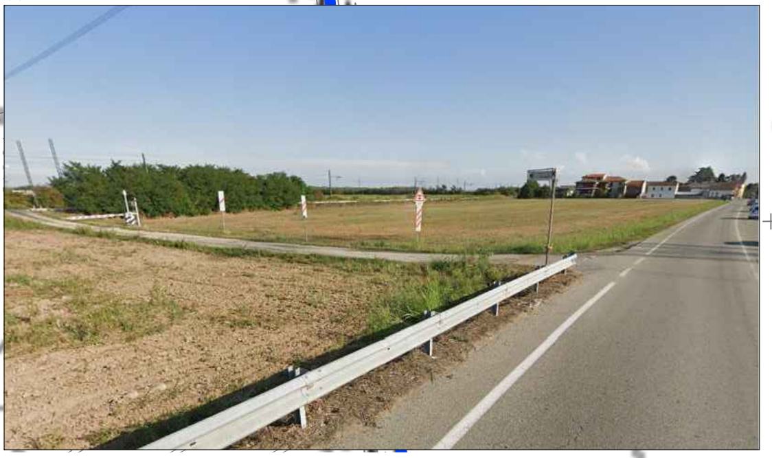
Figura 1 - Vista sull'area del C.B.01