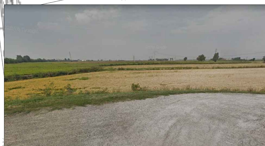
Figura 2 - Accesso area di cantiere da viabilità locale