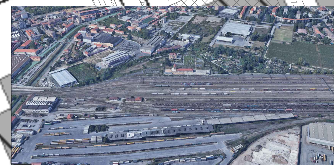
Figura 1 - Vista dell'area di intervento