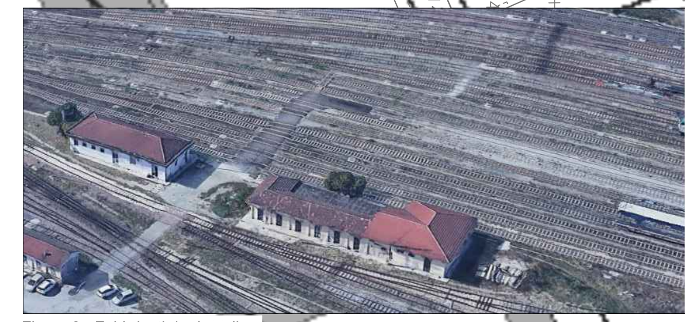
Figura 2 - Fabbricati da demolire