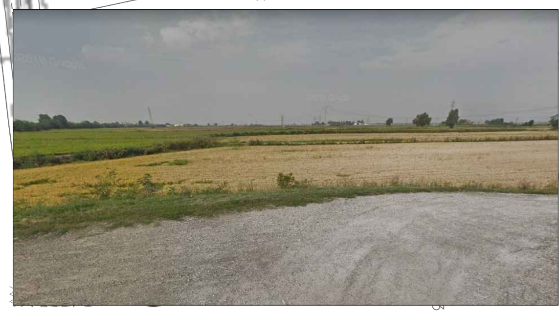
Figura 2 - Accesso area di cantiere da viabilità locale