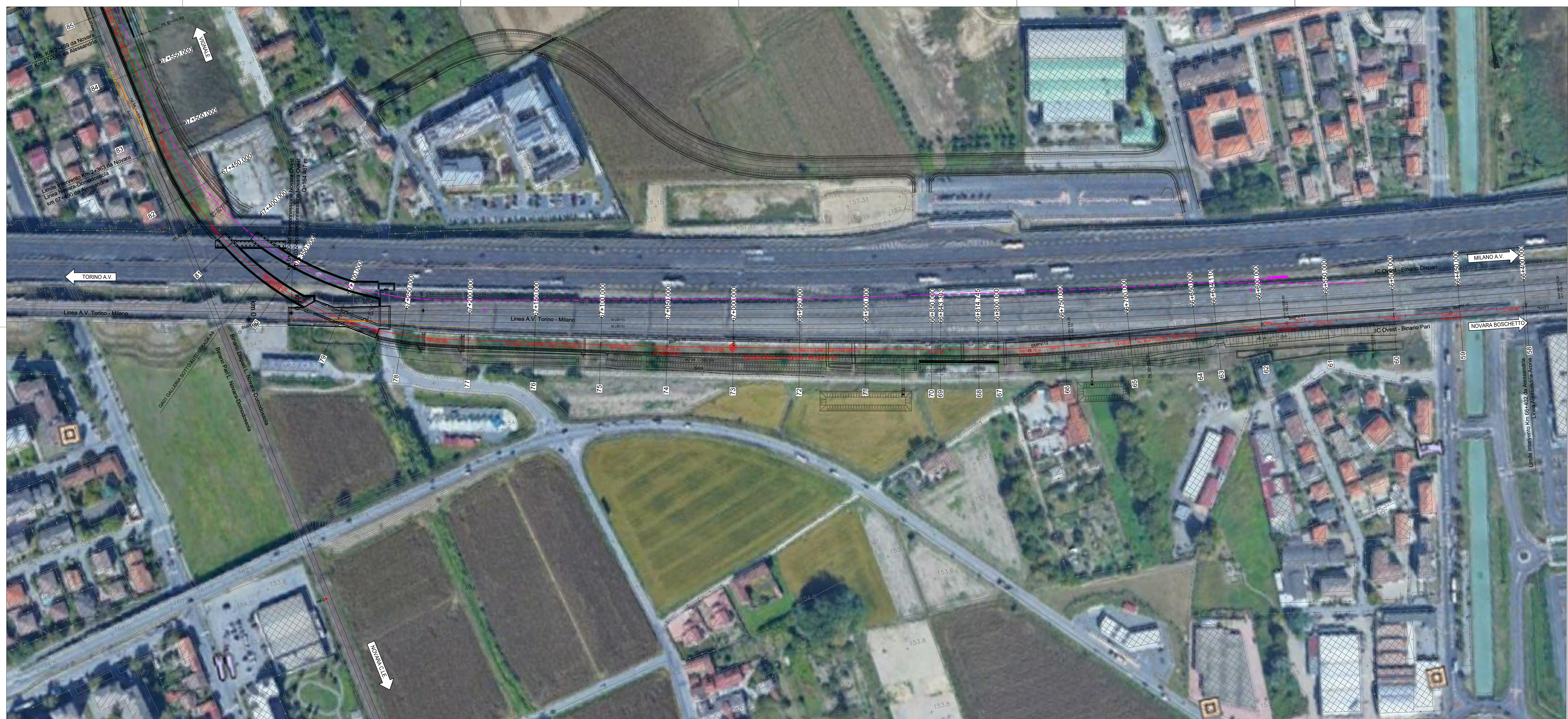
KEY - PLAN