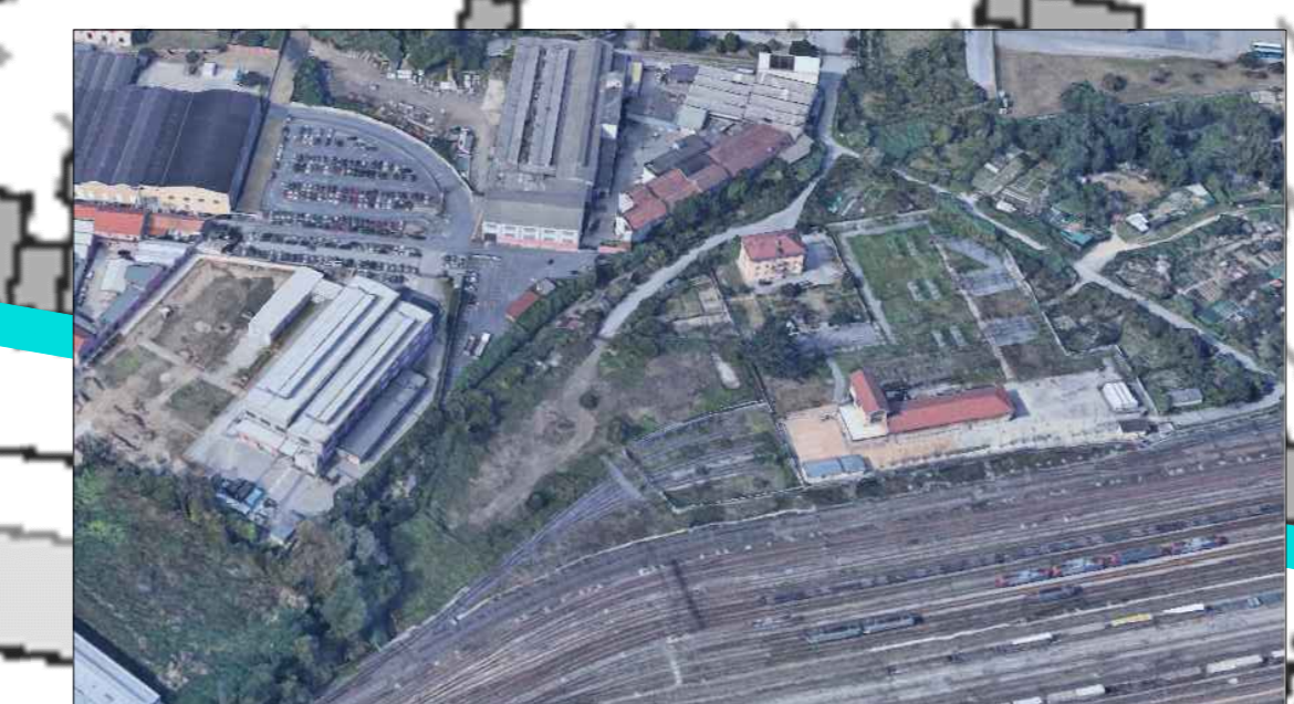
Figura 2 - Vista dell'area di intervento