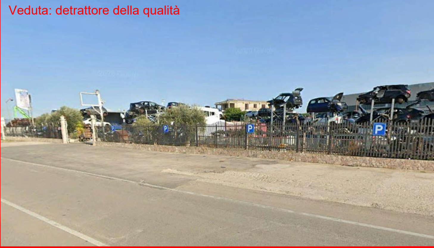
Veduta: detrattore della qualità