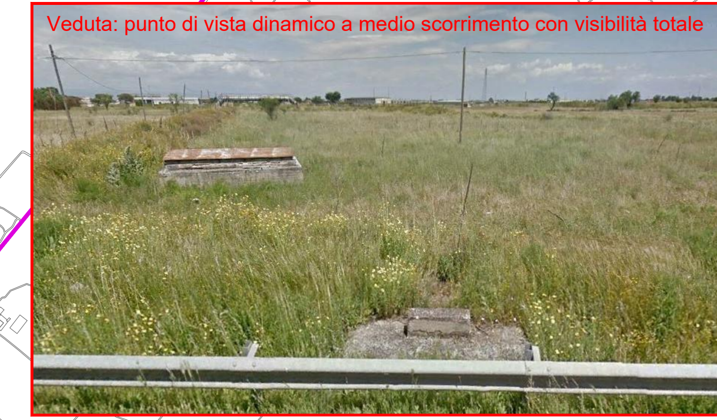
Veduta: punto di vista dinamico a medio scorrimento con visibilità totale