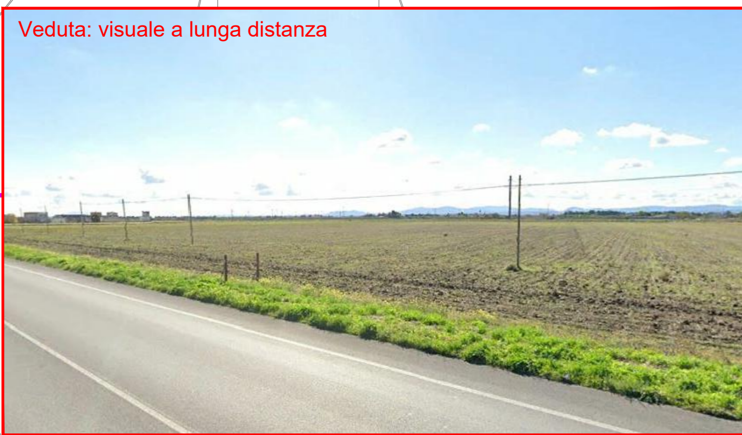
Veduta: visuale a lunga distanza