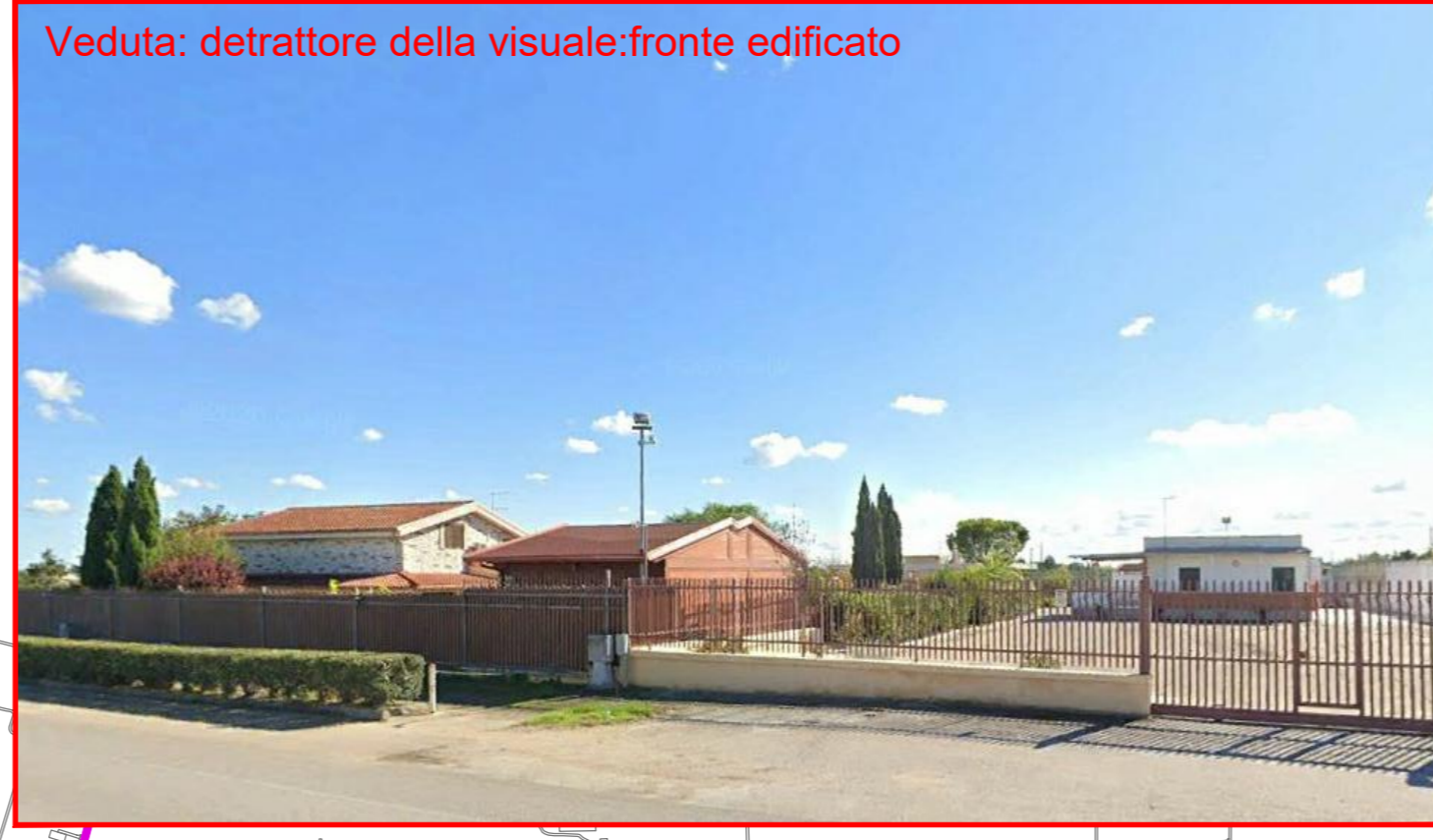
Veduta: detrattore della visuale: fronte edificato