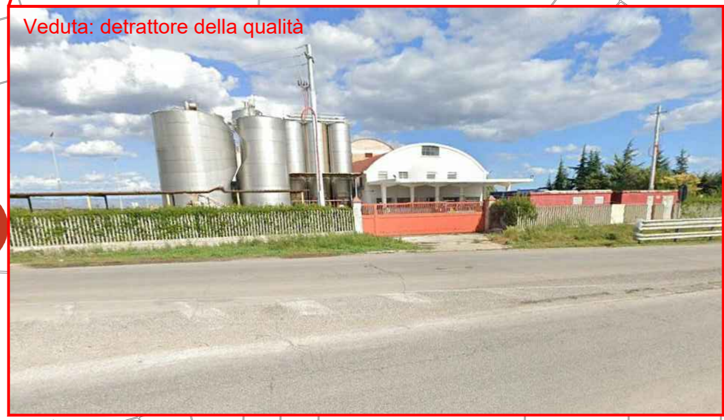
Veduta: detrattore della qualità