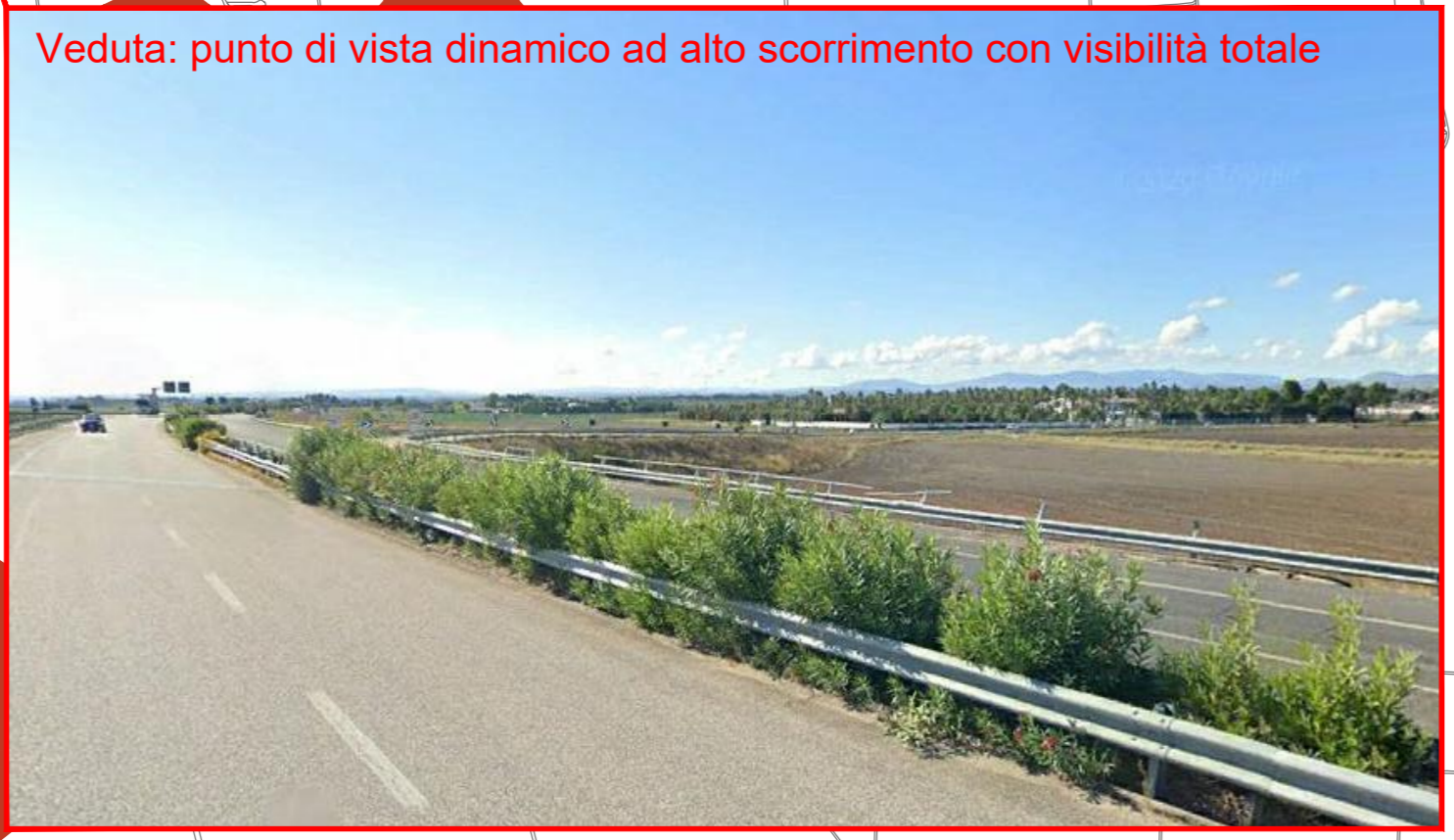
Veduta: punto di vista dinamico ad alto scorrimento con visibilità totale