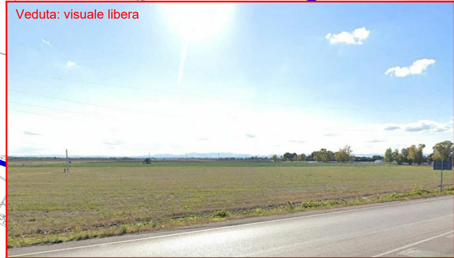
Veduta: visuale libera