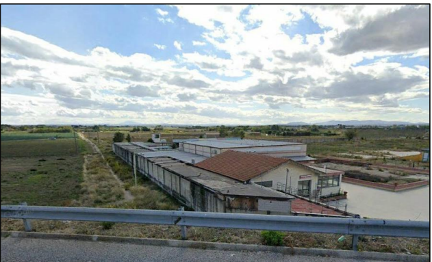
Vista F - Tratturello Foggia Ordona Livello n. 37