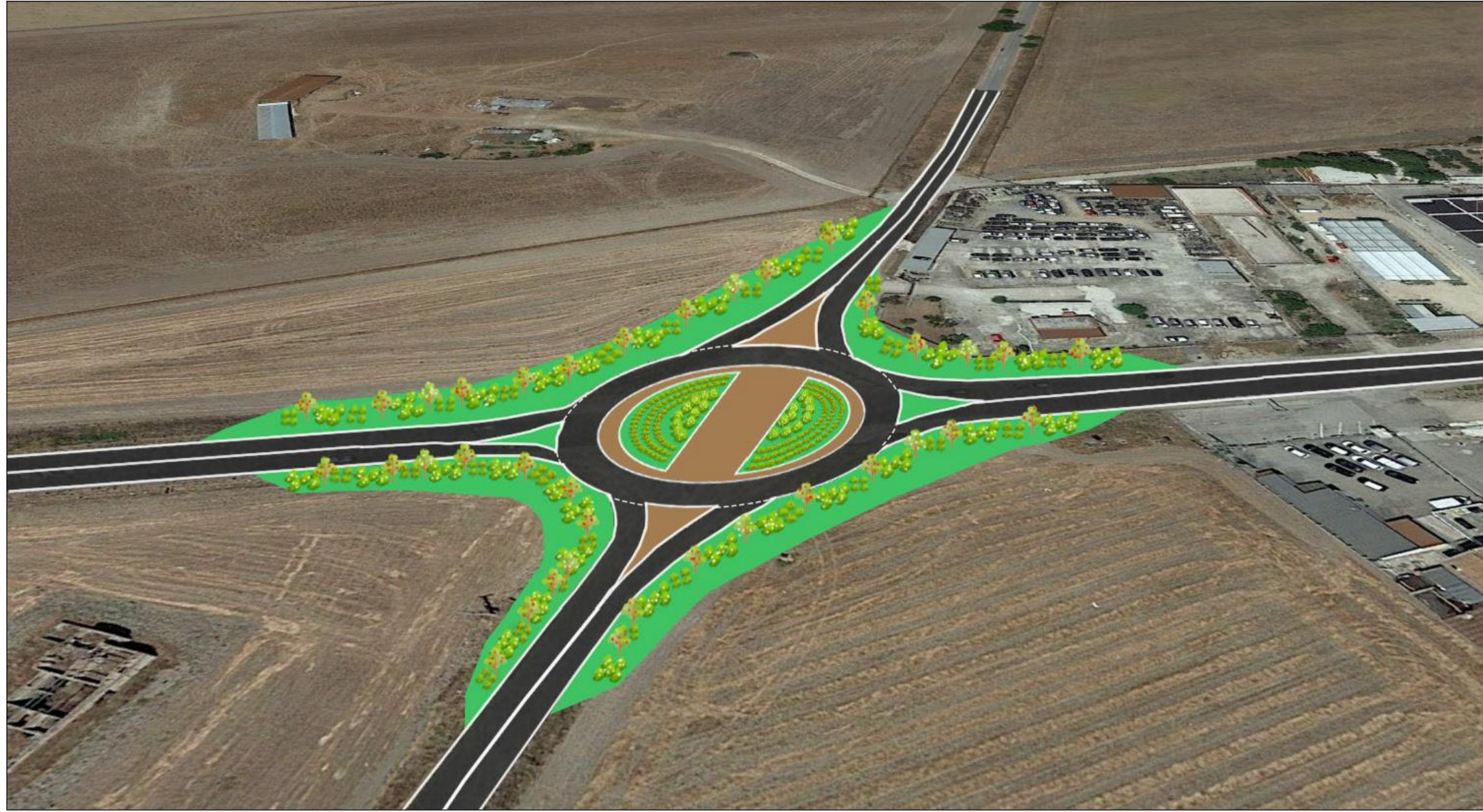
Fotoinserimento 1 – Vista volo d’uccello – post