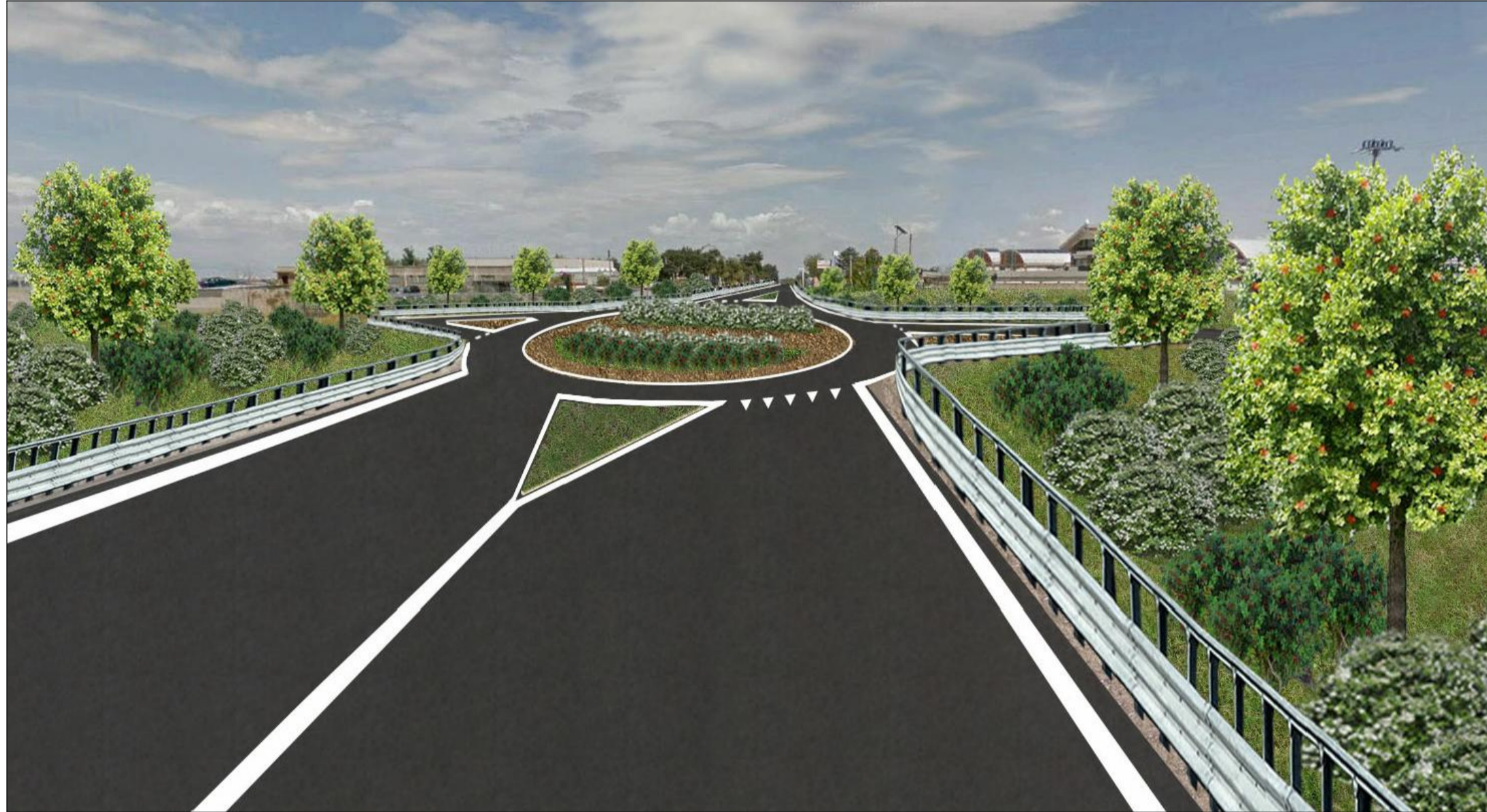
Fotoinserimento 2 – Vista a – post