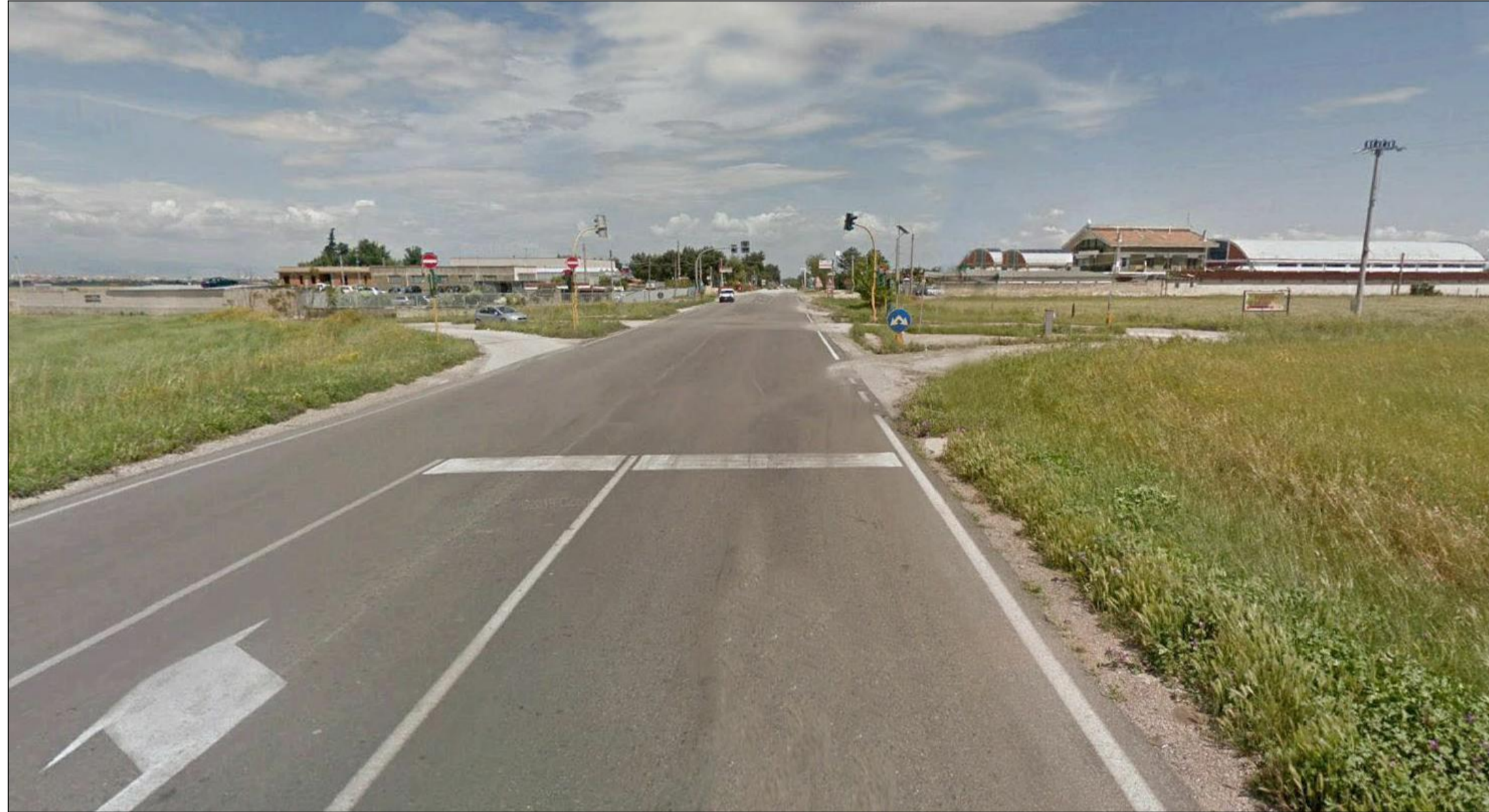
Fotoinserimento 2 – Vista a – ante