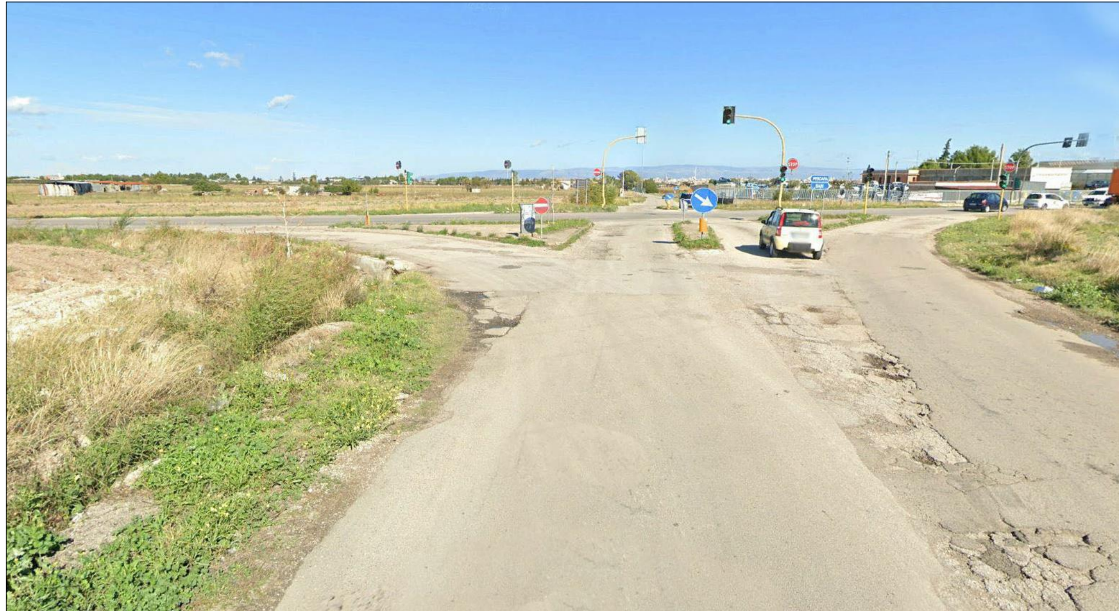
Fotoinserimento 3 – Vista b – ante