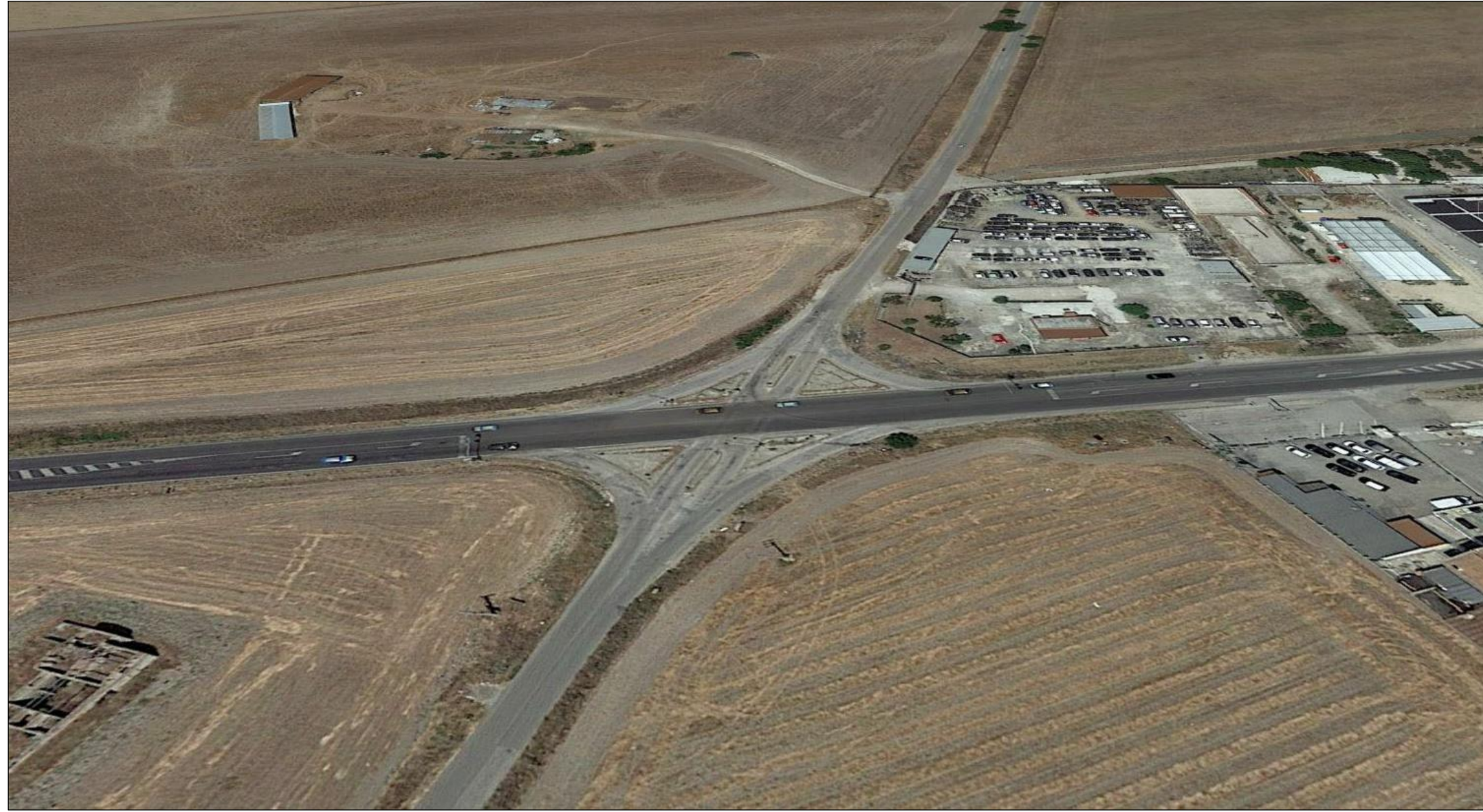
Fotoinserimento 1 – Vista volo d’uccello – ante