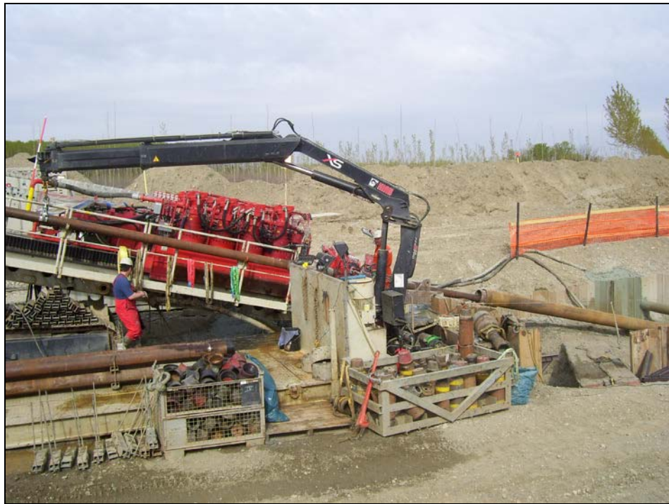
Attravers. F. Po con met. 30" – "Rig", durante la realizzazione del foro pilota

Ad intervalli regolari la perforazione del foro pilota viene interrotta per consentire l'inserimento di un tubo guida (wash pipe) mediante movimento di rotazione ed avanzamento; il tubo guida riduce l'attrito tra asta e terreno, permette di orientare l'asta senza difficoltà e facilita il trasporto verso la superficie dei materiali di scavo; esso, inoltre, serve a mantenere aperto il foro qualora sia necessario ritirare l'asta pilota. Il foro pilota sarà completato quando sia l'asta pilota che il tubo guida fuoriusciranno alla superficie sul lato opposto al Rig. La testa di perforazione sull'asta pilota viene rimossa e l'asta stessa viene quindi ritirata, lasciando il tubo guida lungo il profilo di progetto. A titolo di esempio nelle figure seguenti si riporta delle foto inerenti alle fasi di esecuzione del foro pilota.