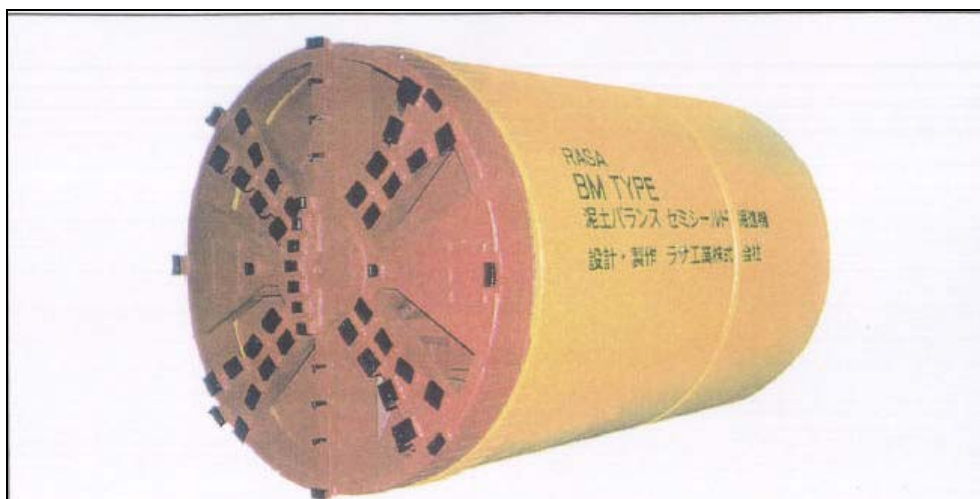
Scudo con bilanciamento pressione meccanica del terreno (microtunneller)