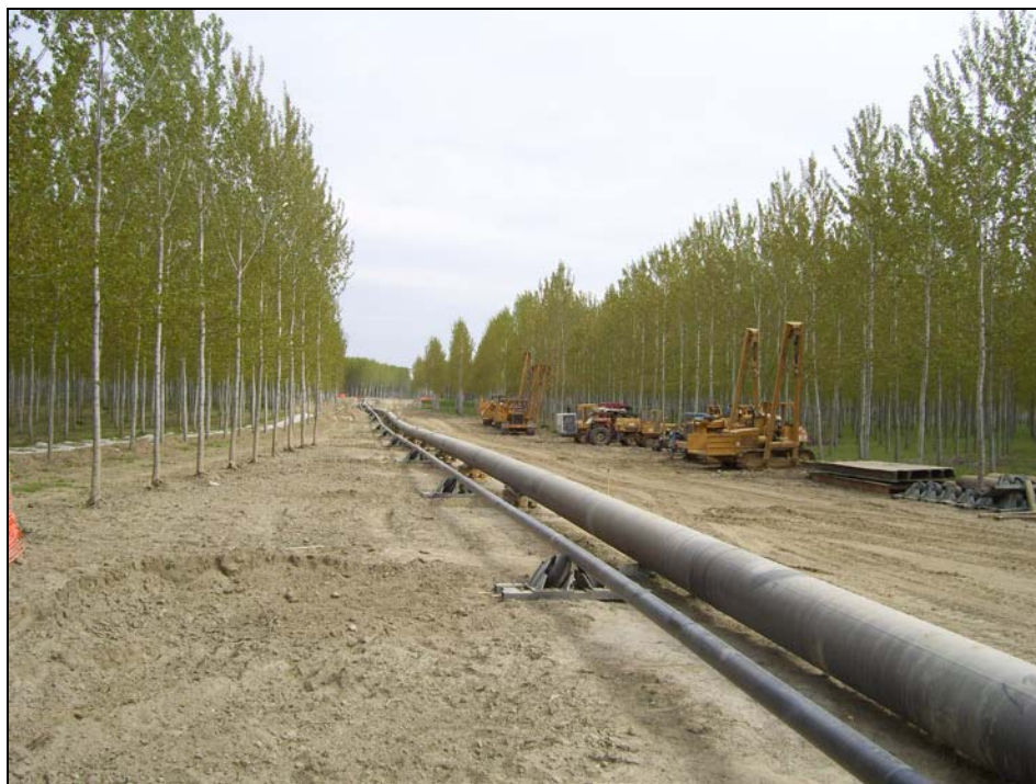
Attrav. F. Po con met. 30" – Colonna del pipeline preassemblata sulla pista di varo

A titolo di esempio nella figura seguente si riporta una foto di una colonna preassemblata, prima del varo.