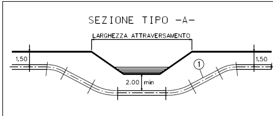
Estratto da disegno standard LC-D-81378