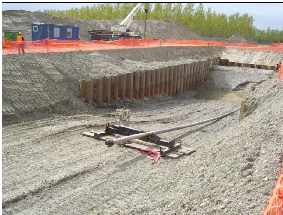
Attraversamento F. Po con met. 30" – fase di uscita dell'asta pilota