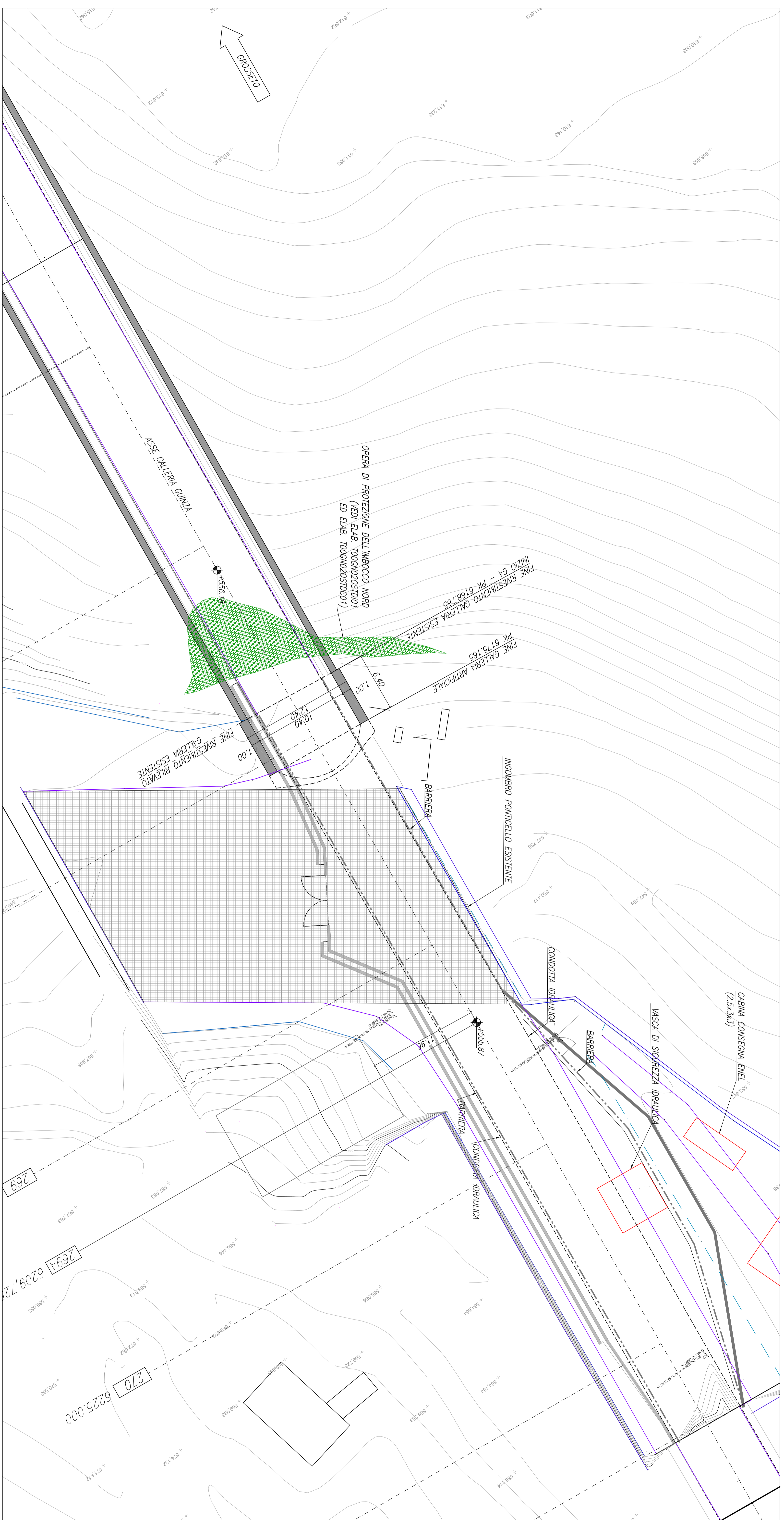
PLANIMETRIA IMBOCCO (LATO MARCHE) - DEMOLIZIONE DIMA ESISTENTE 1:100