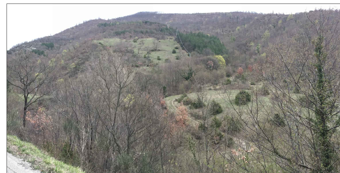
1 - Versante opposto all'area della Guinza in cui risaltano un rimboscimento di pino nero, un'area prativa con presenza di ginepri e al margine della strada sulla scarpata presenza di roverelle e cerri