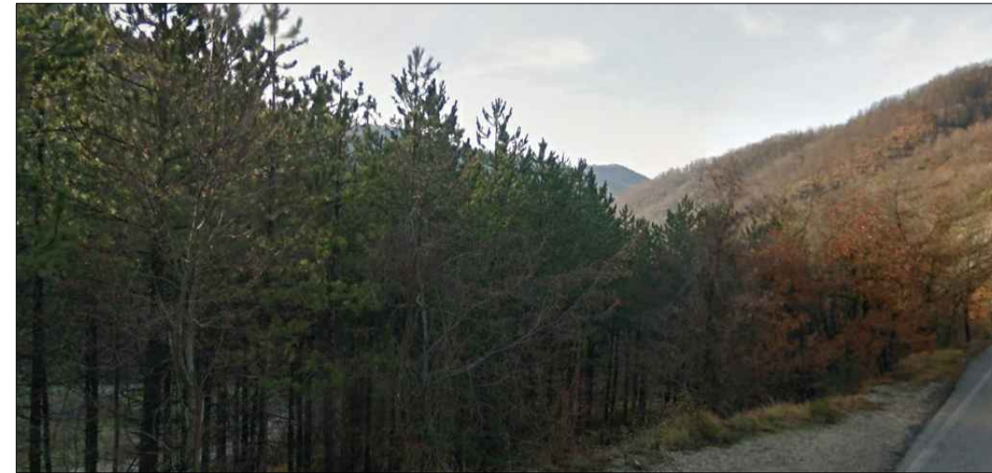
4 - Vista della paratia adiacente l'imbocco della galleria Guinza con sulla sinistra visibile il rimboscimento di pino nero