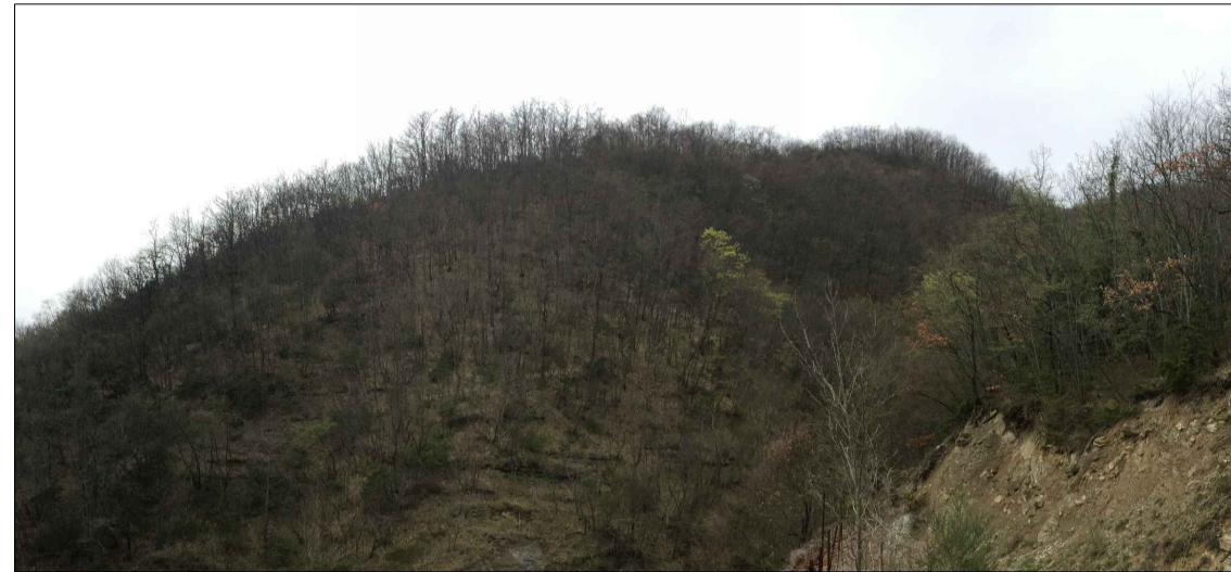
3 - Versante al lato dell'imbocco della Guinza in cui visibile la cerreta spoglia e l'acclività del versante