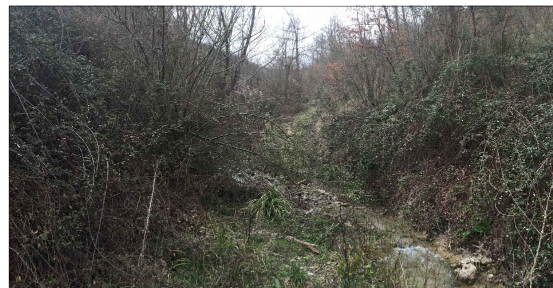
2 - Torrente Lama, si evidenzia l'area ripariale degradata in cui non si ritrovano specie quali salici e pioppi segnalate invece come presenti tra gli habitat del SIC