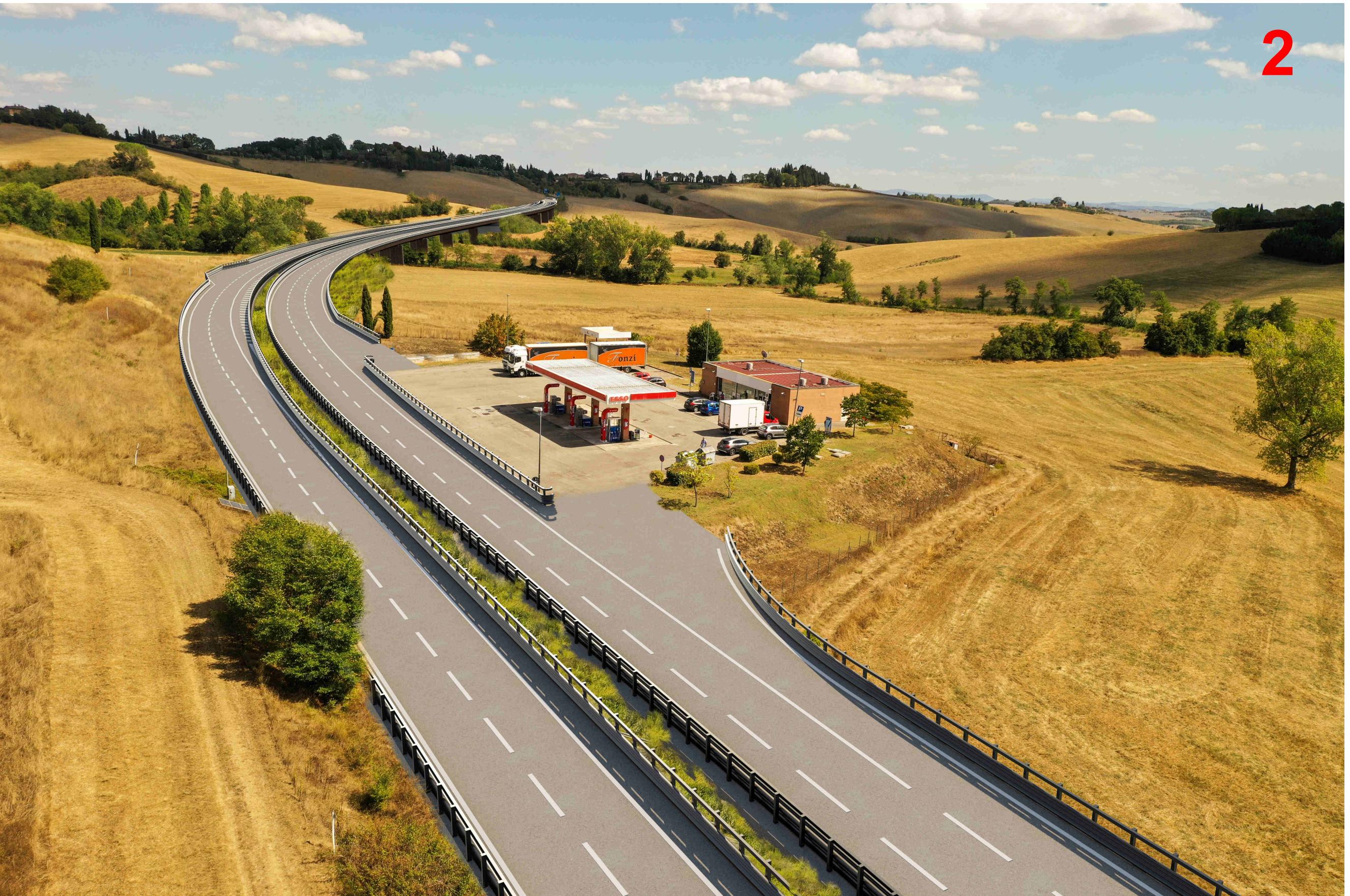
Tratto stradale tra viadotto Valli e viadotto Ribucciano progetto