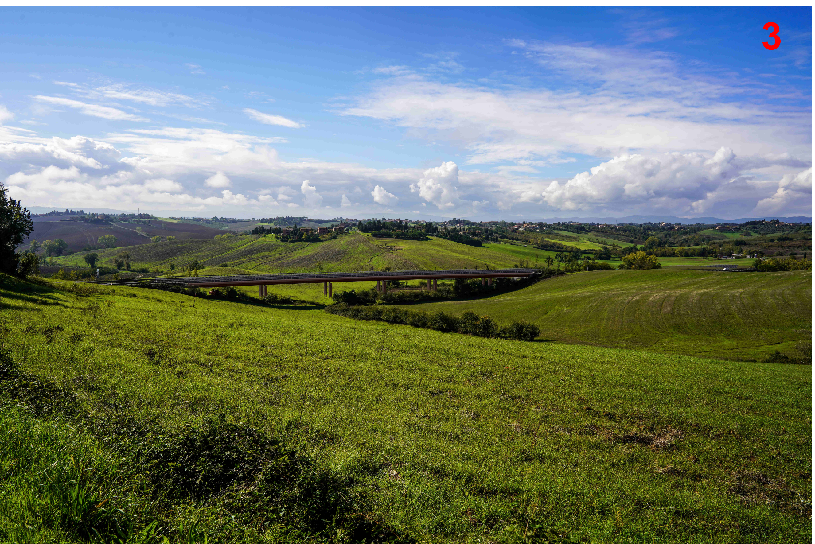
Viadotto Ribucciano progetto