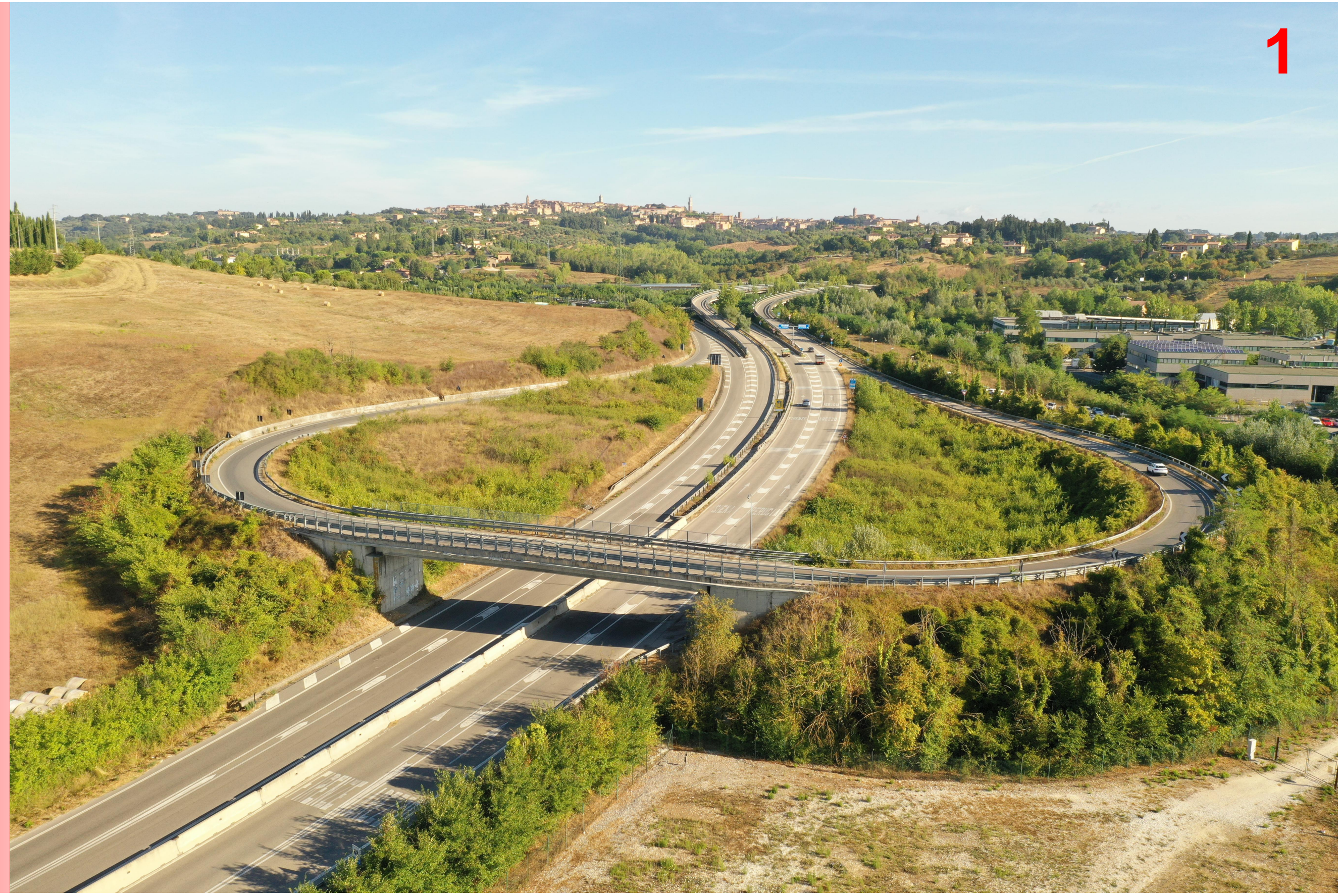
Svincolo Cerchiaia stato di fatto