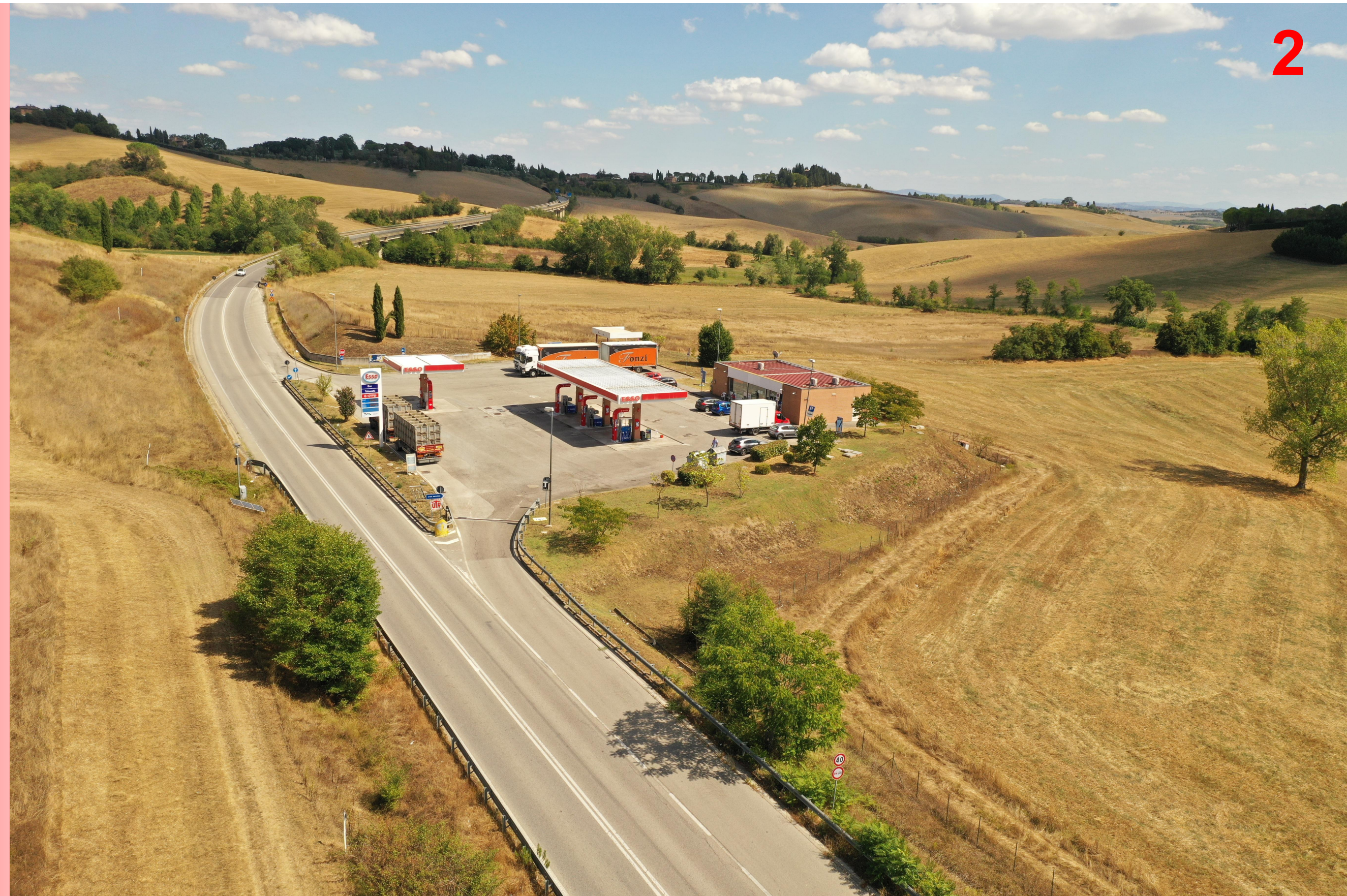
Tratto stradale tra viadotto Valli e viadotto Ribucciano stato di fatto