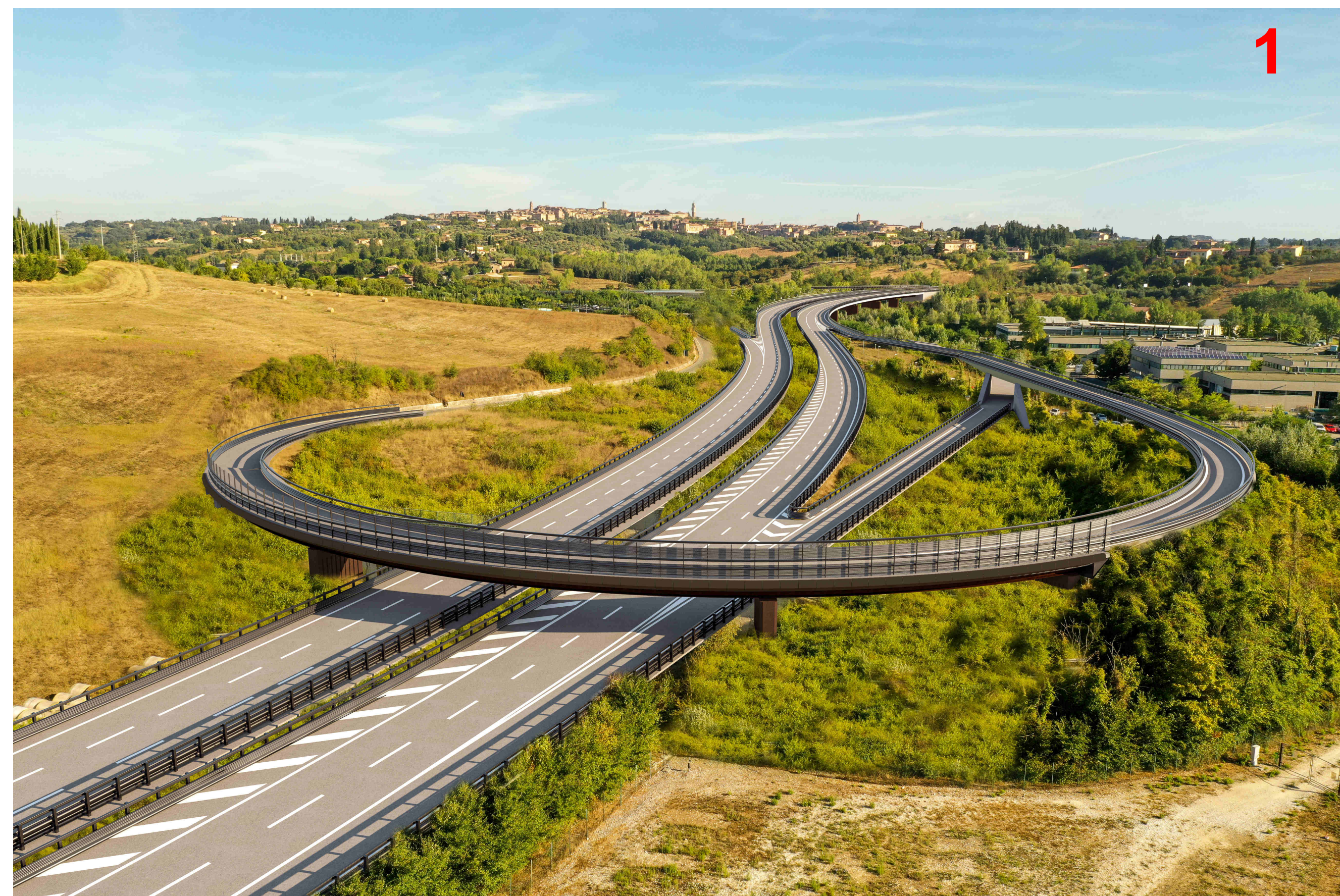
Svincolo Cerchiaia progetto