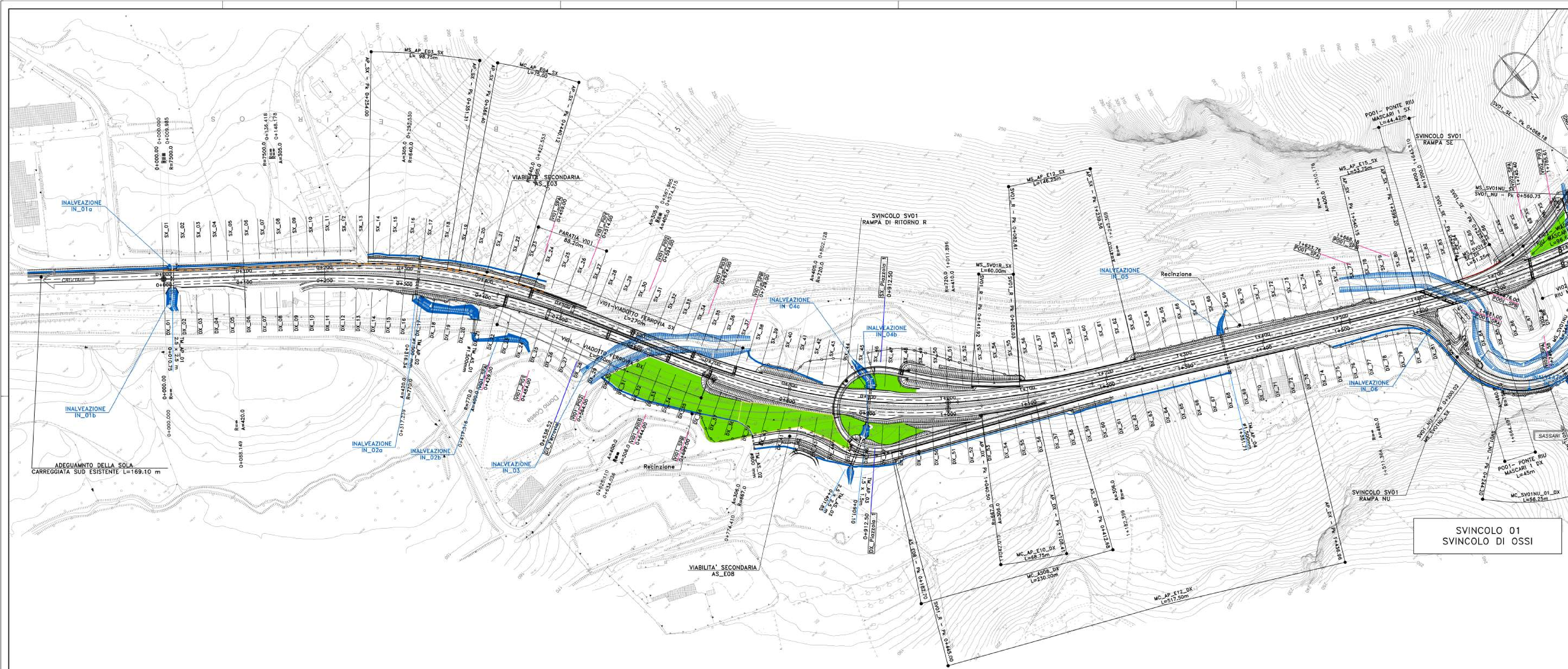
SVINCOLO 01 SVINCOLO DI OSSÌ