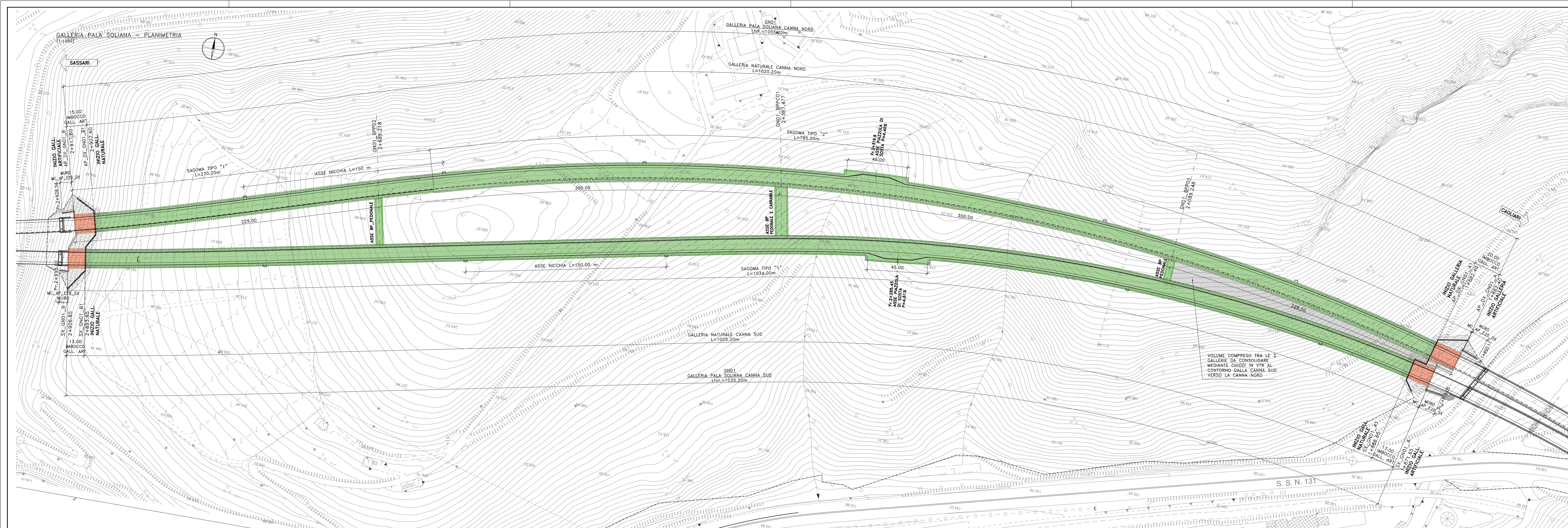
PIANTA CHIAVE SASSARI